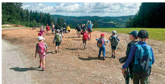
Během celého roku pořádá KoCeRo pro děti nespočet aktivit.

Významným milníkem byl rok 2009, kdy KoCeRo začalo poskytovat dvě registrované sociální služby podle zákona o sociálních službách – nízkoprahové zařízení pro děti a mládež a terénní