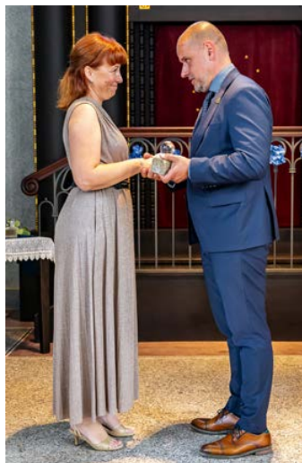
Slavnostní večer v synagoze připomněl, jak důležitou roli hrají ve městě lidé, kteří svůj čas a energii věnují druhým.

„Každý z letošních laureátů působil v jiné oblasti, ale všechny spojuje jedna věc – ochota věnovat svůj čas, energii a často i velkou část života druhým lidem a našemu městu. Jsem rád, že jim dnes můžeme alespoň symbolicky poděkovat za vše, co pro Český Krumlov vykonali,“ uvedl starosta Alexandr Nogrady.