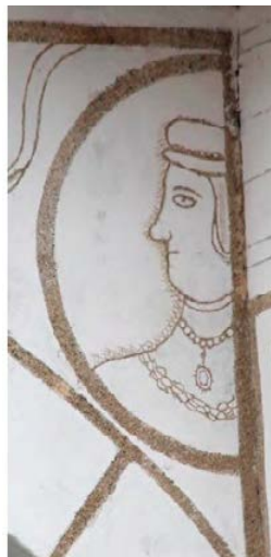
Jediné známé portrétní medailony Anny z Rogendorfu a Jošta III. z Rožmberka najdete na fasádě vdovského paláce. Annin se bohužel nedochoval celý.