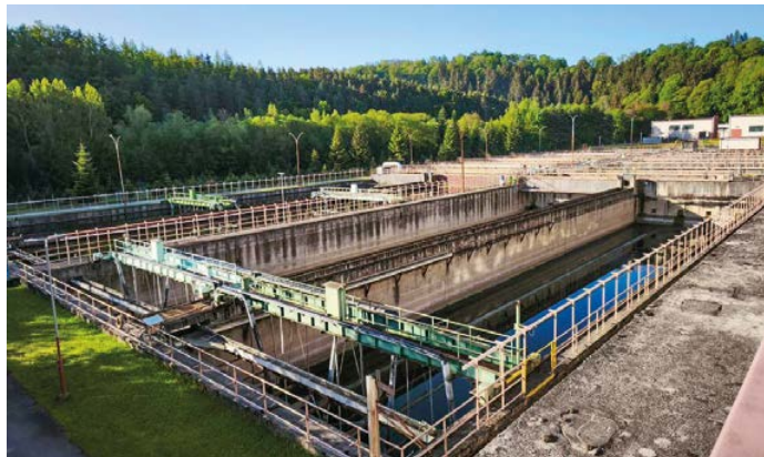
ČOV Český Krumlov

Třebaže před nákupem čistírny v roce 2018 byla projednána v zastupitelstvu zpráva o technickém stavu čistírny s odhadem nákladů na opravy ve výši 30 milionů korun, další vývoj ukázal, že šlo o naprosto zavádějící informaci potřeby financí vzhledem ke skutečnému stavu opotřebení ČOV. Nezávislé posudky z let 2022 a 2023 vyčíslily potřebné investice do technologie na více než 100 milionů korun,