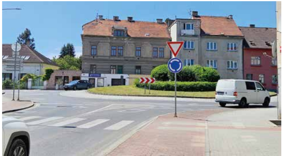
Na místě dvou domů vznikne nový dopravní koridor, který odvede dopravu z ulice Čelakovského a zajistí přístup do jižní části bývalých kasáren.

Jedním z nejvýznamnějších prvků celé stavby bude nový sjezd ve směru od Prahy.