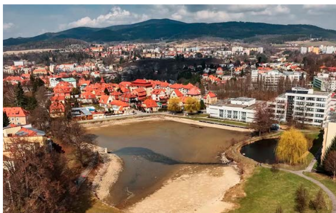
Rybník se postupně znovu napouští, úpravy mají zlepšit kvalitu vody před letní sezónou.

Součástí zásahu byl výlov velkého i malého rybníka, které jsou nyní postupně znovu napouštěny vodou z Drahoslavické rybníční soustavy. Zároveň pro-