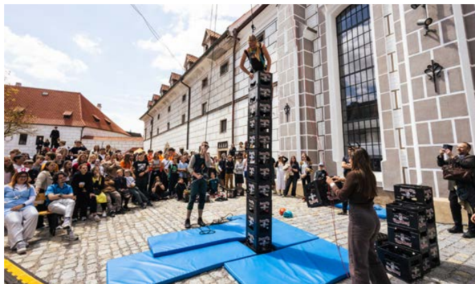
Zábavný program na nádvoří Portu 1560 čeká na všechny příchozí.

Českokrumlovský Majáles je unikátní svou naprostou otevřeností a opravdovostí. Není to akce „pro studenty“ organizovaná dospělými, ale událost, kterou si připravují mladí lidé sami pro sebe i pro širokou veřejnost. Studenti drží v rukou vše od dra-