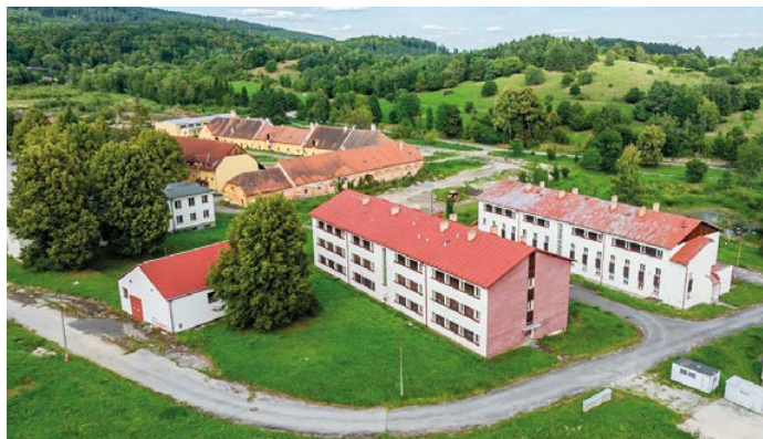
Bývalé kasárenské budovy se brzy začnou měnit na byty pro trvalé bydlení.

Dalším krokem je rekonstrukce dvou objektů v bývalých kasárnách (A14), se kterou chceme začít do poloviny letošního roku. Jeden z objektů bude opět zařazen do bytového družstva Blanský les. Všechny 17 bytových jednotek je již obsazeno novými družstevníky, kteří rozšíří stávající družstvo. Druhý objekt