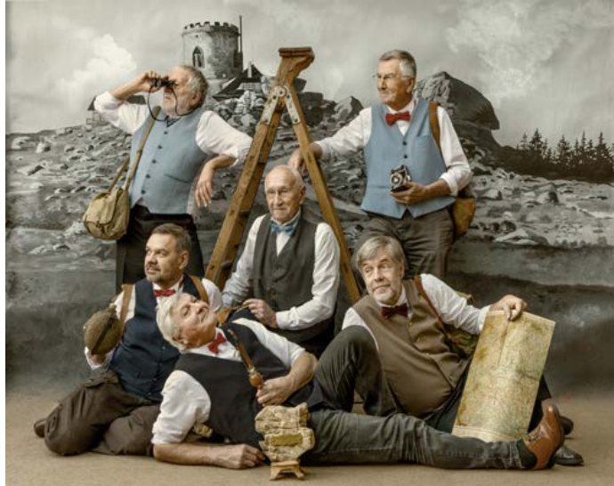
Novodobá společnost Žebříkového kamene před malovaným fotografickým pozadím s motivem Kletě.

První, nejstarší vskutku kleťáckou turistickou partou byli Leitersteineri, skupina veselých a zároveň turisticky, ba i horolezecky zdatných chlapíků z Českých Budějovic. Od roku 1906 se scházeli jako stolní společnost v hostinci u Orthů v Linecké ulici a později také ve svém spol-