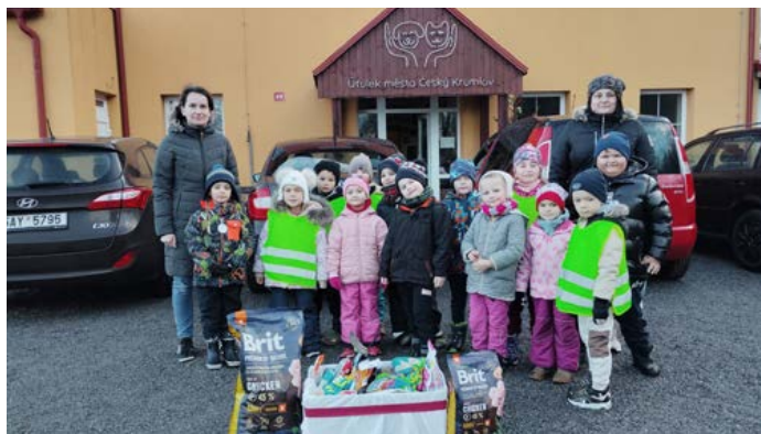
Také děti ze škol a školek přinesly zvířátkům něco dobrého k snědku.