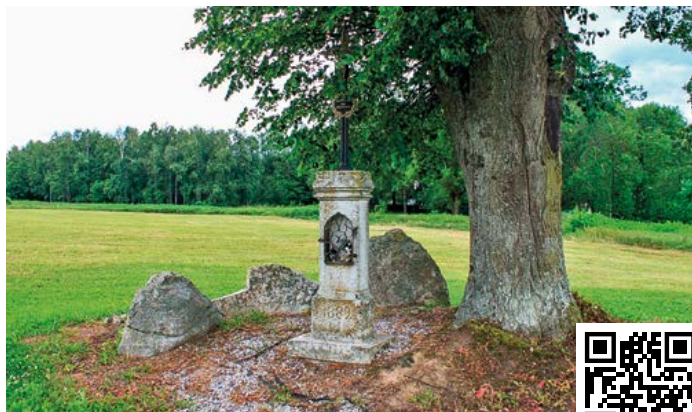
Litínový kříž v Černé v Pošumaví