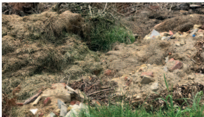
Stavební suť mezi biomasou

V srpnu oslaví významné životní jubileum: