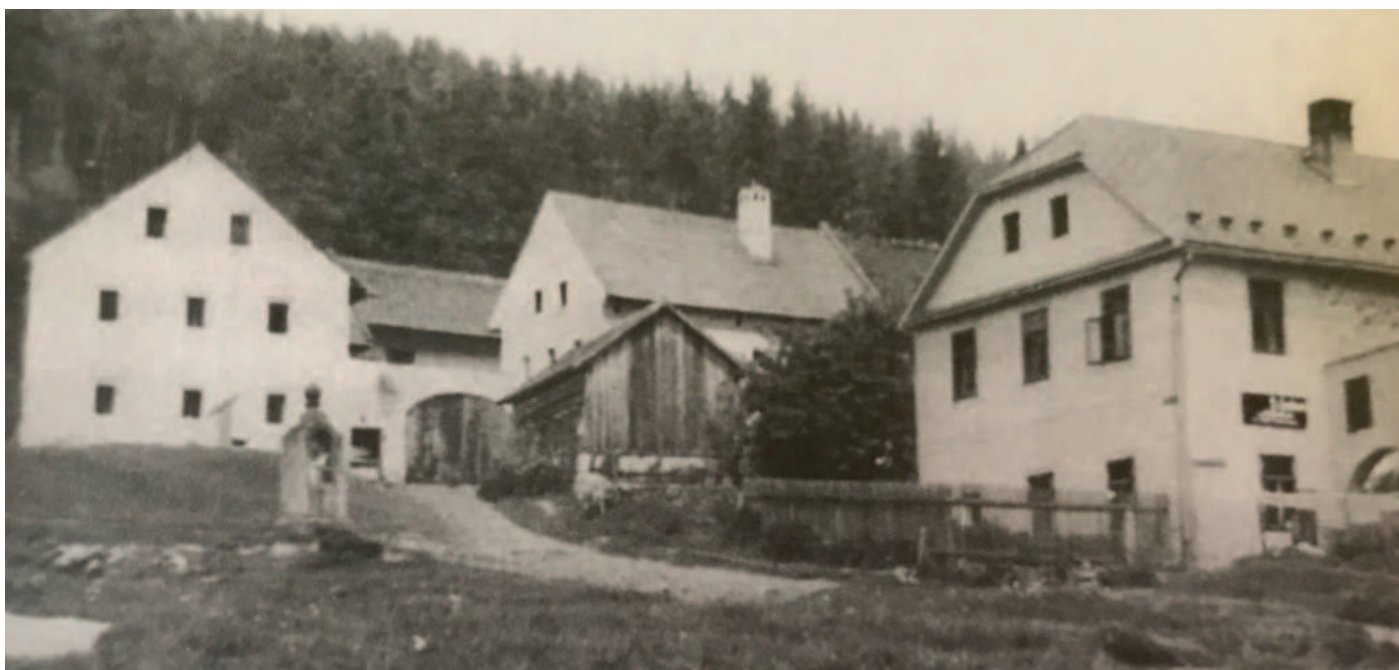
Žumberk ve 30. letech