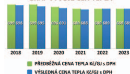
GRAF VÝVOJE CEN TEPLA

Jednoduše to znamená, že za rok 2023 nedojde k žádné formě vyúčtování. Tato pozitivní zpráva přichází v době, kdy mnozí čelí ekonomickým výzvám. My jsme se ale zavázali městu a vám, Prachatičákům, dodávat spolehlivé a efektivní zásobování teplem a teplou vodou.