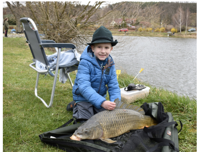
Dětské rybářské závody na Chlumanském rybníce 23.3.2024