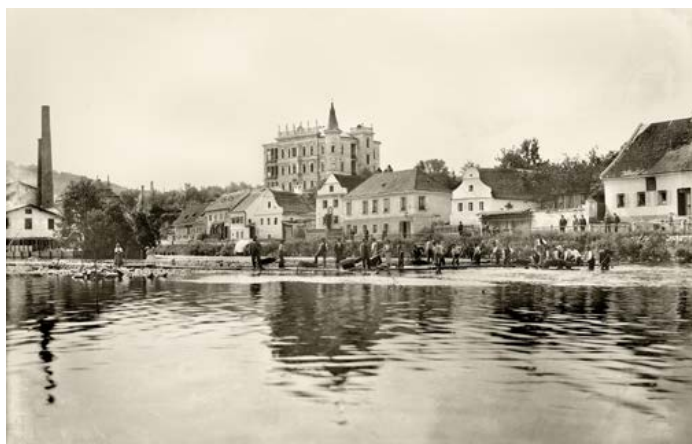
Vila Ignaze Spiro v Českém Krumlově na Plešivci čp. 268. Foto: Josef Seidel, 1894

Věže i věžičky, vysoké i nízké, baňaté i špičaté často kromě toho, že jsou velkou ozdobou, bývají i vhodným úkrytem pro „vzkaz budoucím generacím“. Na dotek nebes mohou být uschovány dopisy určené potomkům, soudobé fotografie, mince, noviny a podobné „poklady“. Před 130 lety ukryl ve své vile na Plešivci podobný vzkaz jeden z nejvýznamnějších zdejších podnikatelů, Ignaz Spiro.