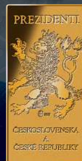
společná zadní strana