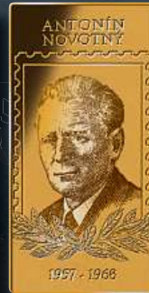
Antonín Novotný 1957 - 1968