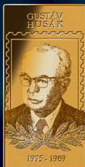
Gustáv Husák 1975 - 1989