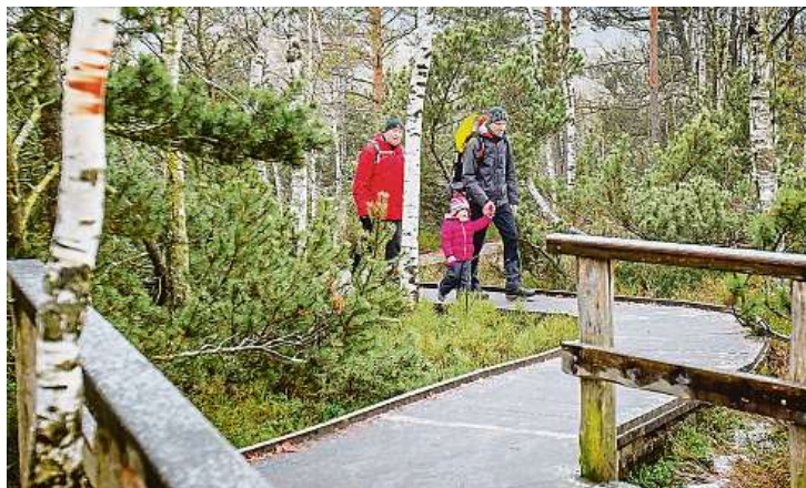
Mezi nejnavštěvovanější místa na Šumavě patří slatě, kam pro turisty vedou dřevěné chodníčky.