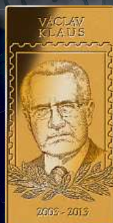
Václav Klaus 2003 - 2013