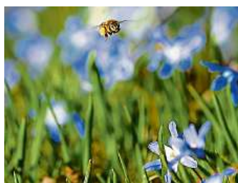
Zahrádkáře čeká „síchtá“. Příroda se probudila.

S blížícím se jarem je potřeba urychleně dokončit zimní řezy stromů, pokud jste je již neprovedli v před-