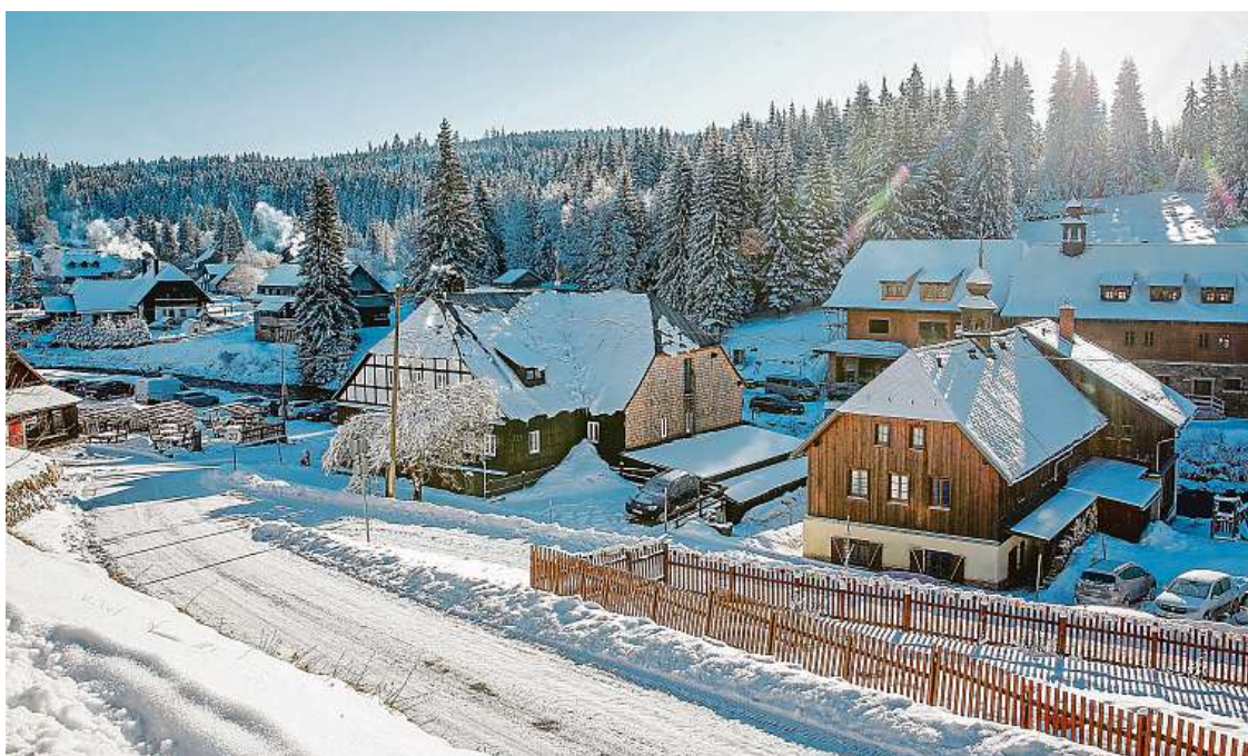
Tak vypadala Modrava začátkem ledna, kdy na Šumavě panovala pravá zima.