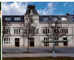
EFI SPA Hotel**** Superior & Pivovar