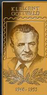
Klement Gottwald 1948 - 1953