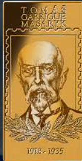
Tomáš Garrigue Masaryk 1918 - 1935