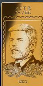
Petr Pavel 2023