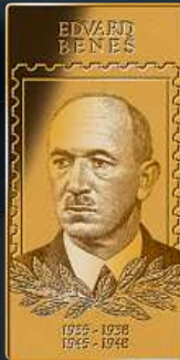
Edvard Beneš 1935 - 1938 / 1945 - 1948