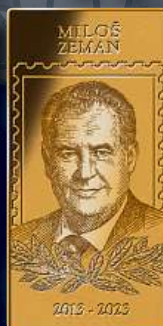
Miloš Zeman 2013 - 2023