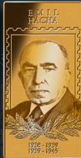
Emil Hácha 1938 - 1939 / 1939 - 1945