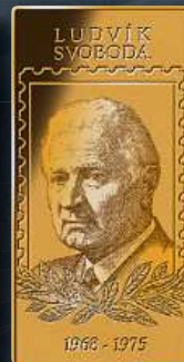
Ludvík Svoboda 1968 - 1975