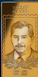
Václav Havel 1989 - 1992 / 1993 - 2003