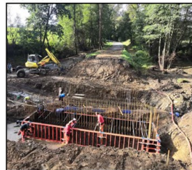
OPRAVA MOSTU. Oprava mostu na silnici směrem na přehrada probíhá podle plánu.

Často to byla různá výročí a významné dny, takže také