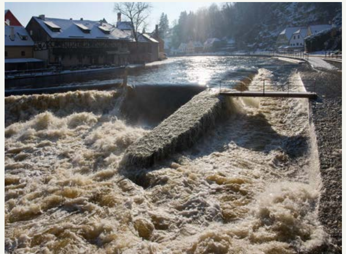
Termín náročné opravy jezu byl Povodím Vltavy dlouho zvažován a zohledňován. Bohužel, příroda nebere na takovéto plány ohled a může zaslat povodeň nebo oblevu kdykoli.