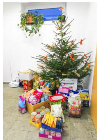
Zlomek nadílky pro útleková zvířata

Na oplátku tu pro všechny dvounožce bylo připraveno občerstvení, o které se postaral obchodní dům Kaufland, který Psí Vánoce každoročně podporuje. K podpoře útulku se letos připojila také Super zoo, která na svých prodejnách v Českých Budějovicích uspořádala sbírku, aby pak mohla krumlovské svě-