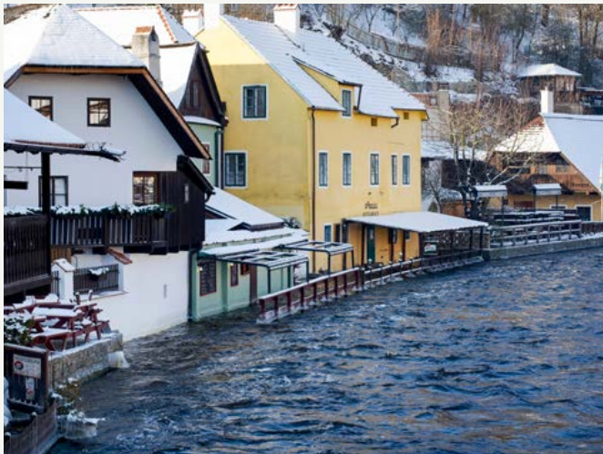
Škody budou majitelé sčítat, až voda opadne.

Závěrem chci poděkovat všem členům bezpečnostních složek, kteří pomáhali povodeň zvládnout a všem lidem, kteří nabízelí a poskytli svou pomoc. Držme si pěsti, věřím, že už je to za námi a že brzy budeme chodit náplavkou kolem klidné Vltavy.