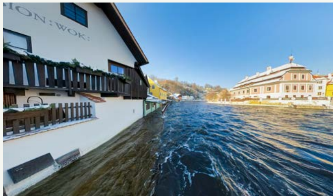
Povodni nejvíce zasažené domy v Rybářské ulici. V nejkritičtější okamžik dosáhla hladina Vltavy 226 centimetrů.

O Vánocích jsme tak během několika hodin měli Vltavu na 3. stupni povodňové aktivity, který se s občasným kolísáním udržel do první lednové dekády. Připomenou, že 3. SPA je kritickou hodnotou, kdy hrozí nebezpečí vzniku škod většího rozsahu v záplavovém území. Následně začala hladina postupně klesat