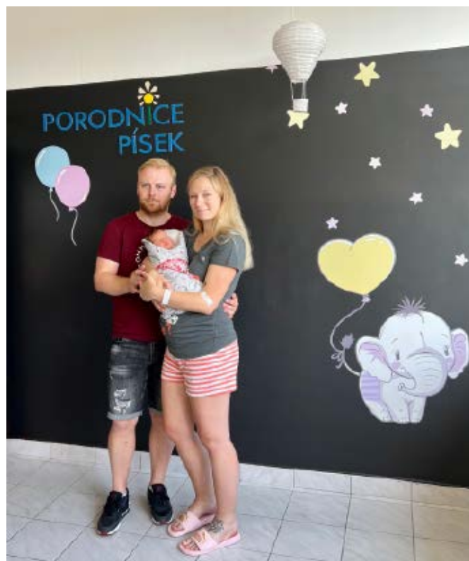
První okamžiky s miminkem si v Nemocnici Písek můžete zvěčnit ve stylovém fotokoutku.