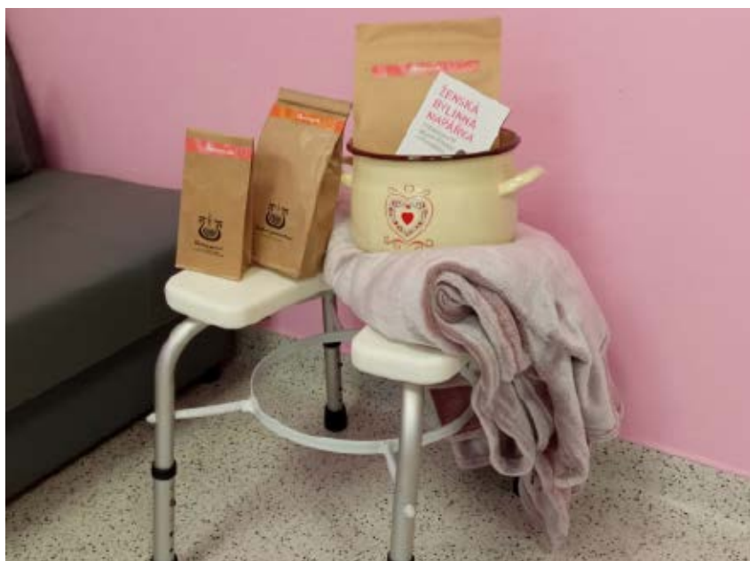
Bylinná napáčka je přírodní metodou, která ženě uleví od porodních bolestí a uvolní porodní cesty

Při takzvaném šátkování se využívá nepružný „podpurný pás“ nebo rebozo (tradiční mexický šátek). Tento pás se podle potřeby uvazuje kolem trupu těhotné ženy. Šátek zpevňuje břišní stěnu, zmírňuje bolesti zad a kyčlí, podporuje správnou polohu dítěte, zlepšuje hojení jizev po operačním porodu a je praktickým pomocníkem i po spontánním porodu. Má tedy využití v těhotenství, při porodu i v šestinedělí. Šátek nastávajícím maminkám v porodnici Nemocnice Strakonice, a.s., rádi půjčíme nebo nabídneme k zakoupení; porodní asistentky je naučí, jak ho správně používat.