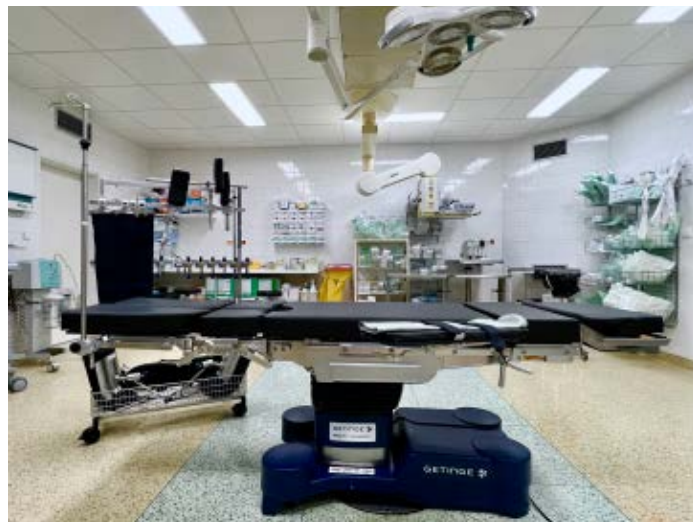
Nový operační stůl na sále.