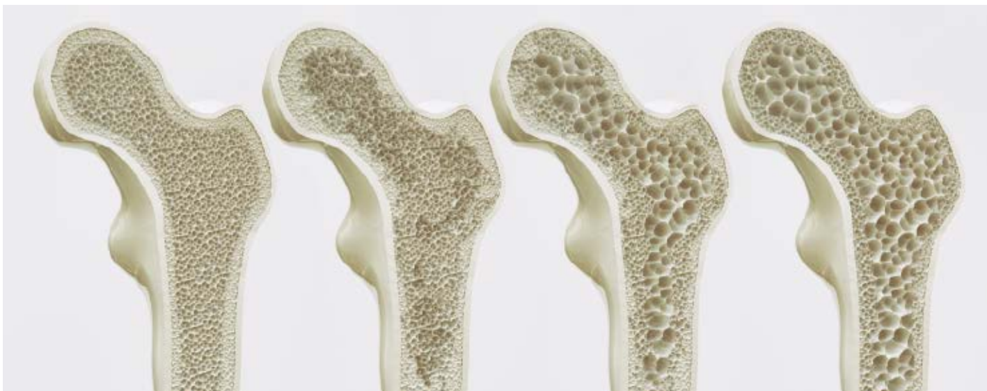
Čtyři fáze osteoporózy