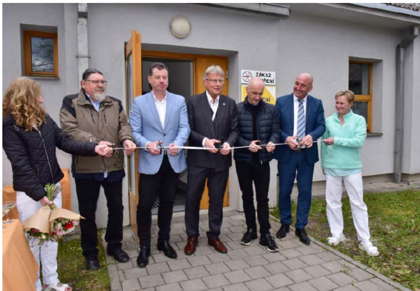
Slavnostní zahájení provozu nového SPECT/CT v dubnu roku 2023

Oddělení nukleární medicíny Nemocnice Strakonice, a.s., získalo novou gama kameru. Jedná se o diagnostický systém SPECT/CT, který umožňuje provádět vyšetření v lepší diagnostické kvalitě. Součástí této dodávky za více než 27 milionů korun byl také laminární box a příslušenství. Finance na pořízení nového přístroje získala Nemocnice Strakonice, a.s., z operačního programu Ministerstva pro místní rozvoj REACT-EU.