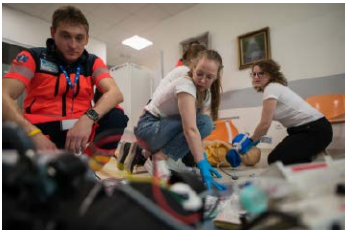
Soutěžící při plnění jedné z disciplín soutěže Medik roku 2023