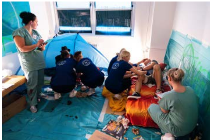
Připravené disciplíny vypadaly velmi reálně. Studenti například ošetřovali drogově závislé, kteří se ve svém doupení poprali. Nejen výkony studentů, ale i figurantů, byly obdivuhodné.

Jihočeská sestřička se koná od roku 2015. Za tu dobu se v organizaci vystřídalý nemocnice v Prachaticích, Českém Krumlově, Písku, Strakonících, Táboře, Českých Budějovicích a Jindřichově Hradci. Letošním prachatickým ročníkem se vrátila do místa svého vzniku a odstartovala tak druhé kolo putování po jihočeských nemocnicích. Poděkování patří všem partnerům soutěže, bez kterých by to nešlo.