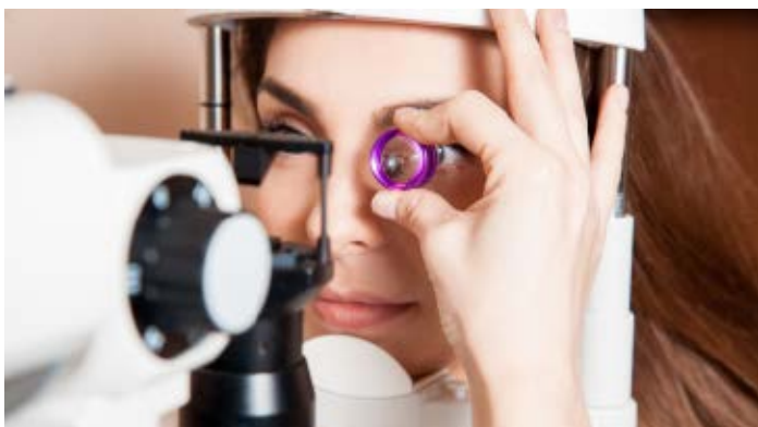
Pacientka při vyšetření očí

Diabetik by měl doporučeně preventivně periodicky podstupovat vyšetření, které obvyklé komplikace odhalí včas. Vyšetření v českokrumlovské nemocnici je prováděno bez nutnosti rozkapání očí a výsledek je k dispozici do deseti minut. Jednou ročně má pacient právo na jeho uhrazení zdravotní pojišťovnou. Toto vyšetření je vhodné především pro pacienty, kterým byla cukrovka diagnostikována nově a netrpí diabetickou retinopatií ani dalšími očními onemocněními. Objednat se na vyšetření je možné přes e-mail diabetologie@nemck.cz ; je třeba uvést osobní údaje pacienta – celé jméno, rodné číslo a kontakt; či telefonicky, a to v pondělí nebo ve čtvrtek v čase od 9:00 do 12:00 hodin na telefonním čísle 380 761 309.