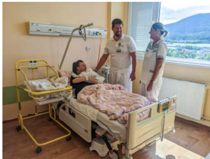
Pokoj na oddělení šestinedělí