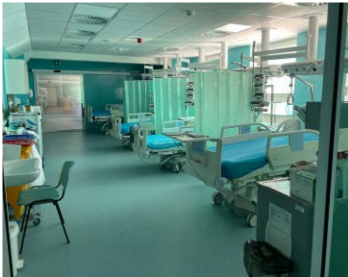
CHIR JIP po rekonstrukci