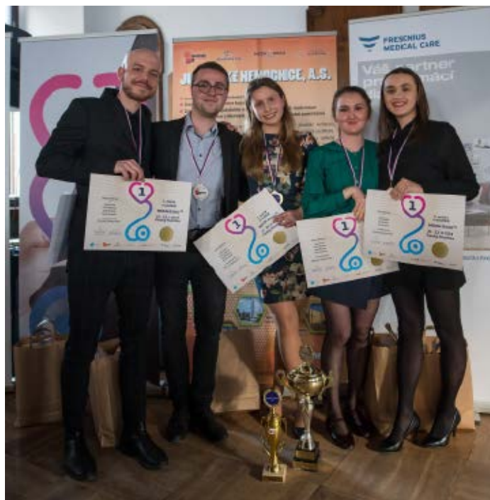
Vítězný tým soutěže Medik roku 2023