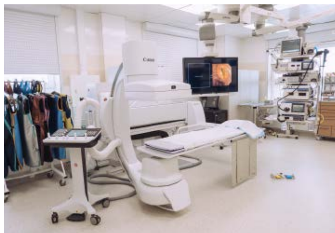
Terapeutický sál endoskopického centra vybavený endoskopickou a rentgenovou technikou