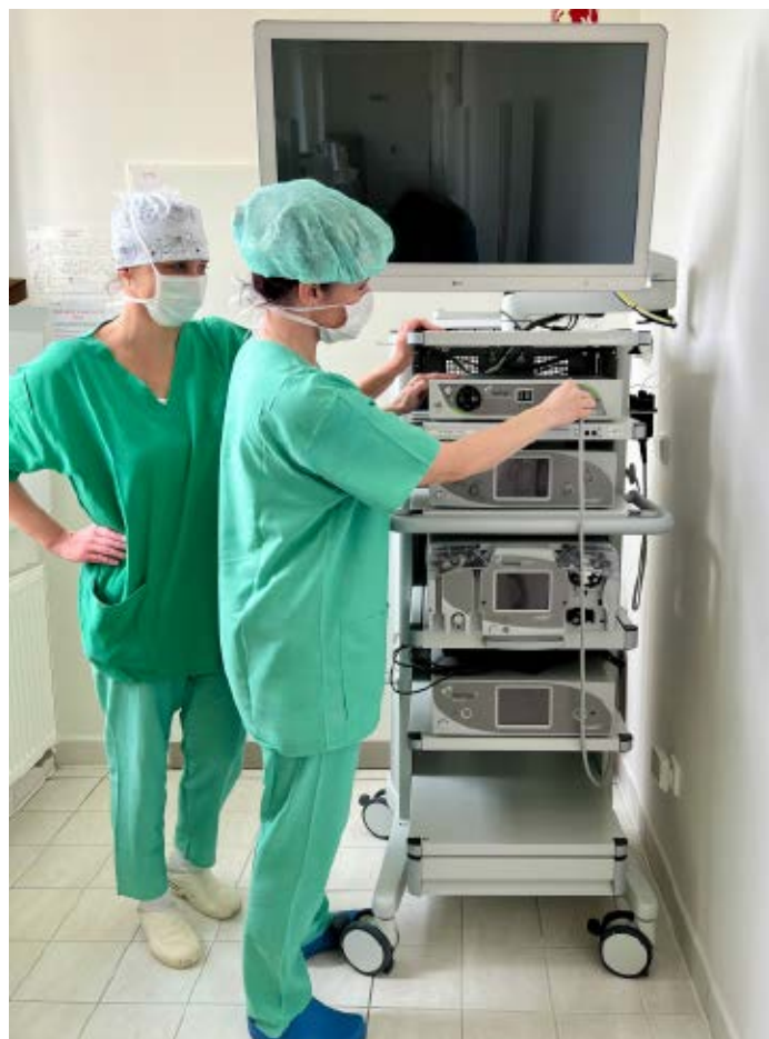
Nová arroskopická sestava k šetrným operacím kloubů.

Pacienti po výměně kloubů, kteří mají během hospitalizace problémy s rozvířením končetiny, mohou v písecké nemocnici využít možnosti navazující rehabilitační péče na lůžkovém oddělení, což v řadě zdravotnických zařízení nebývá běžné. „Pro tyto účely máme v nemocnici Oddělení akutní rehabilitace. Část pacientů odesíláme přímo do lázeňské péče nebo na Oddělení následné péče s rozšířenou rehabilitací,“ doplnil předseda představenstva Nemocnice Písek, a.s., Jiří Holan.