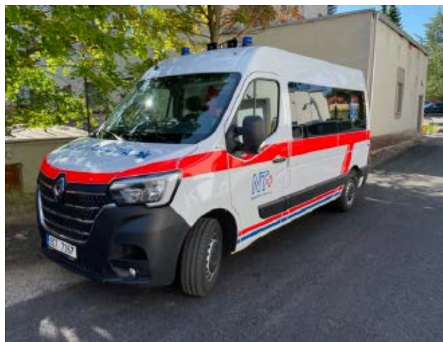
Nový sanitní vůz