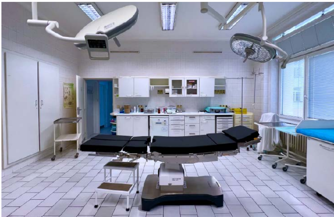
Písečtí ortopedi využívají nejmodernější techniku – tento nový operační stůl slouží k zákrokům na ambulanci.

Ortopedická a úrazová péče Nemocnice Písek, a.s., překonává loňský rok, a to jak počtem operací, tak množstvím ošetřených úrazů. Všechny zákroky se přitom provádějí pomocí nejmodernějších přístrojů i metod.