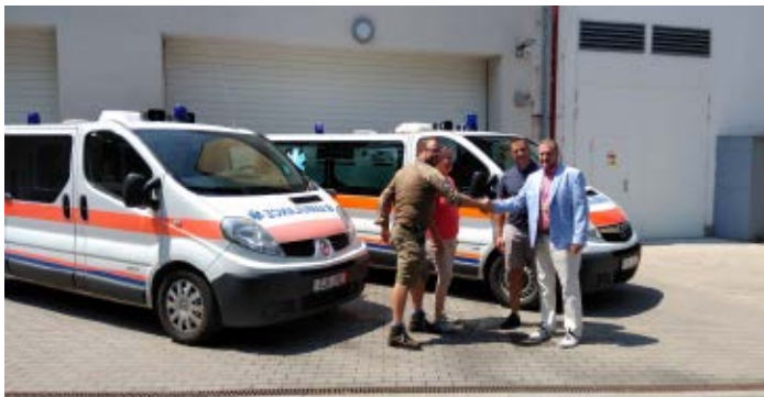
Předání sanitek pro Ukrajinu

I přesto ale věříme, že pomohou zvládat náročnou situaci v této oblasti a třeba někomu zachrání život.