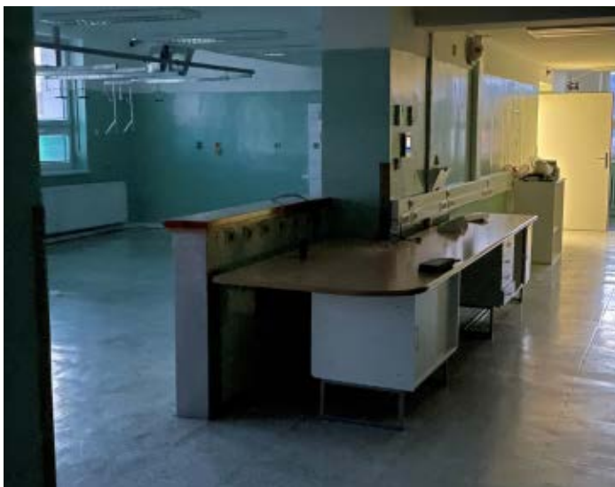
Původní podoba chirurgické JIP před rekonstrukcí

Na chirurgické JIP pečují sestry a lékaři především o pacienty, které je třeba monitorovat po náročnějších operačních výkonech. „Pečujeme o pacienty po operacích v dutině břišní, po amputacích, ale i o pacienty po úrazech hlavy. Odpočinou si u nás jeden nebo dva dny, někdy déle, a pak je překládáme na standardní pokoj na oddělení chirurgie,“ upřesňuje staniční sestra Dana Balláková.