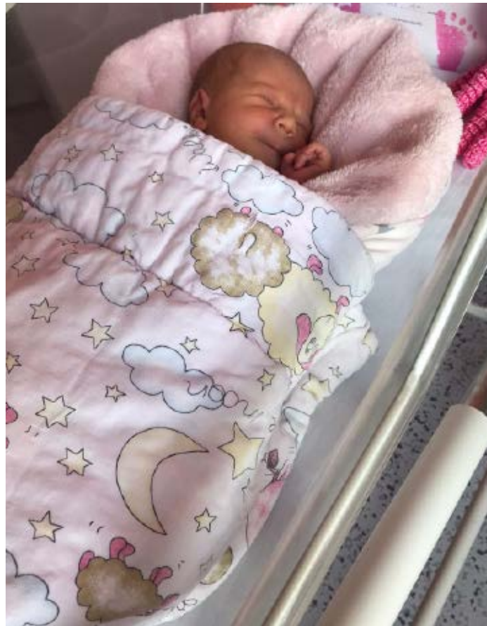
Novorozenec v hnízdečku, kde se cítí bezpečně a je klidný