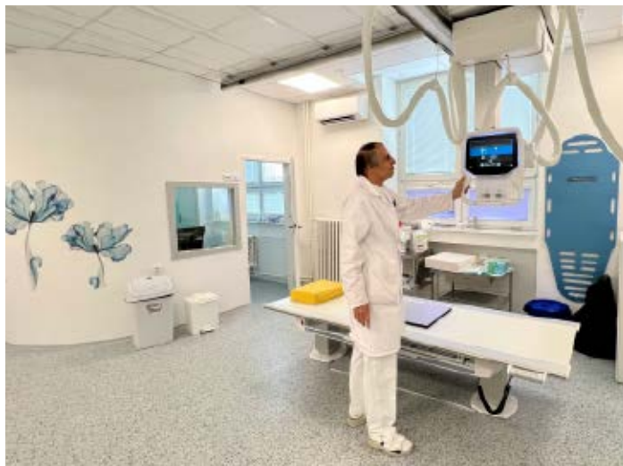
Nový digitální rentgen.

Vedle špičkové zdravotní péče v Písku pamatují i na zpříjemnění pobytu pacientů v nemocnici. Investuje se zde do rekultivace a údržby rozsáhlého areálu, modernizace budov nebo například do posílení ochrany digitálních dat.