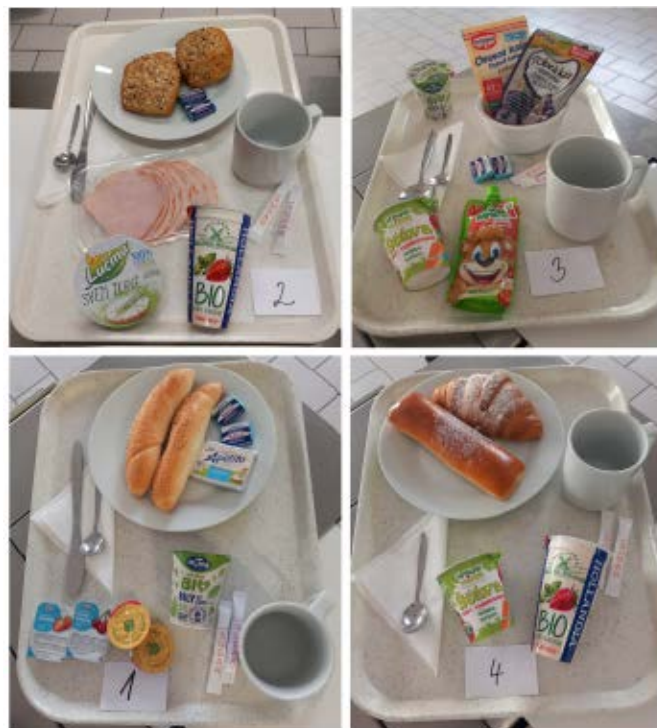
Rodičky v Písku mají na výběr ze čtyř druhů snídaně.

Nemocnici Písek, a.s., mohou kontaktovat maminky, které mají potíže s kojením. Dětské a dorostové oddělení pro tyto účely otevřelo Ambulanci pro laktační poradenství. Vyškolené laktační poradkyně jsou k dispozici ženám, které mají problémy s kojením, a nastávajícím maminkám, jež kojení teprve čeká a chtějí se na ně co nejlépe připravit. Ambulance je umístěná v prostorech dětské ambulance a lze ji navštívit pouze na základě objednání. To je možné každý všední den v čase od 8 do 10 hodin na telefonních číslech: 382 772 206 a 382 772 472.