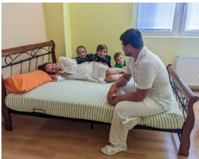
Porodnice s rodinnými příslušníky