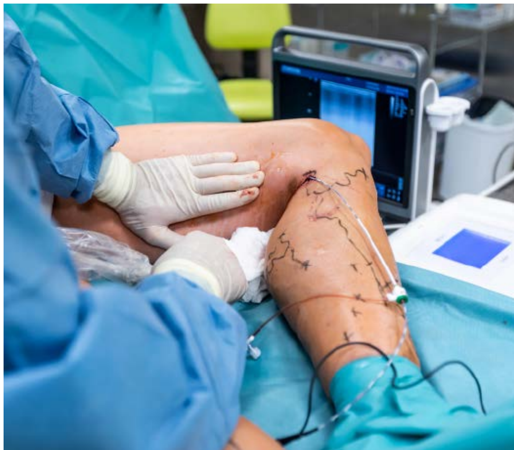
Ošetření křečových žil v písecké nemocnici je šetrné a bezbolestné.

Pokud patříte mezi 30 až 60 procent lidí, kterým ztrpčují život křečové žíly, nevěste hlavu. V Nemocnici Písek, a.s., si je můžete nechat šetrně odstranit a krátce poté nemocnici opustit. Zákrok je bezbolestný a díky zkušeným chirurgům a nejmodernější technice velmi ohleduplný k tělu pacienta.