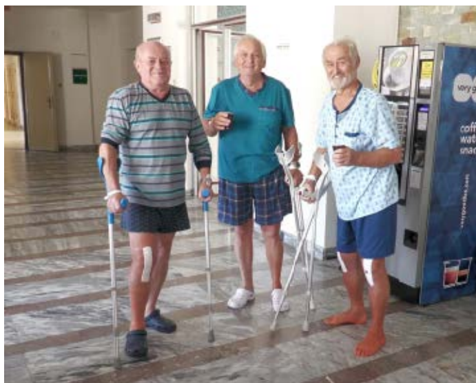
Naši pacienti po TEP u kávy