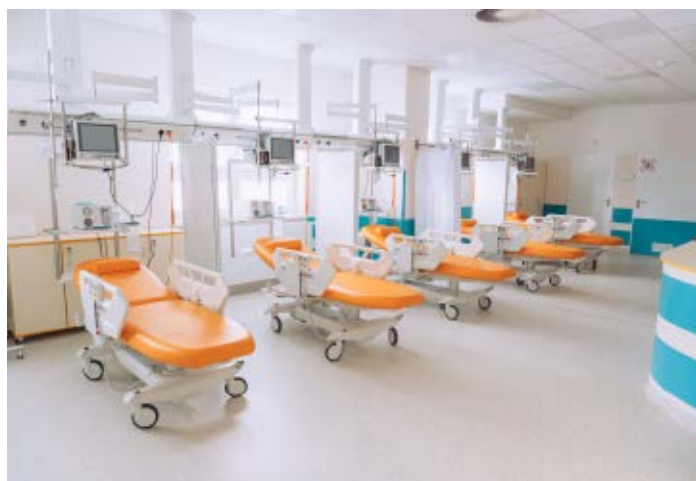
Dospávací pokoj endoskopického centra

Endoskopie také hraje klíčovou roli při vyšetření tlustého střeva (koloskopie) v programu screeningu kolorektálního karcinomu, což je jeden ze tří programů populačního screeningu nádorů v České republice; jeho účinnost potvrzuje klesající výskyt i úmrtnost na nádory tlustého střeva a konečnicku v naší populaci. Endoskopické centrum Nemocnice České Budějovice, a.s. je jedním ze zavedených screeningových center. Probíhá zde běžná diagnostika i endoskopická léčba všech typů lézí. Ošetřujeme také pacienty, kteří jsou k nám posíláni z dalších endoskopických pracovišť po téměř celém Jihočeském kraji. Díky technickému vybavení, kterým disponujeme,