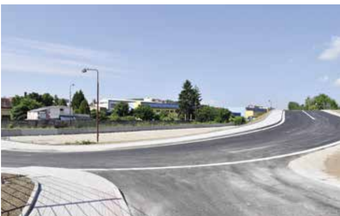
Nový úsek ulice Vinařického i přilehlé parkoviště slouží od léta.