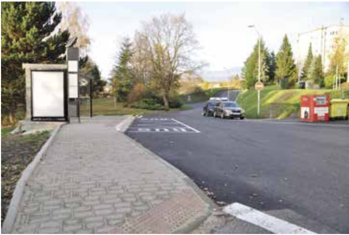
V ulici O. Jeremiáše je nejen nový povrch, ale i autobusová zastávka.