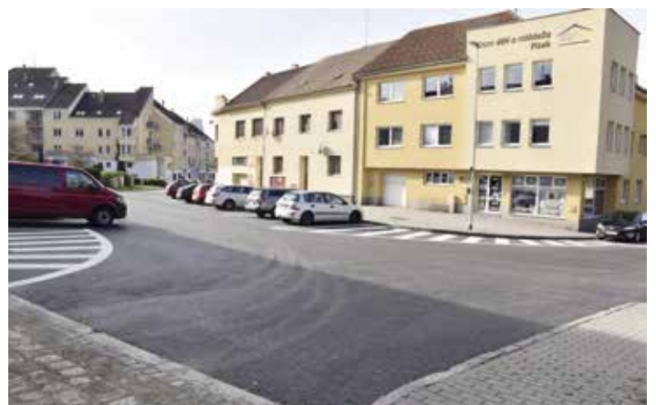
V části ulice Švantlova byl položen nový povrch, nové je i vodorovné dopravní značení.