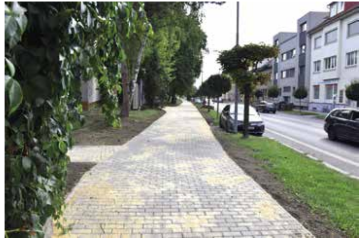
Starou dlažbu v části Nádražní ulice nahradila dlažba zámková.