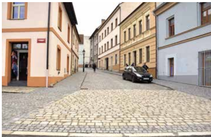
Kocínova ulice po opravě.

Město Písek vlastní desítky kilometrů komunikací, silnic a chodníků.