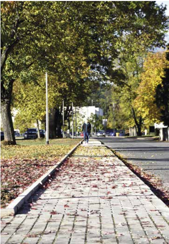
Nový chodník na Výstavišti.