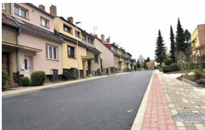
Ulice po rekonstrukci.