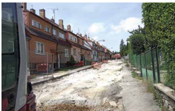
Snímek zachycuje průběh prací ve Strakonické ulici.