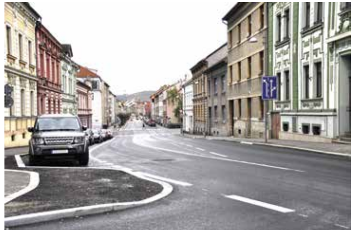
Opravený povrch v Purkyňově ulici.