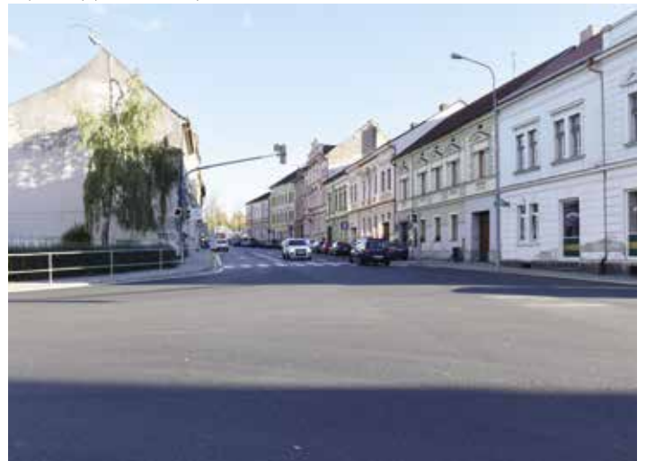
Nový povrch má i část Budějovické ulice.