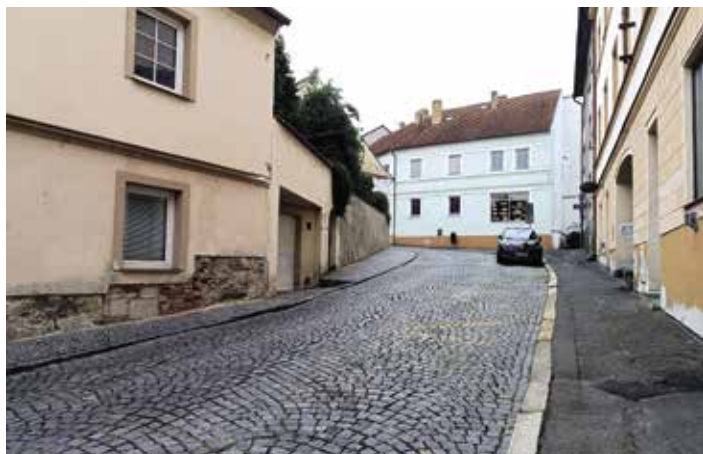
Kocínova ulice před rekonstrukcí povrchu.