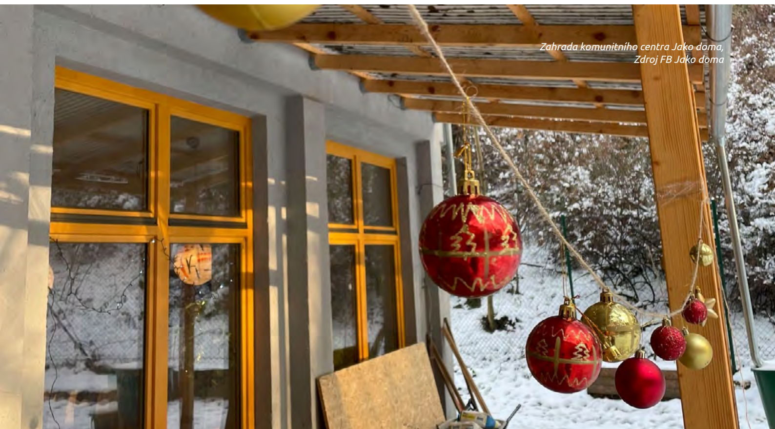
Zahrada komunitního centra Jako doma