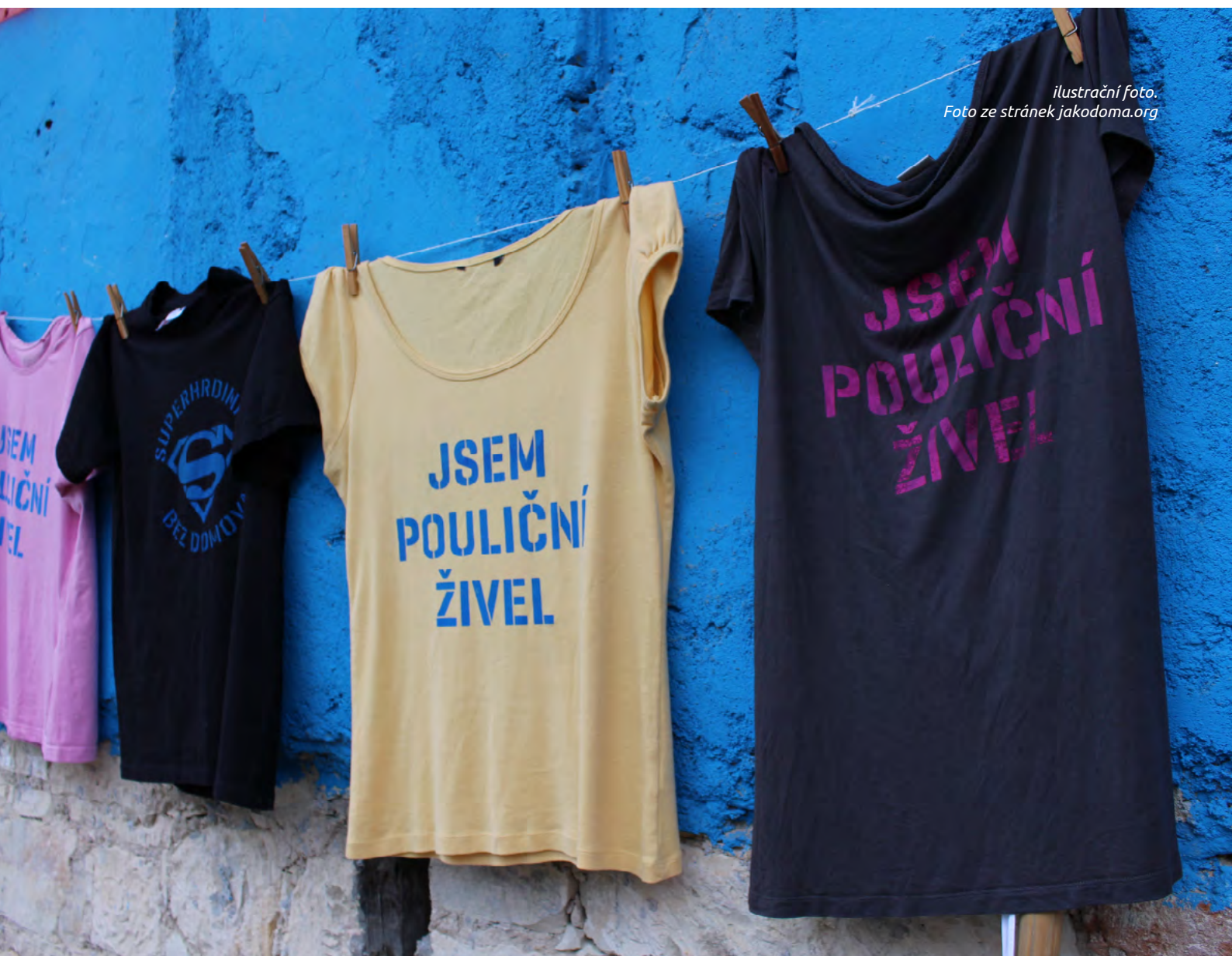
ilustrační foto.

TGEU. Coming Home: Homelessness among trans people in the EU . Evropská unie, 2021 [online, cit. 2023-11-28] Dostupné z: http://tgeu.org/wp-content/uploads/2021/12/tgeu-homelessness-policy-brief-en.pdf