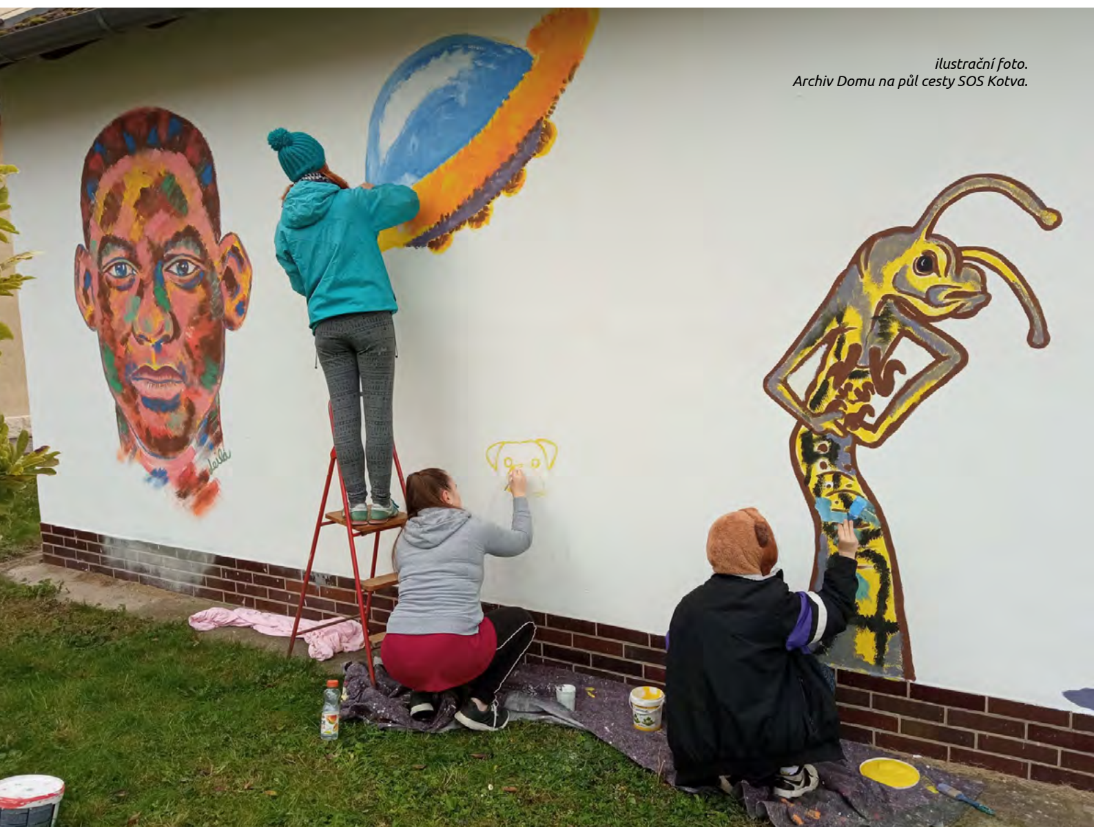
ilustrační foto. Archiv Domu na půl cesty SOS Kotva.