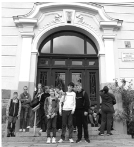
Žáci se s hosty setkali ve škole