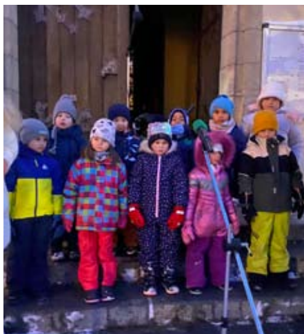
Vystoupení MŠ