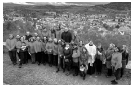
Tým Charity Sušice