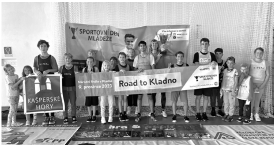
Děti si užily sportovní odpoledne