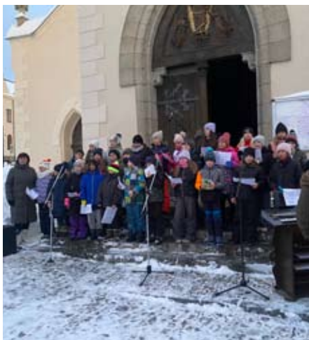
Vystoupení ZŠ