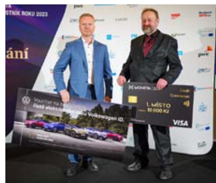
Slavnostní vyhlášení

Vítězové krajského kola se stávají zároveň celorepublikovými finalisty. Slavnostní vy-