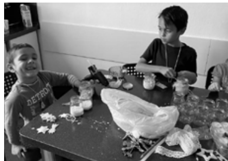
Společné tvoření

Také nacvičujeme na vánoční besídku taneč-