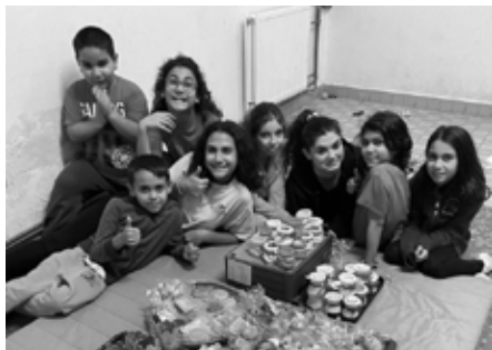
Děti se svými výrobky

Letošní podzim je moc krásný. Chodíme s tetami na procházky, sbíráme přírodniny a houby. Také jsme byli na moštování. Moštování bylo moc zajímavé. Museli jsme jablka umýt, nakrájet, rozstrouhat a pak už jsme je stlačovali ve sladký mošt. Každý z nás se podílel na této práci, a za to jsme dostali odměnu – ochutnat tuto dobrotu. Také jsme byli pouštět draky, foukal silný vítr a tak nám draci létali až do oblak, byla to velká zábava. S podzimem začalo