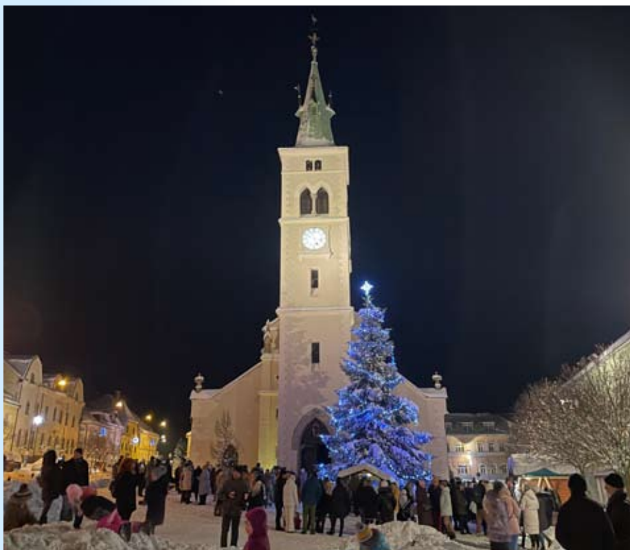
Vánoční strom letos zasypal před rozsvícením světél sniž

Rozsvícení vánočního stromu doprovázela hudba