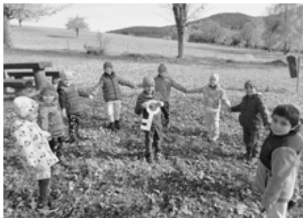
Podzim ve školce

Během podzimu se ve školce událo mnoho akcí. Hned na začátku října si naše děti ze třídy Včelek, Sluníček a i těch nejmenších Broučků připravily krátké vystoupení pro kašperskohorské seniory. Věříme, že díky této krásné akci se nám v dětech podařilo vytvořit povědomí o mezilidských hodnotách a vztazích. Akce se vydařila a těšíme se na další spolupráci příští rok.