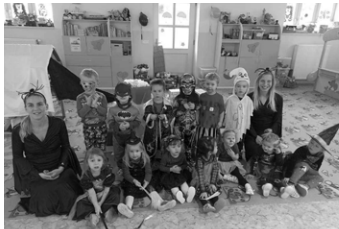
Strašidelný karneval