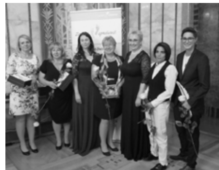
Z předávání ocenění Bílá vrána