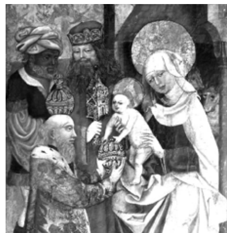
Klanění sv. Tří králů

a novoroční svátky přinesly lidem dostatek Božího požehnaní, spravedlnost, klid a mír!