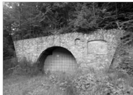
Zakonzerťovaná štola Naděje

Tady byl prováděn v devadesátých letech hlubinný průzkum, který měl vést k zahájení průmyslové těžby. Štola byla uzavřena v roce 2004 na základě rozhodnutí státní správy.