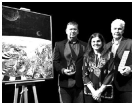
Z předávání ocenění Cena Ď

ředitelka Dětského domova Kašperské Hory