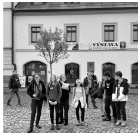
Soutěžní skupina