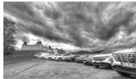
Nová vozidla

I z tohoto důvodu jsme nesmírně vděční, že se nám podařilo částečně obnovit vozový park díky programu IROP, pod Ministerstvem pro místní rozvoj, výzvě č. 101 Sociální infrastruktura se zvýšenou energetickou účinností. Celkem deset nových automobilů: osmkrát plug in hybrid, dvakrát elektrický (pět SUV 4x4, dva k rozvážení obědů a tři osobní vozy) splňujících parametry zvýšené energetické účinnosti nahradilo stávající vysloužilé, až dvacet let staré, automobily, což umožní kvalitnější a efektivnější poskytování pečovatelské