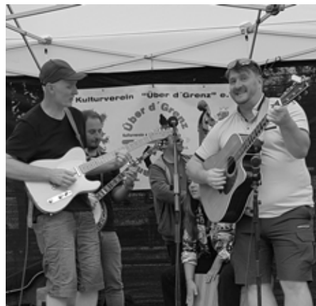
Divoký band

K festivalové neděli se přidalo i pozoruhodné muzeum „NaturparkWelten“ umístěné