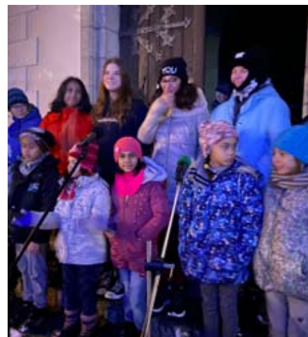
Vystoupení DD