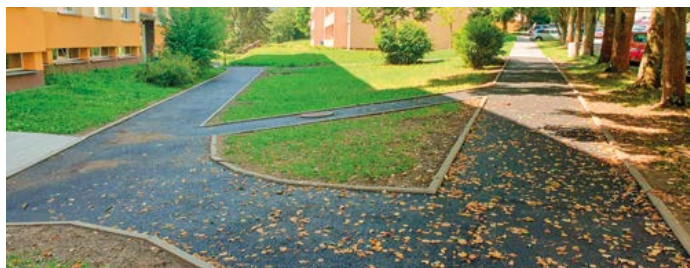
Nové chodníky na sídlišti Plešivec

Na ZŠ T. G. Masaryka se hlavní změny odehrály v exteriéru, v letošním roce škola získala nový umělý trávník na školním dvorku. Po opravách v učebně dílen pokračovala také rekonstrukce ZŠ Linecká, a to prove-