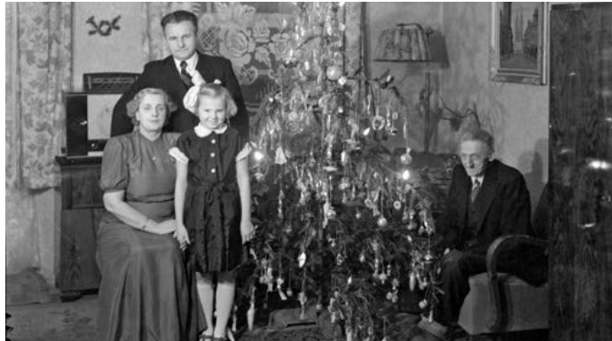
Štědrý den v Českém Krumlově