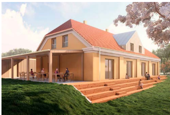
Vizualizace skautského domu ve Vyšném

Máme za sebou několik pracovních víkendů, kdy jsme spolu s našimi ochotnými rodiči s velkým nasazením čistili vlastní budovu i její okolí (několikrát sekali a hrabali trávu, pálili dřevo, uklízeli a třídili nepořádek), dělali jsme sondy na půdě a ko-