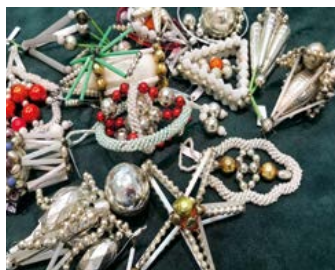
Prvorepublikové vánoční ozdoby

Velká část výstavy je věnována korálkovým ozdobám, které v dnešní době zažívají renesanci. K vidění jsou unikátní ručně vyrobené perličkové ozdoby z Poniklé v Podkrkonoší, kde se tento produkt zhotovuje v původní podobě od roku 1902 až