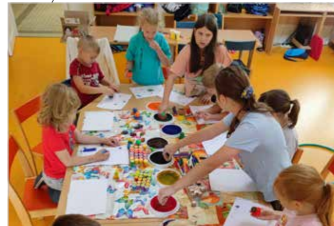
Příměstský tábor - léto 2023