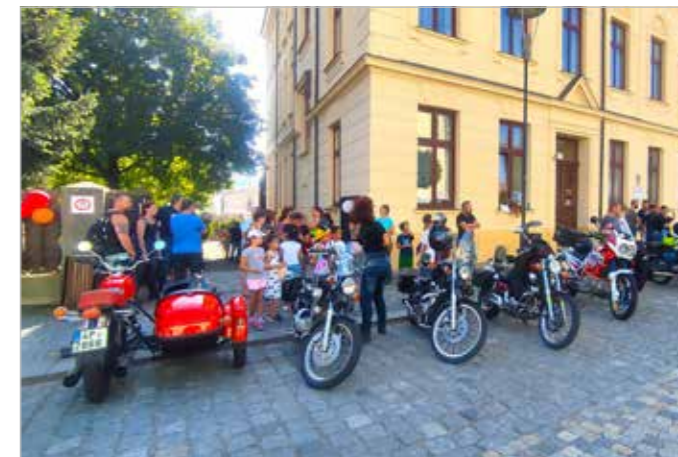
Akce dětského domova Loučení s létem