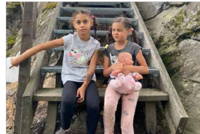
Děti z dětského domova na Výletě Plzeňské štafety