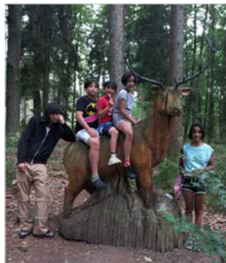
Jeden z výletů dětí při prázdninové štafety po zajímavostech Plzeňského kraje

O naše okolí se každý rok stará více lidí i my jsme se už několikrát zapojili do akce Uklidme Česko, a tak jsme se i tentokrát stali dalšími ochotnými pomocníky. V přírodě stále najdeme pohozené plastové lahve, obaly od tyčinek, igelitové tašky a jiné odpadky. Plasty negativně ovlivňují také zvířata, která je mohou omylem sníst nebo se do nich zachytit. Projděte se na pár minut v přírodě a zjistíte, kolik nepořádku lidé