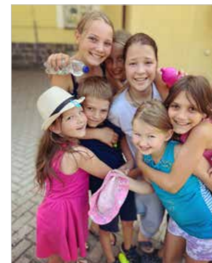
Fotografie zachycují výběr z aktivit a činností mladých účastníků příměstských táborů v Kašperských Horách o letních prázdninách 2023