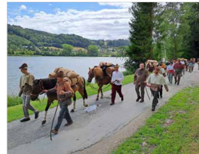
Soumarská karavana putovala mezi Rakouskem a Německem

U příležitosti slavnostního zahájení pochodu se konala večer 2. srpna v městě Schärding, který leží na řece Inn, historická slavnost, včetně slavnostního příchodu soumarské karavany do města. Tu tvořilo cca 40 osob, včetně starostů Grafenau a Schärdingu, a dále jedenáct koní.