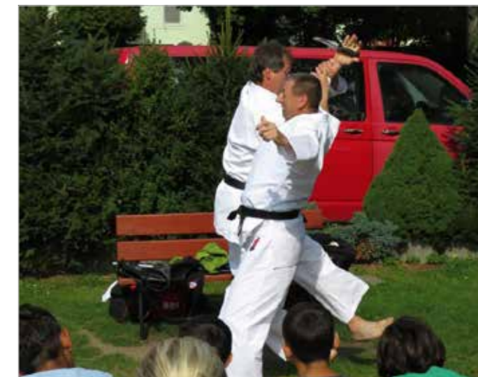
Trenéři karate předvedli dětem, jak se bránit násilí