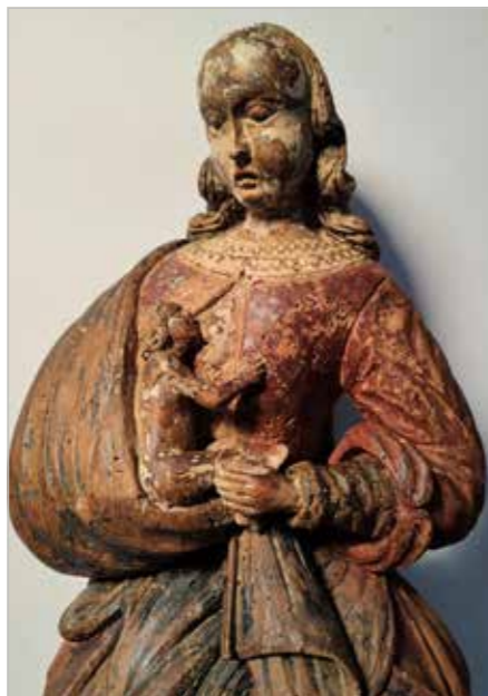
Kojící Panna Maria, polychromovaná dřevěná soška, horní Pootaví, asi 17. století, Muzeum Šumavy

Toto zobrazení má zřejmě svůj prapůvod v prostředí koptské církve, kde mohl působit příklad staroegyptského zobrazování panenské bohyně Eset (Isis) kojící svého syna Hóra. Téma kojící Panny Marie bylo v evropském umění oblíbené již od 14. století. Tridentský koncil v 16. století však takové zobrazování Panny Marie odmítl jako nepatřičné odhalování těl svatých. Tomuto zpátečnickému postoji, zdá se, by mohla dobře porozumět dnešní doba, kdy případné kojení na veřejných místech je často odmítáno jako nemravný akt, hodný zavržení. Kojící matky však zcela logicky argumentují, že jejich odhalené ňadro není v případě krmení potomka sexuálním atributem, ale symbolem mateřství. Proto není důvod ho skrývat. O toto nakonec šlo i ve vyobrazeních kojící Panny Marie ukazujících láskyplné jednání a zacházení matky s dítětem. Právě tato zobrazení zachycují Marii a malého Ježíše ve zvlášť blízkém intimním spojení, které znamená jistě daleko více než jen předávání potravy. Jde o akt niterného vztahu, vztahu té nejbližší vzájemnosti matky a dítěte. Na příkladu tohoto přirozeného lidského jednání a chování se staré umění