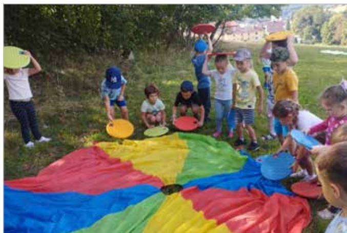
Děti tráví čas i mimo prostory mateřské školy, například v okolí Vodárny