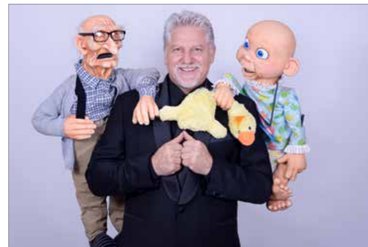
Břichomluvec Zdeněk Polach se svým pořadem zavítá v listopadu do Kašperských Hor.