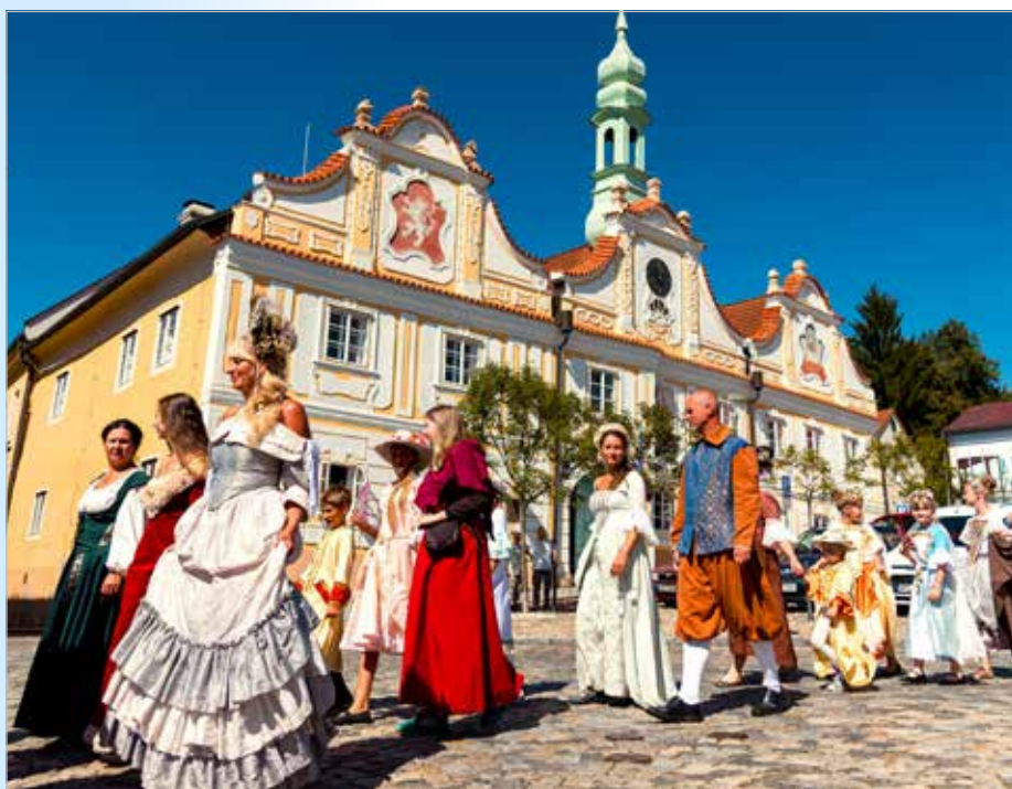
Barokní Šumavské Kašperské Hory

Záříjové městské slavnosti ovládlo slunce a veselí