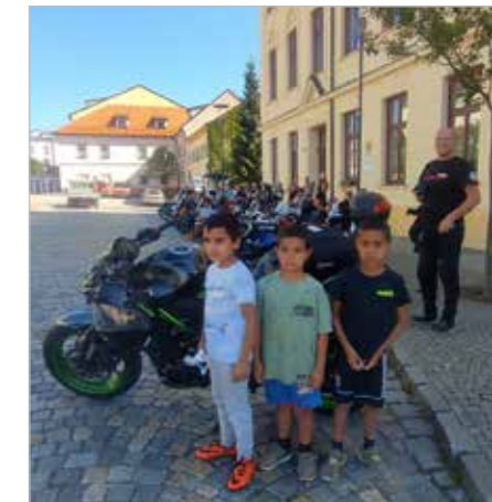
Návštěva motorkářů v dětském domově