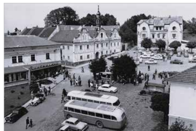
Západní část náměstí v Kašperských Horách s hotelem Bílá Růže na snímku z poloviny 60. let 20. století