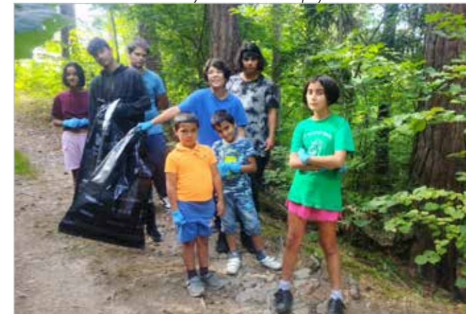
Děti z DD se snaží upevnit vztah k třídění odpadu při akci Vyčisti les ▲▼