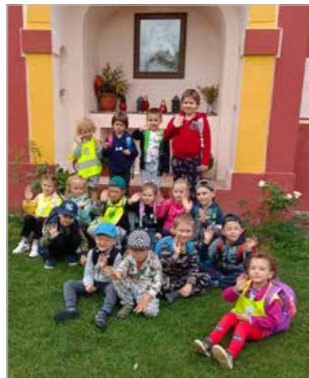
Děti na výletě u strašinského kostela