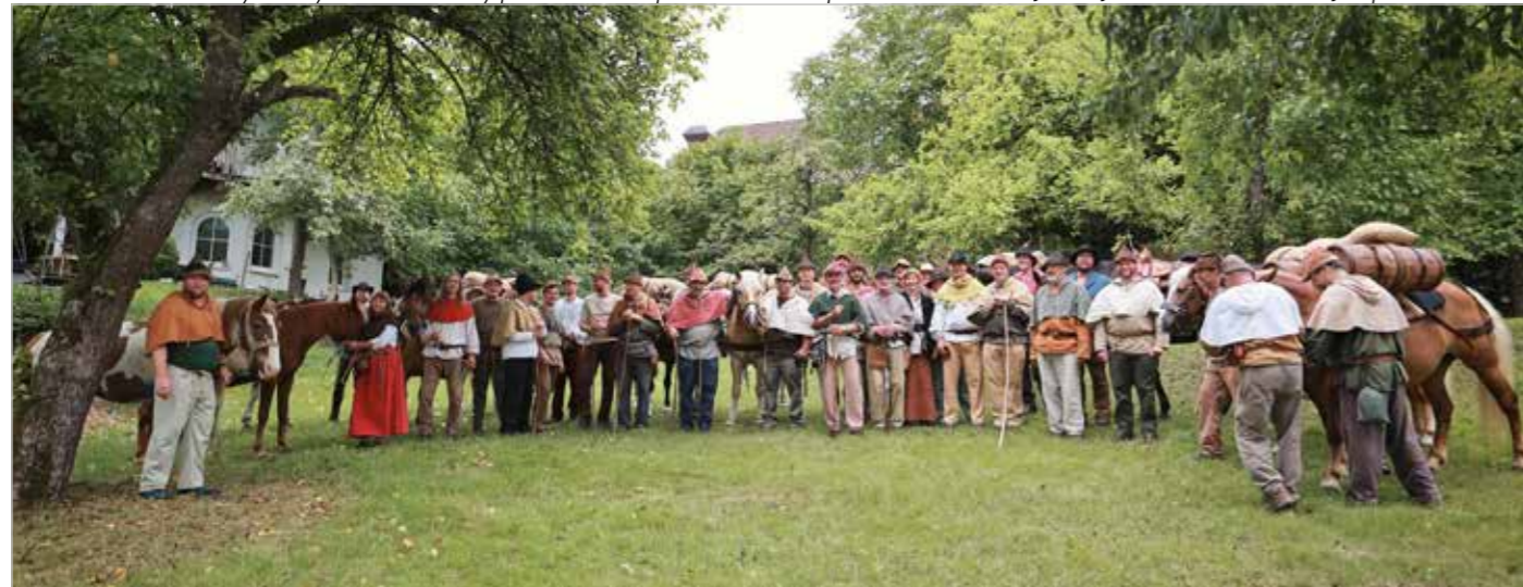
Účastníci soumarského pochodu pohromadě