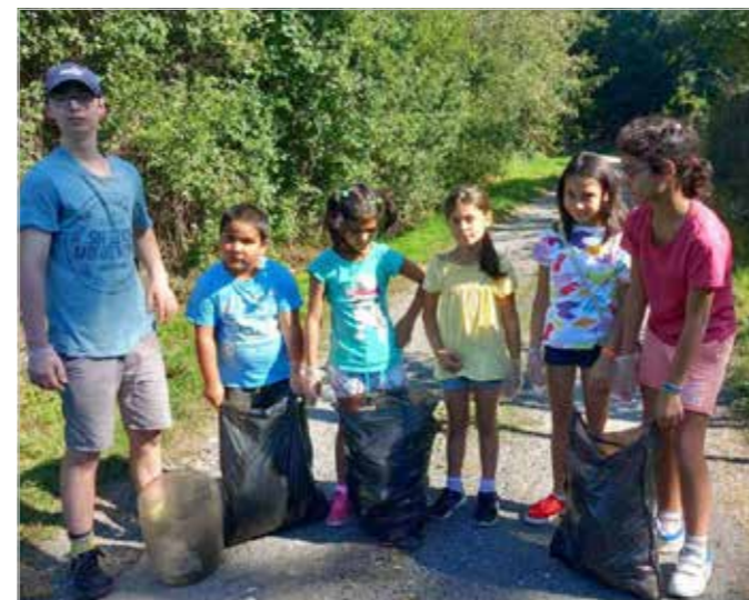
Děti úspěšně posbíraly několik pytlů odpadu, který následně vytrídily