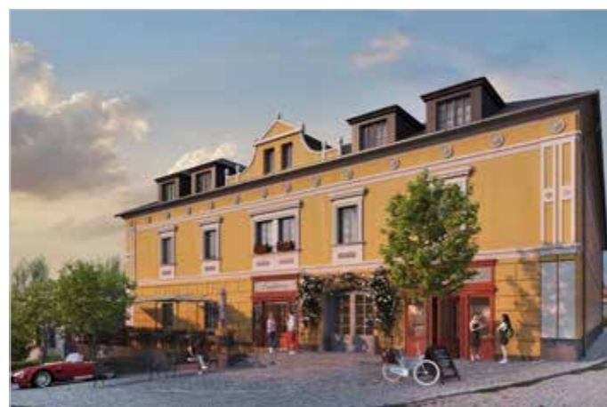
Nová Bílá Růže - projektová pohledová studie průčelí po zrekonstruování budovy