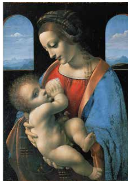
Madona Litta, připisováno Leonardu da Vinci, Ermitáž Sankt Peterburk

snazilo připomenout, že Ježíš přišel na svět nejen jako Bůh ale i člověk, jako ten, který v plnosti se vším všudy (slovy starobylé české koledy řečeno) „člověčenství naše, ráčil vzít na se!“ - K nejnámějším a nejvíce obdivovaným znázorněním kojící Panny Marie ve světovém umění patří obraz „MADONA LITTA“ ve sbírkách slavné Ermitáže v Sankt