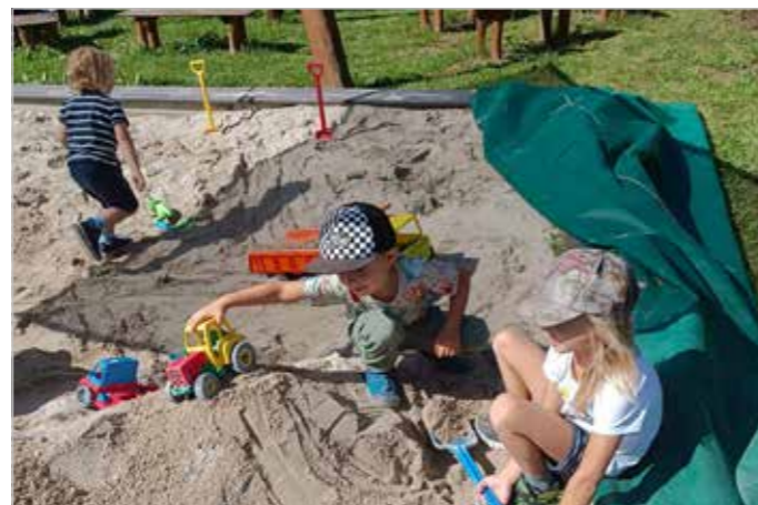
Díky krásnému počasí jsou děti často na školkové zahradě