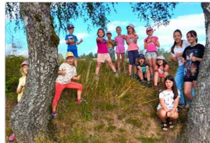
Příměstský tábor - léto 2023