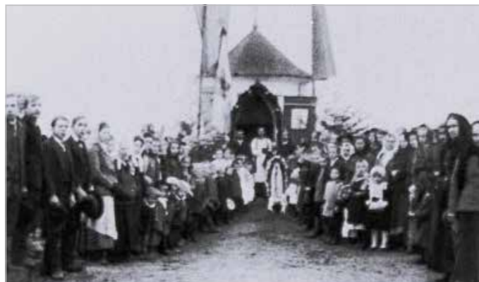
Otevření kaple v listopadu 1917

Vzali jsme se v roce 1964 a pracovali spolu ve velkém dřevozpracujícím podniku v německém Neumarktu. V roce 1987 manžel z firmy odešel a začali jsme sami podnikat. Můj manžel měl obchodní kontakty v České republice a rychle jsme byli úspěšní. Jednou, když jsme byli společně v České republice, jsme také navštívili mou rodnou vesnici Červenou (Rothsaißen). Bylo to ještě před rokem 1989. Většina zdejších domů byla zchátralá a i kaple byla zdevastovaná. Tak to nemohlo zůstat, a proto jsme se rozhodli kapli nechat opravit. V té době to nebylo tak jednoduché, ale můj manžel získal kontakty na místní řemeslníky, kteří se