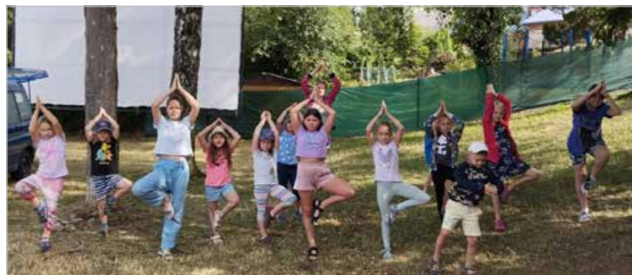
Účastníci příměstského tábora v Kašperských Horách

Snahou a hlavním cílem byla pomoc dětem více se poznat a začlenit do kolektivu. V Kašperských Horách se uskutečnily tři turnusy, každý v trvání jednoho pracovního týdne. Kapacita těchto táborů byla 24 dětí na jeden týden, tj. 12 dětí z Ukrajiny a 12 dětí navštěvujících místní základní školu. Obsazenost táborů byla ve všech třech týdnech více než 90%. Tá-