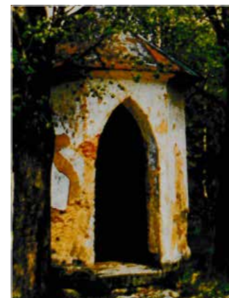
Kaple v roce 1991 před restaurováním a v roce 1992 po rekonstrukci

Waltraud Fuchs (překlad dopisu zajistil Spolek osadníků Červené na Šumavě)