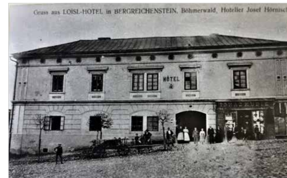
Hotel Bílá Růže na pohlednici z doby kolem 1910