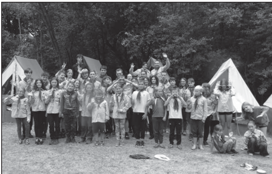
A tohle je celý tábor Onšovice 2023