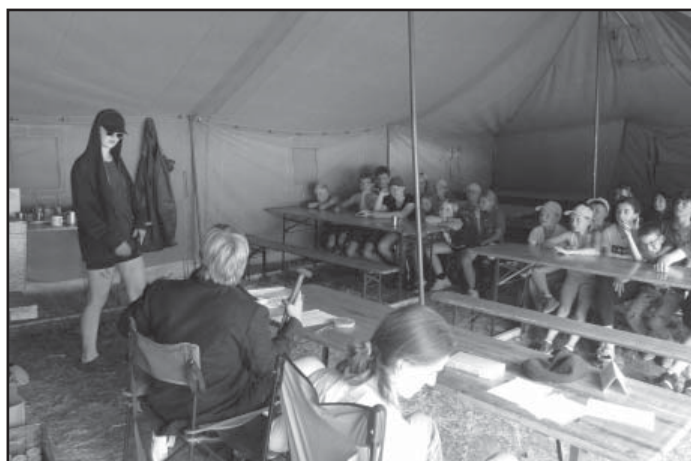
Soudní proces s gamblérem z casina