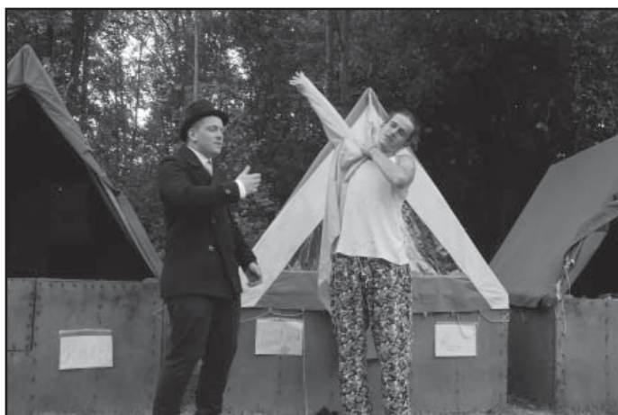
Sherlocku, vstávej, už jsou tady!