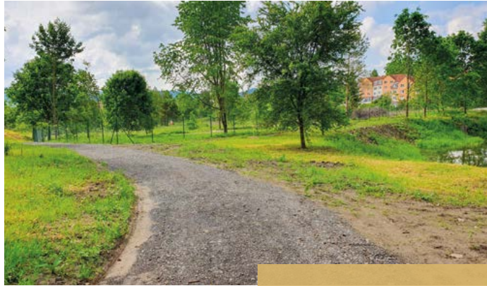
ně pěším. Nyní se naskytla první příležitost, jak bezpečně nabídnout chodcům či cyklistům pohyb bez toho, aby se každou vteřinou museli uhybat rychle jedoucím autům,“ říká místostarosta Zbyněk Toman. Kovový plot podél silni-

V rámci aktuálně prováděných prací na sanaci areálu bývalých kasáren ve Vyšném se vybudovala trasa pro pěší, která propojuje část od vlakového nádraží k Vyšnému. „Komunikace vedoucí kolem kovového plotu areálu není pro chodce příliš bezpečná a bohužel nebyl prostor pro rozšíření silnice o chodník, který by sloužil výhrad-