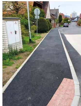
Nový chodník a osvětlení v ulici Za Plevnem

V letošním roce jsme již realizovali opravu chodníku v ulici Za Plevnem, opravy chodníků a kontejnerových stání v ulici Polská či lokální opravy komunikací v ceně téměř jednoho milionu korun. V dalších měsících proběhnou větší kompletní opravy chodníků na sídlišti Plešivec 351–358, po kterých obyvatelé dlouhou dobu volají,