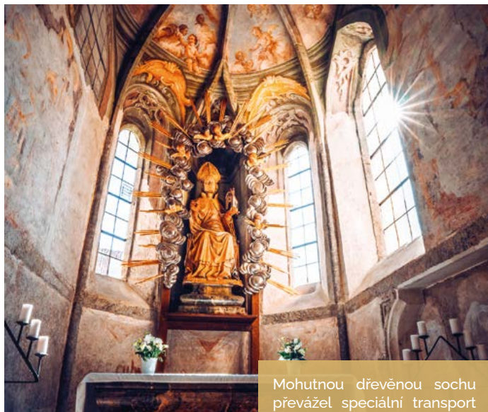
Kaple sv. Wolfganga

Největší novinkou expozice Klášterního musea je návrat tří pozdně gotických soch, které