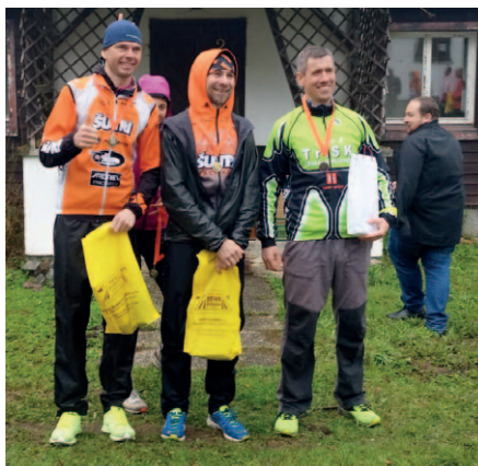
První tři muži prachatického triatlonu.