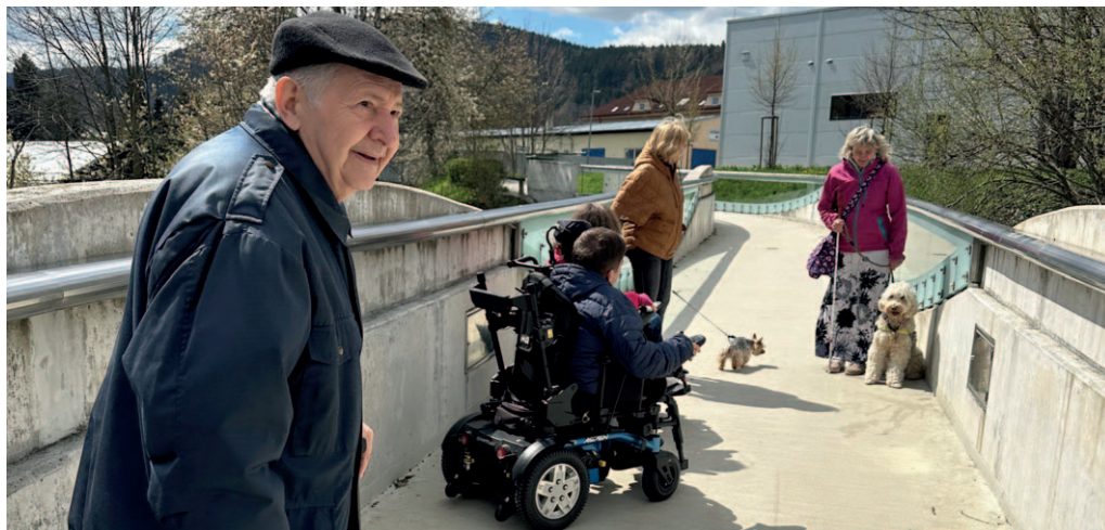
Momentka z natáčení videospotu, který představil Prachatice účastníkům slavnostního udílení Cen Mosty.