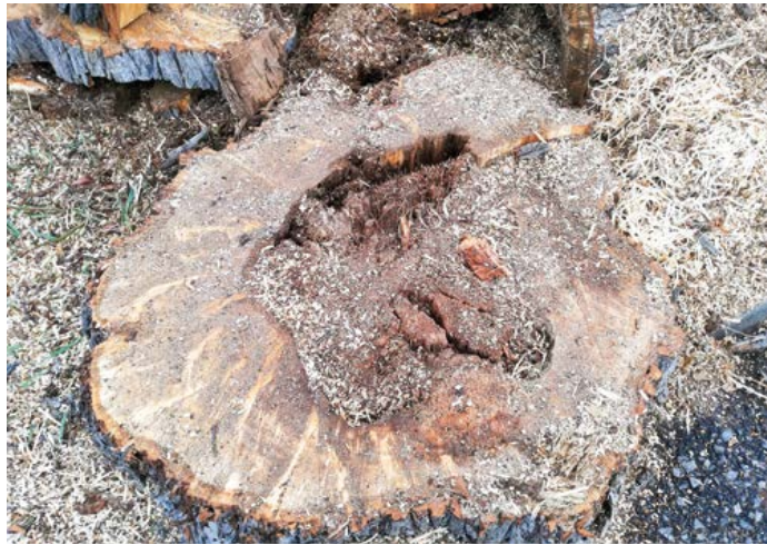
Lípa byla uvnitř zcela shnilá a tím i nebezpečná, hrozil její pád.

Lípa (při výjezdu směrem k Budějovické ul.) byla v minulosti opakovaně odborně ošetřovaná. Koruna, kterou tvořily tři mohutné kmene, byla redukována a nainstalovala se zde bezpečnostní vazba. Dle odborného posudku arboristy došlo u paty kmene napadení dřevokaznou houbou. Druhem, který proniká do struktury dřeva, které poškozují a výsledkem bývá statické selhání takto poškozeného stromu, tzn. dojde ke zlomu v místě poškození a následný pád stromu. Vzhledem k tomuto zjištění a s ohledem na zajištění bezpečnosti nebylo možné jiné řešení než lípu odstranit. Při kácení se stav potvrdil, na bázi byla rozsáhlá dutina s pokročilou hnilobou, která je patrná i na pařežu.