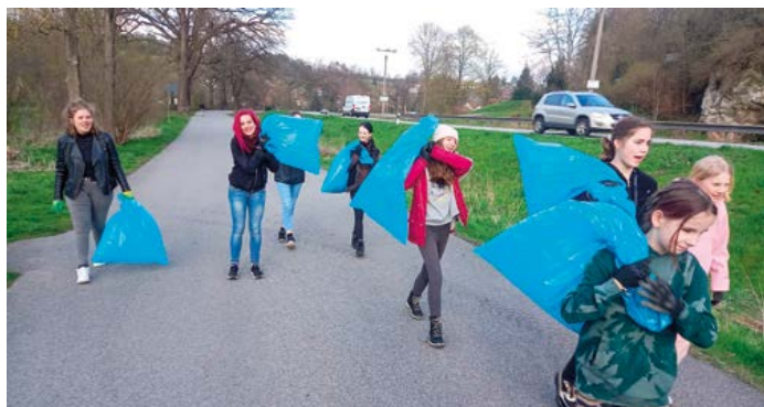
S úklidem pomohlo i hodně dětí.

Není možné jmenovat jednotlivce, ale osvědčené skupiny dobrovolníků si dovoluji zmínit – Základní škola v Kaplické ulici, místní skautský oddíl URSI-