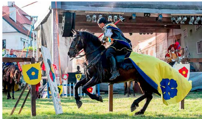
Loňský rytířský turnaj v Pivovarské zahradě.

Hlavní prvky programu, jako jsou průvod, ohňostroj a další pravidelný program například na náměstí Svornosti, budou zachovány, ale omezí se do dvou dnů – na pátek 16. a na sobotu 17. června. Uvědomujeme si