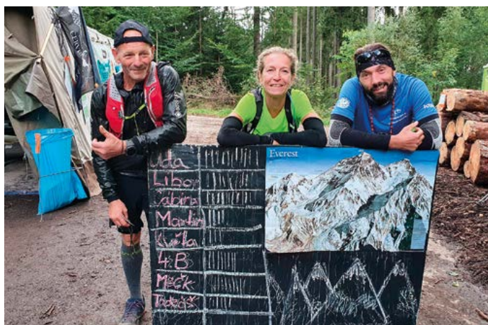
Překonejte sami sebe a podejte pomocnou ruku potřebným.

je nastoupání 8027 výškových metrů, tedy výstup na nejnižší „osmitisícovku“ Šiša Pangmu, a to ze startu u Červeného Dvora přes Kleť na parkoviště v Krásetíně. K nastoupání výškových metrů je potřeba zdolat tuto 6 km dlouhou trasu 20x (desetkrát tam a zpátky). Čas bude od soboty 22. dubna 6 hodin do neděle 23. dubna 18 hodin. Zdolání celé trasy však není podmínkou. Kdo nebude chtít absolvovat těchto 120 km, může si zkusit na této trase „menší kopce“, na které si troufá – a to sám, s rodinou, partou kamarádů, jakkoliv. Skupina