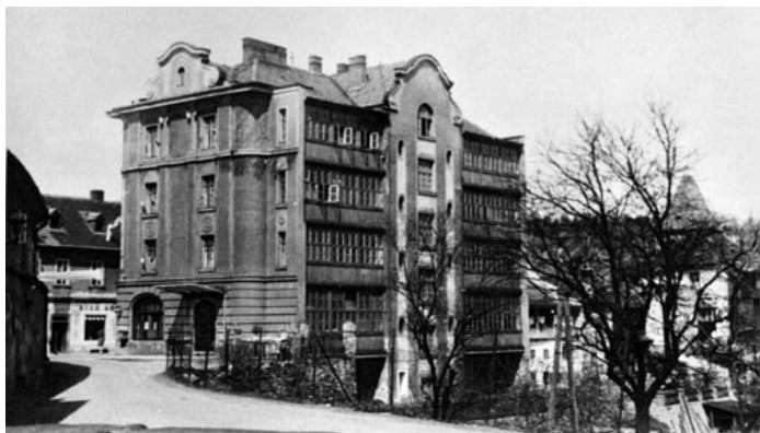
Latrán čp. 193, činžovní a obchodní dům rodiny Schinko. Foto: Josef Seidel, po roce 1913