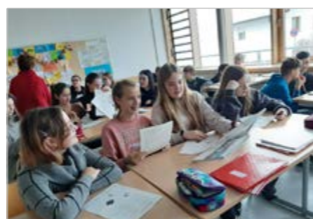
Žáci z Kašperských Hor a Grafenau spolu při výuce

nezmínit i kantýnu, kde si studenti mohou kupovat svačiny. Nejvíce zábavná byla asi jazyková animace, kde jsme učili Němce češtinu a my jsme se učili německy. Poté, co skončila animace, jsme se vydali na náměstí, kde se konaly vánoční trhy. Nejvíce jsem si vychutnala čokoládové tyčky a belgickou horčkovou čokoládu ve zdejší cukrárně. Poté nás vyzvedl autobus a jeli jsme domů.