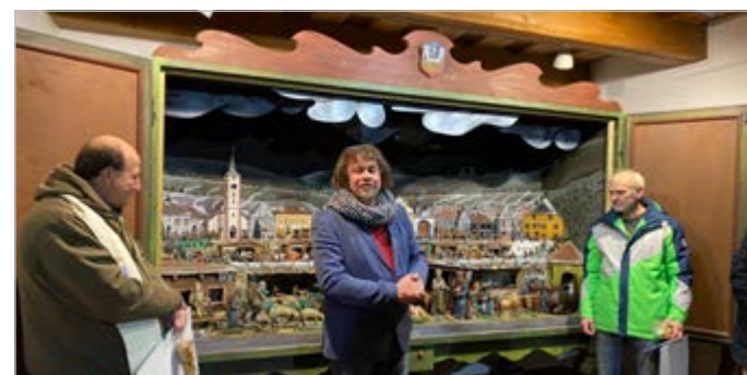
Znovuotevření kašperskohorského skříňového betlému na radnici