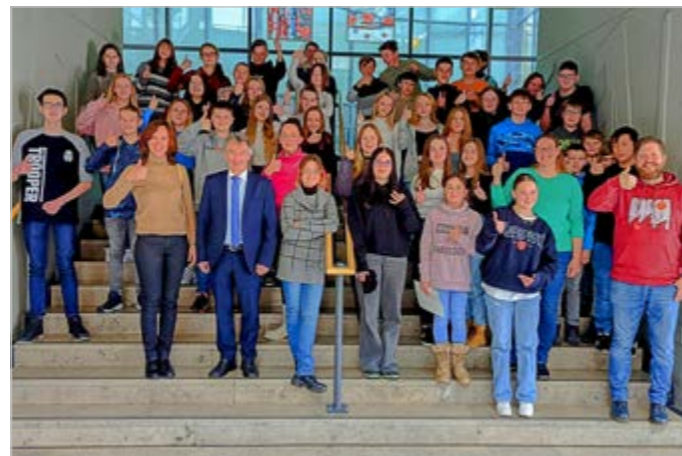
▲ ▼ Žáci 7. a 8. třídy ZŠ Vyrazili do partnerského města Grafenau, společně se učili si porozumět. Články studentů na straně 8.