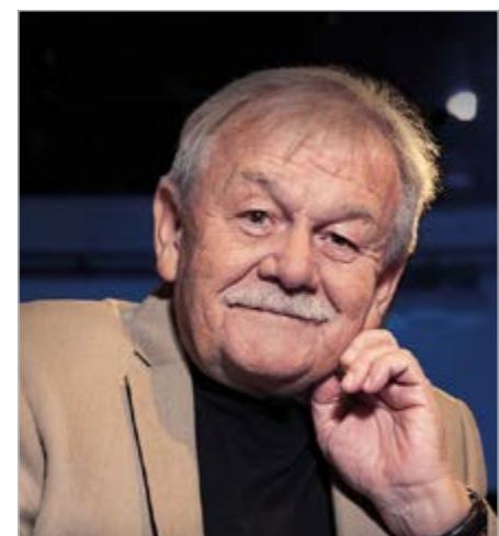
Moderátor a bavič Karel Šíp, zdroj: foto Raub