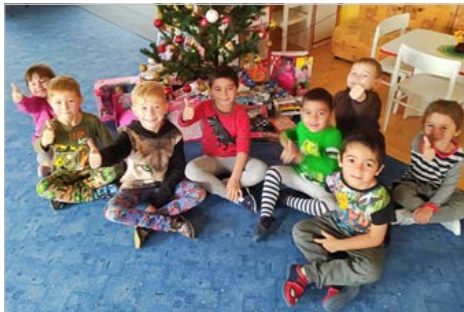
▲ ▼ Z MŠ - rozbalování dárečků ve třídě Sluníček a Broučků