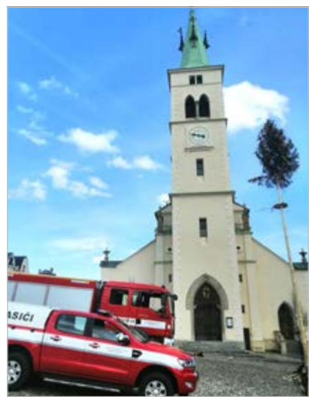
Oslavy 1. máje 2022 na kašperskohorském náměstí

První akcí, kterou jsme pro občany města uspořádali, bylo tradiční pálení čarodějnic a oslavy 1. máje. Jsme moc rádi, že tato akce mohla ve spolupráci s městem Kašperské Hory a MĚKIS proběhnout na našem náměstí a věříme, že letošní bude alespoň taková jako loni. Dále se náš sbor zúčastnil