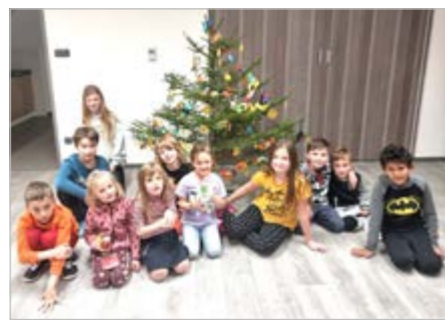
Mladí hasiči se pravidelně scházejí od října 2022

okreskové soutěže v požárním útoku konané na fotbalovém hřišti. Těší nás, že i tato akce přivítala mnohé občany našeho města, kteří našemu družstvu přišli fandit. Někteří členové našeho sboru během prázdnin připravili vzdělávací odpoledne pro děti z příměstského tábora, kdy je hrou učili o bezpečnosti, základech první pomoci, ukázali jim hasičskou techniku a mnohé další. Poslední akcí, kterou sbor uspořádal pro širokou veřejnost, byly předvánoční vepřové hody a den otevřených dveří. Návštěvníci se tak mohli podívat na nové prostory hasičské zbrojnice. I členové sboru se přidali ke zvelebení zbrojnice, a proto máme nyní krásné zázemí nejen pro SDH, ale především pro zásahovou jednotku složenou z členů SDH a také pro naše nejmladší. Od října 2022 máme 18 nových mladých hasičů, pravidelně se scházíme a učíme je vše, co by měl správný hasič znát.