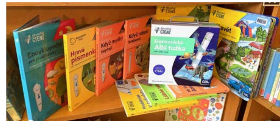
Ukázka z nabídky knih z kouzelného čtení v Městské knihovně v Kašperských Horách