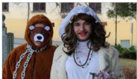
Masopustní masky v Kašperských Horách