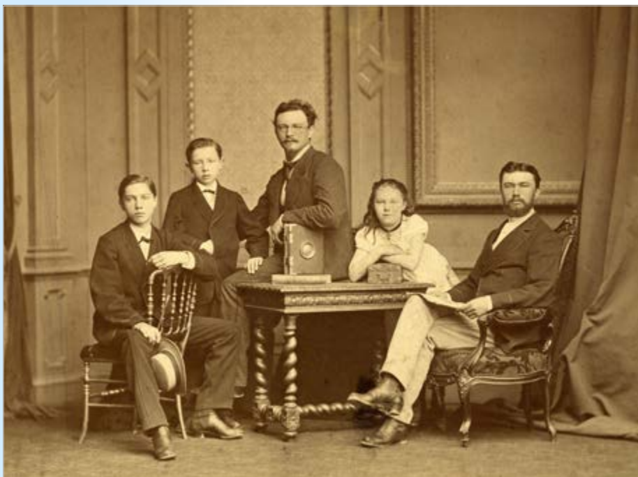
Karel Klostermann se svými sourozenci, ateliérové foto ve Vídni z roku 1873

Kašperky žijou! vzpomene na šumavského spisovatele