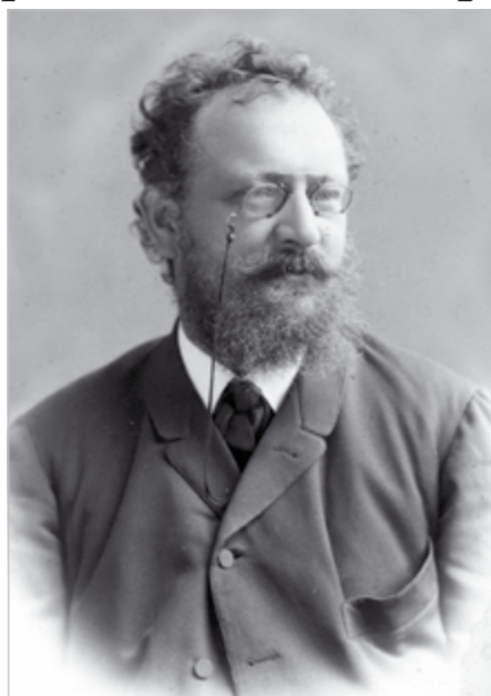
Karel Klostermann v roce 1882

Na tyto své pobyty na „Klapperlu“ vzpomíná ve sbírce drobných próz „Prázdniny na Šumavě“. Do Kašperských Hor umístil Klostermann děj řady svých románů a povídek. Není divu, vždyť Kašperské Hory byly tehdy přirozeným městským centrem celé střední Šumavy. V souvislosti s Kašperskými Horami si připomeňme slavný román V ráji šumavském, prózy Hostinný dům, Pozdní láska, Odysea soudního sluhy, Pan profesor... Lze tvrdit, že Kašperské Hory jsou Klostermannovým městem. Karel Klostermann tu má svůj pomníček, místní kino tu nese spisovatelovo jméno, je tu Klostermannova ulice. Pamětní deska na domě čp. 12-13 ve Vimperské ulici připomíná místo, kde Klostermann s rodiči a sourozenci bydlíval v 60. letech 19. století. V místním Muzeu Šumavy se uchovává část spisovatelovy pozůstalosti, rukopisy, podobizny, fotografie, nábytek, osobní předměty... Klostermannovy návštěvy Kašperských Hor byly poměrně časté. Téměř ustaly po roce 1908, kdy ho zklamal