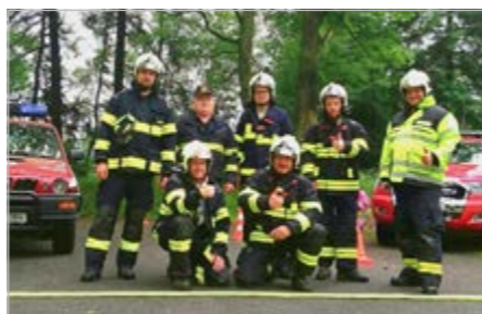
Členové místního Sboru dobrovolných hasičů

Jednotka SDH Kašperské Hory měla v loňském roce 69 zásahů.: