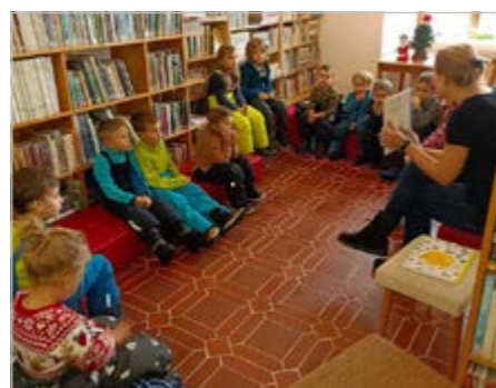
Návštěva dětí z třídy Včelek v knihovně

Společné porozumnění žáků na téma Vánoce