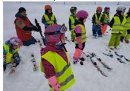
Lyžařský kurz pro děti z mateřské školky