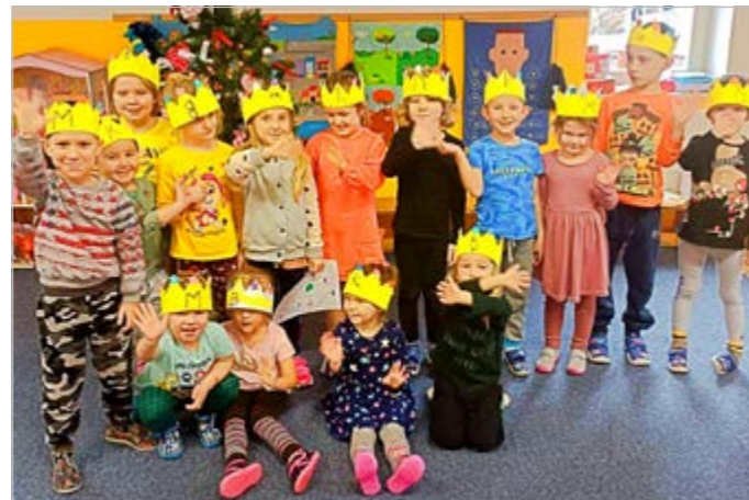
▲ Z MŠ - Tři králové ve třídě Včelek. Článek k akcím naleznete na straně 8.