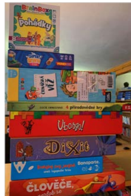
Stolní hry, které si v knihovně můžete zapůjčit

V nabídce jsou velmi oblíbené hry jako desková prostorová hra Ubongo – honba za diamanty, nebo karetní obrázková hra Dixit. Pro trénování paměti u dětí je tu Brainbox – pohádky, desetiminutová hra na procvičování paměti a vědomostí. Mají vaše děti trochu problémy s výslovností? Spojte příjemné s užitečným a zvolte hru Rozhybej svůj jazýček aneb logopedie hrou. Pro milovníky kostiček je tu Čtenářská věž – prověřte svoji zručnost a koncentraci při stavbě věže z dřevěných kamenů, pro nebojácne přidáme ještě znalost literatury klasických děl a autorů dětských knih. Nejsi jen tak ledajaké dítě. Máš super schopnosti a tví rodiče jsou tajní agenti, vydej se s dětskou únikovou hrou Super špunti do akce! Pro starší je tu úniková hra v knižním podání Hádanky a hlavolamy Sherlocka Holmese. Zábavnou hrou, kterou lze docílit i poznávání přírody nabízí 4 přírodovědné hry s velkým leporelem herních plánů, nebojte se zapojit děti už od 4 let. V naší nabídce nechybí ani tradiční Člověče, nezlob se! a Activity. V podobném duchu je i poslední hra Loupežníci, třešte se!