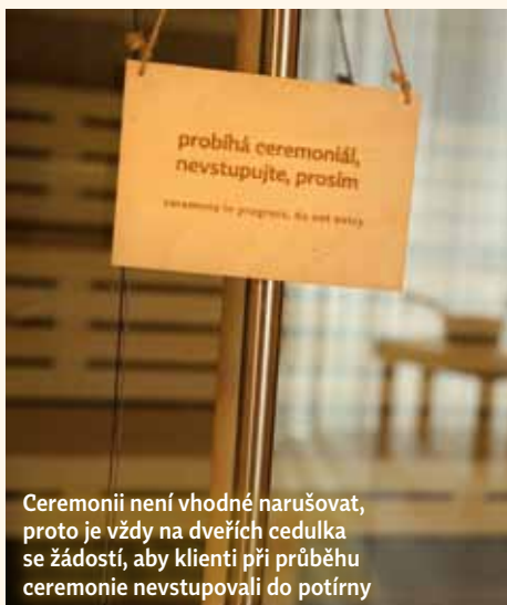
Ceremonii není vhodné narušovat, proto je vždy na dveřích cedulka se žádostí, aby klienti při průběhu ceremonie nevstupovali do potírny

Ceremonie v saunovém světě lázeňského domu Aurora si za krátkou dobu své existence již dokázaly získat své věrné příznivce. Jsou tací, kteří do sauny chodí tak, aby stihli dokonce dvě ceremonie s tím, že si potřebný čas navíc doplátí. Jak jste na tom vy? Kdy si přijdete užít ceremonii do Třeboňského saunového světa? <