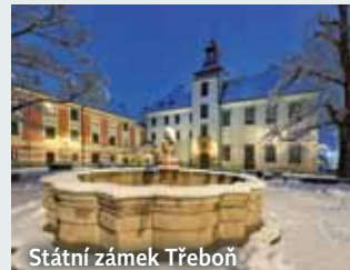
Státní zámek Třeboň