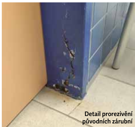
Detail prorezivění původních zárubní

K oncem loňského roku bylo v úseku vodoléčby lázeňského domu Aurora vyměněno 54 dveřních výplní včetně zárubní. S ohledem na charakter provozu, tj. poskytování vodoléčebných procedur, je v těchto prostorech zvýšená vlhkost, proto dřevěné dveře trpěly a zárubně, zejména v místech, kde se stýkaly s podlahou, byly napadeny rzi. Nyní byly dřevěné jednokřídlé dveře vyměněny za skleněné, ocelové zárubně byly nahrazeny novými nerezovými. <