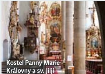
Kostel Panny Marie Královny a sv. Jiljí