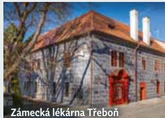
Zámecká lékárna Třeboň