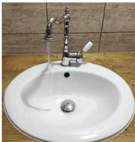
Cenu vody zvyšují mimořádná opatření SFŽP

Cena vodného pro letošní rok je nadále ovlivněna a definována na základě mimořádného opatření SFŽP ČR pro vodohospodářské projekty OPŽP. V souvislosti s energetickou krizí uplatňuje Státní fond životního prostředí inflační index spotřebitelských cen ve výši 3,8 %.