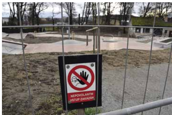
Info tabule umístěná v areálu skateparku