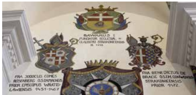
Heraldické výjevy na severní zdi chóru kostela

Výběrově zde můžeme upozornit kupříkladu na následující erby a jejich historicky významné majitele: Bavor I. ze Strakonice (nahore) – dobrodinec a zakladatel strakonické komendy johanitů (1243), který se dle legendy zúčastnil křížové výpravy, kde se s řádem johanitů setkal, a proto rytíře na svůj