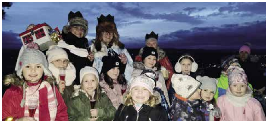
Tradiční pochod si užili jak malí, tak velcí