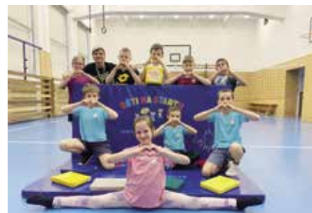
Ve škole vzniklo sportovní středisko Děti na startu

V naší škole se ještě před začátkem školního roku 2021/2022 rozhodlo o možnosti zapojení našich, zejména „prvostupňových“ žáků, do projektu „Děti na startu“, jímž je primárně určen. Garantem celorepublikového projektu je Český svaz aerobiku a fitness FISAF.cz, který umožňuje všem dětem od 4 do 10 let po celé České republice už několik let cvičit s radostí a bez stresu z výkonů. Děti tak mají příležitost rozvíjet svou základní pohybovou motoriku, koordinaci, obratnost, rychlost a sílu a získat základ pro další pohybovou a sportovní činnost i celoživotní pozitivní vztah k pohybu, sportu a aktivnímu trávení volného času. Zrod střediska „Děti na startu“ v naší škole a zajištění odborného proškolení trenérů i instruktorů bylo tedy prvořadým úkolem, jenž byl splněn prostřednictvím Sportklubu Kladno, z. s., a díky dobré spolupráci vedení naší školy.