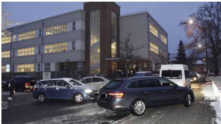
Ranní shon před základní školou