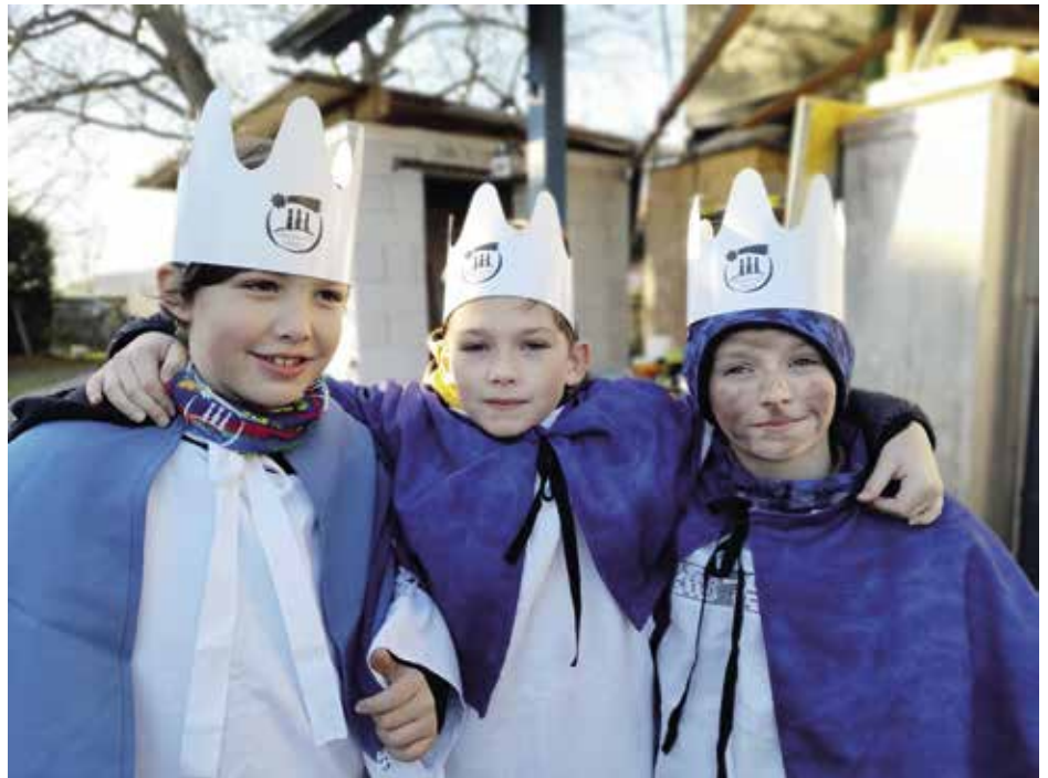
Tři králové v Domanicích

Poděkování si zaslouží i malí koledníci. Letos, pravda, je nesušovaly kruté a třeskuté mrazy jako v předešlých letech, kdy do našich domovů a kanceláří nakukovali