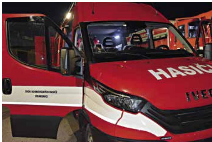
Nové auto hasiči převzali na pivovarském dvoře

Vozidlo bylo pořízeno za 2 661 000 Kč. K nákupu byly čerpány dotace od GŘ HZS ČR 450 000 Kč a Jihočeského kraje 300 000 Kč. Zbývající částku, necelé