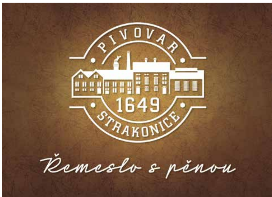
Změnu názvu doplňuje nové logo

Naše společnost neustále investuje do kvality svých piv, jen tak lze obstát v konkurenčním prostředí. V listopadu