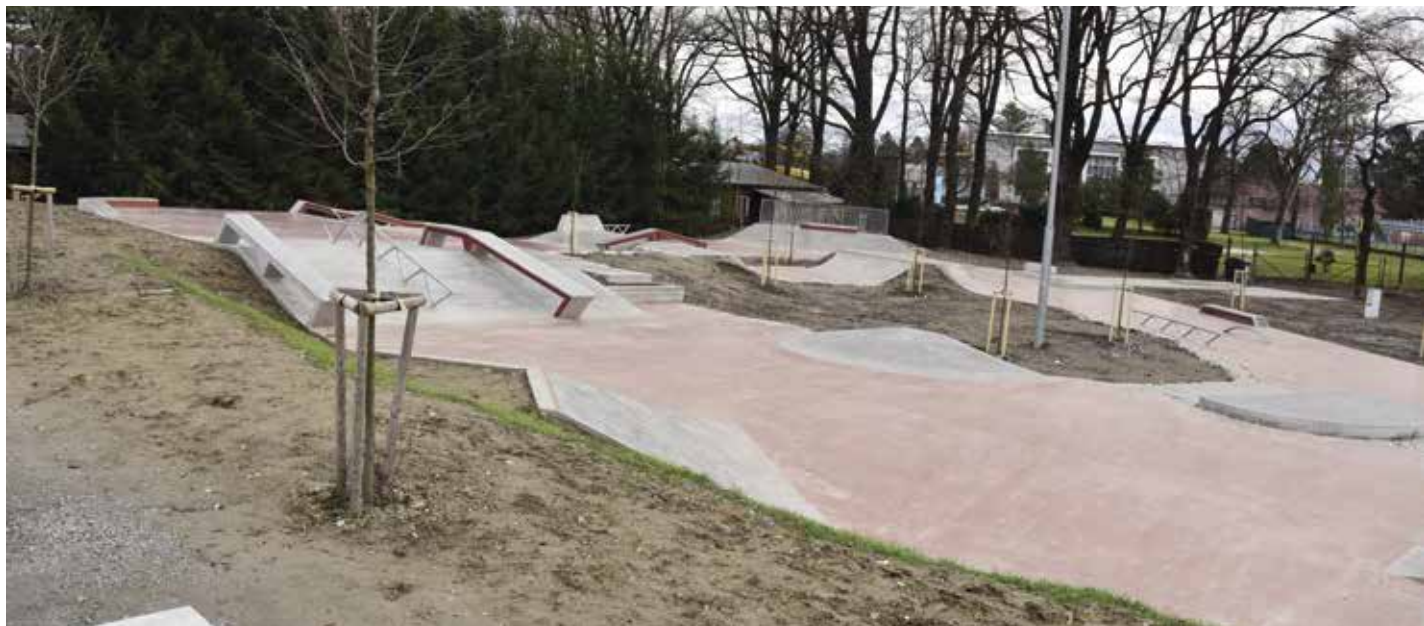
Pohled na skatepark

Kolaudační řízení završilo výstavbu nového areálu skateparku Na Křemelce. Slavnostní otevření s exhibicí jezdců ale novou stavbu teprve čeká. Jakmile klimatické podmínky dovolí, s otevřením se nebude otálet.