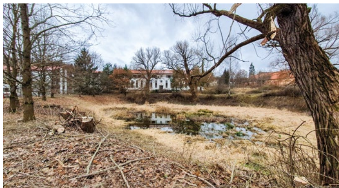
Území prochází rozsáhlou revitalizací. Vznikne tu nový park.

Ve východní části bývalých kasáren ve Vyšném se nyní soustřeďují hlavní práce na úpravě území, kde podle plánu na výstavbu nové čtvrti bude zelený pás parku. Odborná firma tu dle arboristického posudku kácí