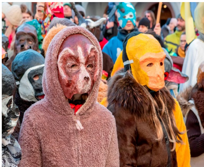
Každý rok si děti ze ZUŠky připravují masky do průvodu.