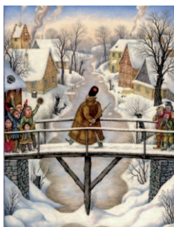
Zimní pohádka Jindry Čapka