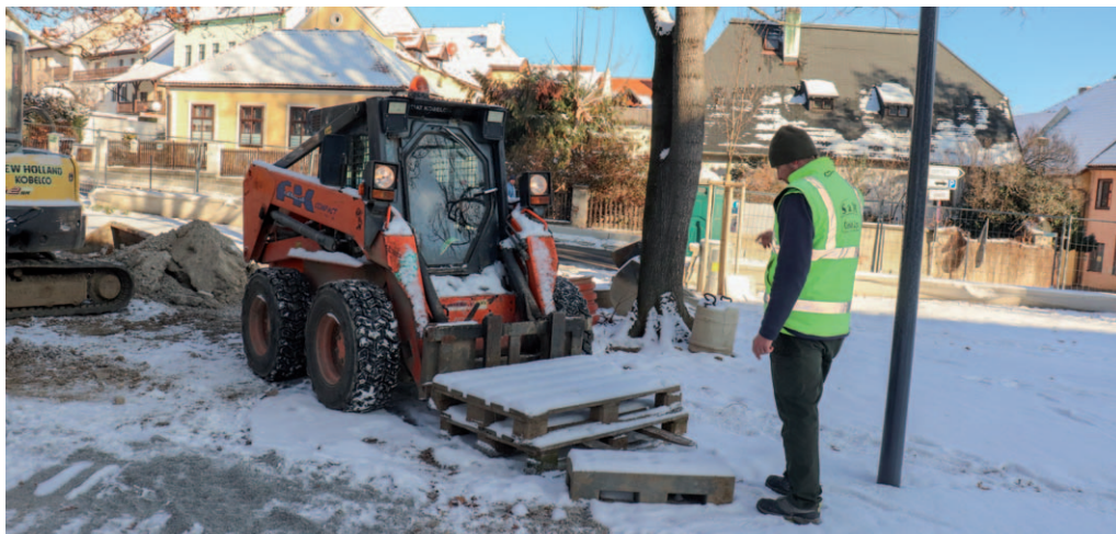
Práce ve Štěpánčině parku pro rok 2022 skončily. Zhotovitel dokončí revitalizaci v roce následujícím.