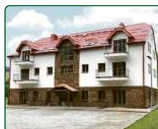
eFi ApartHotel, Horní Lipová, Lipová lázně