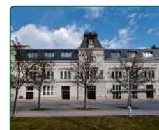
eFi SPA Hotel, Brno, Nám. 28. října