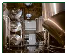
eFi Pivovar, Brno