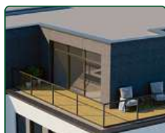
eFi Obchodní Galerie, byty a kanceláře, Jihlava - nástavba