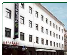
eFi Palace Hotel, Brno, dokončené 2 etapy