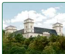
Zámek Račice, Račice-Pístovice - hl. budova