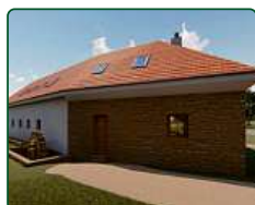
eFi Mlýn, eFi Motorest a rybníky - Hodonín u Kunštátu