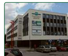
eFi Obchodní Galerie, byty a kanceláře - Jihlava