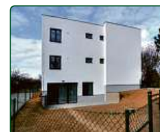
Rezidence Bílovice, Bílovice nad Svitavou

Již 22 let investujete s e-Finance, a.s.