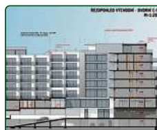
eFi Palace Hotel, Brno, 3. etapa, přístavba