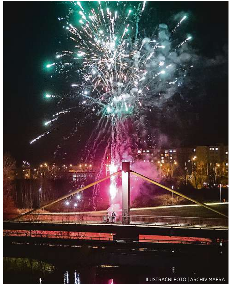
ILUSTRÁČNÍ FOTO