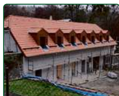
Zámek Račice, Račice-Pístovice - podzámčí