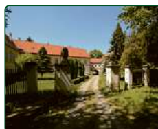
Zámek Račice, Račice-Pístovice - předzámčí