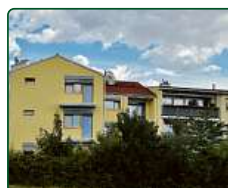
Bytový dům, Brno, ul. Holzova