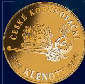
společná zadní strana