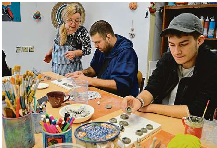
Pracovní činnosti v dílně u svatého Františka v Bechyni vždy vybírají společně s klienty a s ohledem na jejich schopnosti, ambice, přání i omezení.

Osoby s postižením od 16 let až do důchodového věku mohou přijít každý všední den. „Víme, že lidí, kteří se chtějí začlenit, je na Bechyňsku dost. Dveře máme pro všechny otevřené. Nabízíme