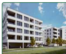
Bytové domy Břeclav, ul. Charvátská