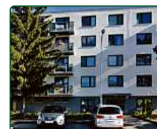
Rezidence Pěkná, Brno, nebytové prostory