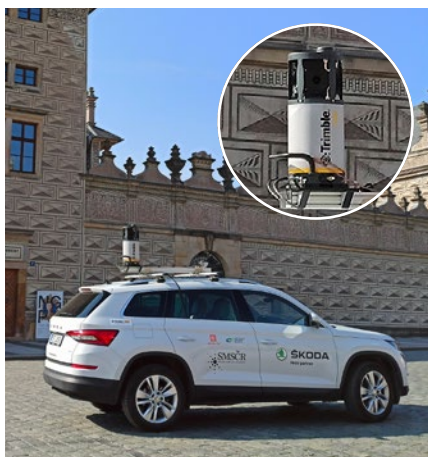
Mobilní mapovací systém TRIMBLE MX7

Cílem je, aby obce mohly jednoduše plnit své zákonné povinnosti. Musím ocenit, že si SMS ČR zvolilo renomované partnery svého projektu „DTMka jednoduše“, především společnost NESS Czech, která se podílí na DTM projektech velkých správců sítí i krajů a je zároveň řešitelem centrálního registračního nástroje DTM, tzv. IS DMVS. Znalost řešení centrálních nástrojů přináší pro SMS ČR a jeho členské obce výraznou výhodu. Dále jde o společnost Hexagon, která připravuje uživatelské rozhraní pro práci v mapě, a SMSdata, jež má za úkol v rámci Kompetenčního centra pomáhat do projektu zapojeným obcím s přípravou a následnou aktualizací jejich dat. Více se o projektu můžete dozvědět na webových stránkách „DTMka-jednoduše.cz“ nebo na seminářích, které pokračují i v letošním roce.