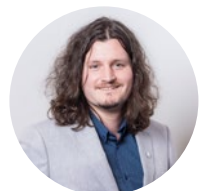
Zpracoval Dominik Hrubý legislativní analytik SMS ČR

ždý kalendářní den od prvního do čtrnáctého kalendářního dne dočasné pracovní neschopnosti odměna ve výši 60 % jedné třicetiny odměny (na což by bezprostředně patnáctý den navázal nárok na nemocenskou). Pokud se však funkce vzdal před vznikem pracovní neschopnosti, nárok na tuto odměnu by neměl.