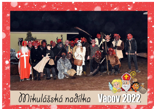
A zase za rok se do Vacova těší parta pekelníků

Tolik obávaný večer mají děti za sebou a teď už se mohou těšit na stromeček a dárky od Ježíška. Ale rodiče jim určitě občas připomenou, že čert nikdy nespí.