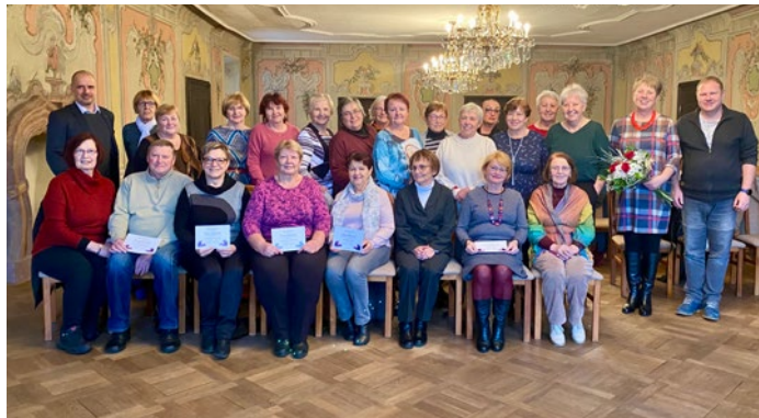
Absolventi mají další úspěšný rok vzdělávání za sebou.

Akademie 3. věku funguje již od roku 2009 a během let se její studenti mohli zúčastnit spousty přednášek se zajímavými hosty a navštívit plno pozoruhodných míst. Akademii 3. věku pořádá městská společnost Sociální služby SOVY ve spolupráci s městskou knihovnou.