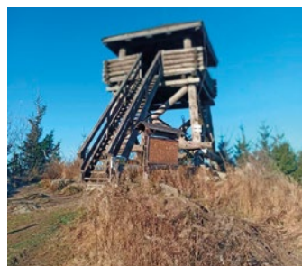
Rozhledna na Knížecím stolci

Do konce roku 2022 mohla veřejnost využívat turistické stezky ve zmíněném území pouze o víkendech nebo státních