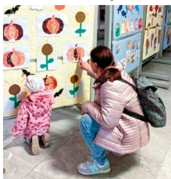
Činnost klubu pravidelně prezentují výstavy na úřadě.

nostem, doučováním, vzdělávacím aktivitám, pohybovým venkov- ním aktivitám a úklidovým ak- cím v okolí domu i v přírodě.