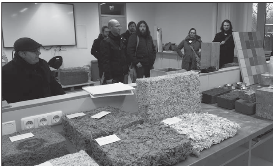
ArchaeoDílna s vybavenou laboratoří

Město Bärnau leží v těsné blízkosti státní hranice v bavorském vládním obvodu Horní Falc nedaleko západočeského města Tachov. Se svými zhruba 3400 obyvateli je nejmenší, ale zároveň nejstarší město této oblasti. Spolek Via Carolina–Goldene Strasse zde od roku 2010 vytváří historický park Bärnau-Tachov, největší středověký historický park v Německu, který návštěvníkům přibližuje život lidí v době raného a vrcholného středověku a je využíván mimo jiné jako výzkumné středisko pro experimentální archeologii. Najdeme zde raně středověkou slovanskou vesnici, hrádek typu motte z 11. století a osadu z období vrcholného středověku. Od roku 2017 se zde realizuje dlouhodobý projekt – formou experimentu se staví dvorec z doby Karla IV. Při stavbě se používají výhradně materiály dostupné v dané době, dobová technika a technologie,