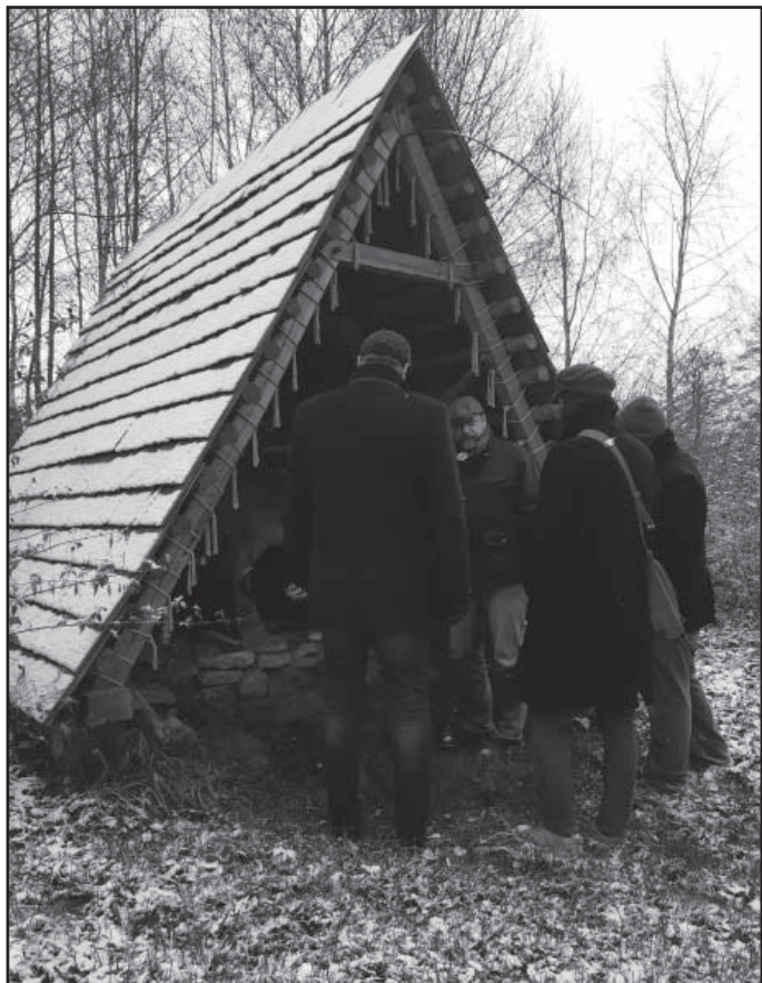
Richtfest (glajcha), vztyčení opentleného smrčku s následným rituálem