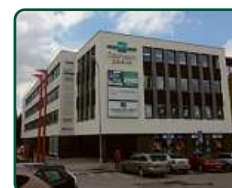
eFi Obchodní Galerie, byty a kanceláře - Jihlava