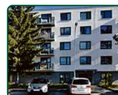
Rezidence Pěkná, Brno, nebytové prostory