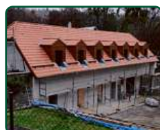
Zámek Račice, Račice-Pístovice - podzámčí