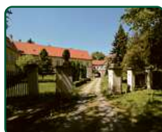
Zámek Račice, Račice-Pístovice - předzámčí