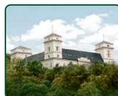
Zámek Račice, Račice-Pístovice - hl. budova