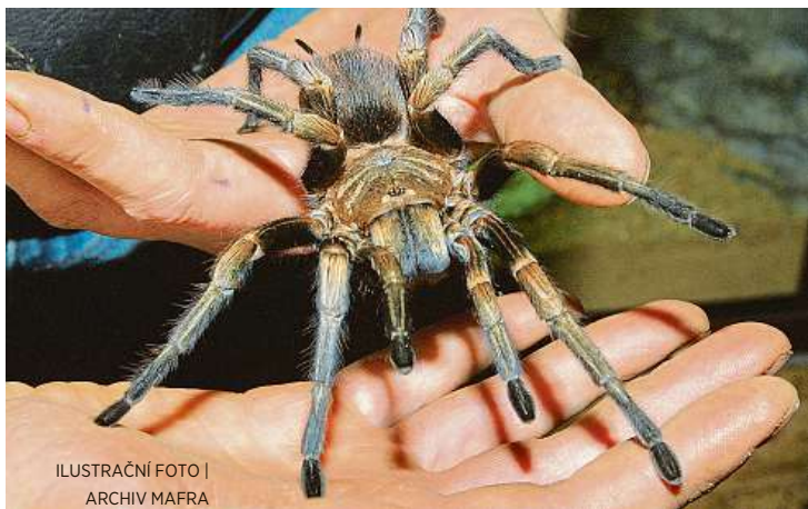
ILUSTRACI FOTU | ARCHIV MAFRA

Rád bych se podíval do Jižní Ameriky nebo do Kostariky, prošel se o pralese. Láká mě ta krajina, je to úplně něco jiného než naše lesy. Ale i Chorvatsko má něco do sebe.