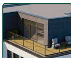
eFi Obchodní Galerie, byty a kanceláře, Jihlava - nástavba