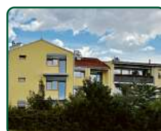
Bytový dům, Brno, ul. Holzova