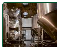
EFI Pivovar, Brno