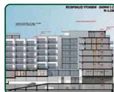
eFi Palace Hotel, Brno, 3. etapa, přístavba