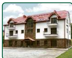
eFi ApartHotel, Horní Lipová, Lipová lázně