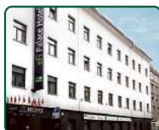
eFi Palace Hotel, Brno, dokončené 2 etapy