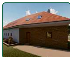
EFI Mlýn, EFI Motorest a rybníky - Hodonín u Kunštátu