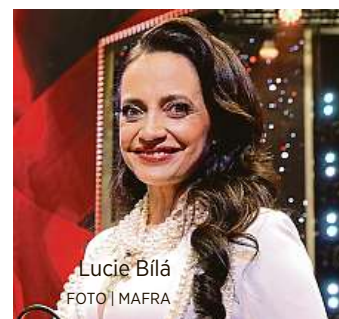
Lucie Bílá

Nových tváří se v rádiích objevilo pomálu, ale pokud chce starší posluchač slyšet něco mladšího, co poslouchají