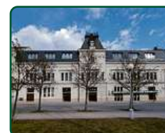
EFI SPA Hotel, Brno, Nám. 28. října