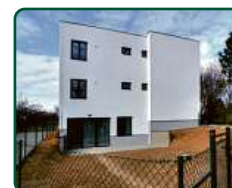
Rezidence Bílovice, Bílovice nad Svitavou

Již 21 let investujete s e-Finance, a.s.