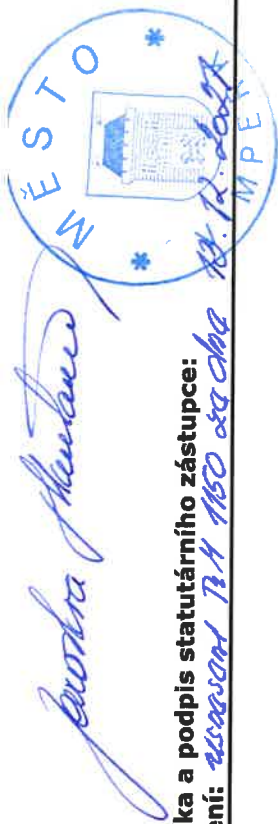
Tabulka plánu financování obnovy vodovodů a kanalizací : Razítko vlastníka a podpis statutárního zástupce: Č.j.: Datum schválení: usnesení BA 150 29.08.2024