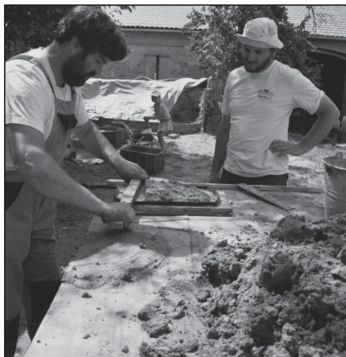
Restaurátoři při ručním formování střešní tašky (16. 6. 2021)