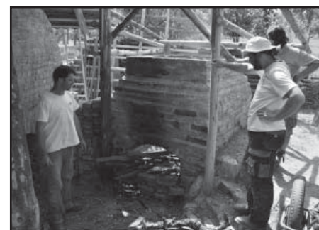
Výpal v pobočné peci (16. 6. 2021)