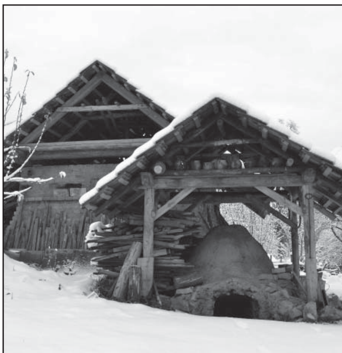
Malá pec na keramiku a velká cihlářská pec (7. 1. 2021)