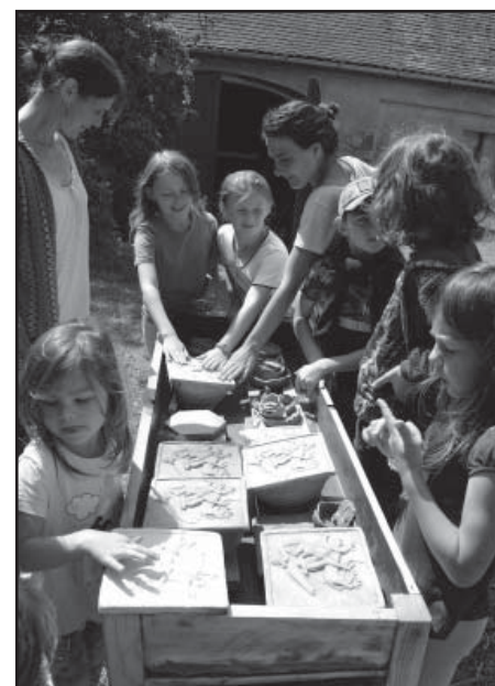
Prezentace vypálených kamenných kachlů pro ZŠ (27. 6. 2018)