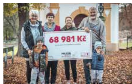
PROJEKT: Sousedská setkání ČÁSTKA: 68 981 Kč

Spolek Sunshine Cabaret, z.s. díky grantu naváže na své dosavadní aktivity a uspořádá několik různorodých akcí ve veřejném prostoru i opuštěných místech Strakoníc.