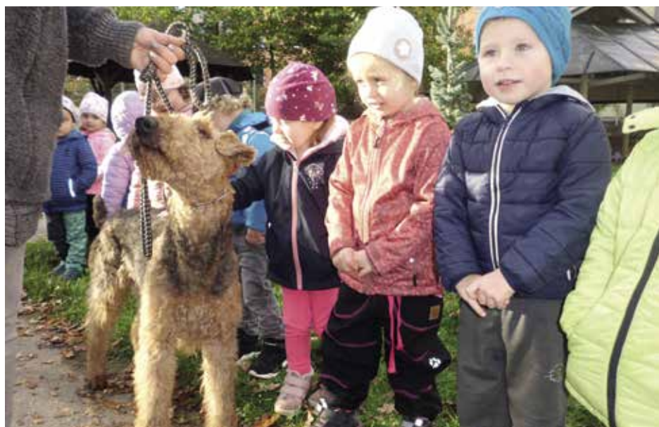
Děti se učily, jak se mají chovat ke čtyřnohým kamarádům