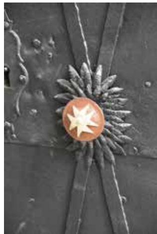
Znak maltézských rytířů prostupuje celým kostelem

zastávali již ve 12. století a na počátku 13. století důležité úřady (např. úřad královského číšníka, maršálka a komorníka olomouckého biskupa). Bavor I. s přídomkem ze Strakonice se objevuje poprvé jako svědek na listině vydané Václavem I. v roce 1235. Pohybuje se v blízkosti panovníka a zapojuje se do vyšší politiky. Za Přemysla Otakara II. zastával úřad zvíkovského kastelána a v roce 1254 byl jmenován nejvyšším komorníkem českého krále. Rodové znamení v podobě střely získal za účast v boji o Akkon v době křížové výpravy, kterou vedl rakouský vévoda Leopold VI. (1198–1230). Na počest návratu věnoval Bavor I. řádu sv. Jana Jeruzalémského, se kterým se ve Svaté zemi setkal, část svých statků ve Strakonících.