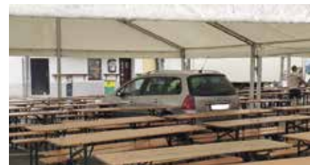
Kurióza z letošního MDF

ze Zvolenské ulice, že směrem k ZŠ Poděbradova jde nějaký chlap, svléká se a leze do aut. Za pár minut se usídlil v Jednotě v Erbenově ulici a tady se tedy vyznamenal. Vykřikoval, že je spoutaný, skákal na pokladní pás, kalhoty měl na půl žerdi a pořád něco mumlal. Strážníkům se ho podařilo vyvést před prodejnu, kde výtržníka převzala státní policie. Ukázalo se, že jde o již odsouzeného recidivistu. Pod vlivem drog skutečně byl. Navíc při své cestě, jak dodala policejní mluvčí, poškodil dvě zrcátka u aut.