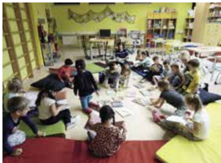
Čtení rozvíjí nejen paměť a představivost, ale také myšlení foto: archiv ZŠ

Jedním z pilířů vzdělávání je rozvíjení čtenářské gramotnosti. Čtenářem se dítě nerodí, čtenářem se stává čtením. Základní škola Povážská podporuje čtenářství nejen samostatnými akcemi a projekty přímo ve škole, ale i zapojením do celostátní kampaně obecně prospěšné společnosti Celé Česko čte dětem. Posláním této společnosti je prostřednictvím společného čtení budovat pevné vazby v rodině. Pravidelné předčítání dětem má obrovský význam pro rozvoj jejich emocionálního zdraví. Předčítání rozvíjí paměť a představivost, učí myšlení. Předčítání utváří pevné pouto mezi rodičem a dítětem. Stačí 20 minut předčítání denně. Každý den.