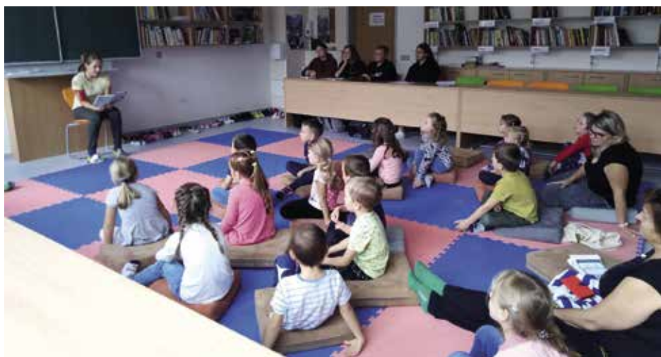
Předčítání utváří pouto mezi čtenářem a knihou