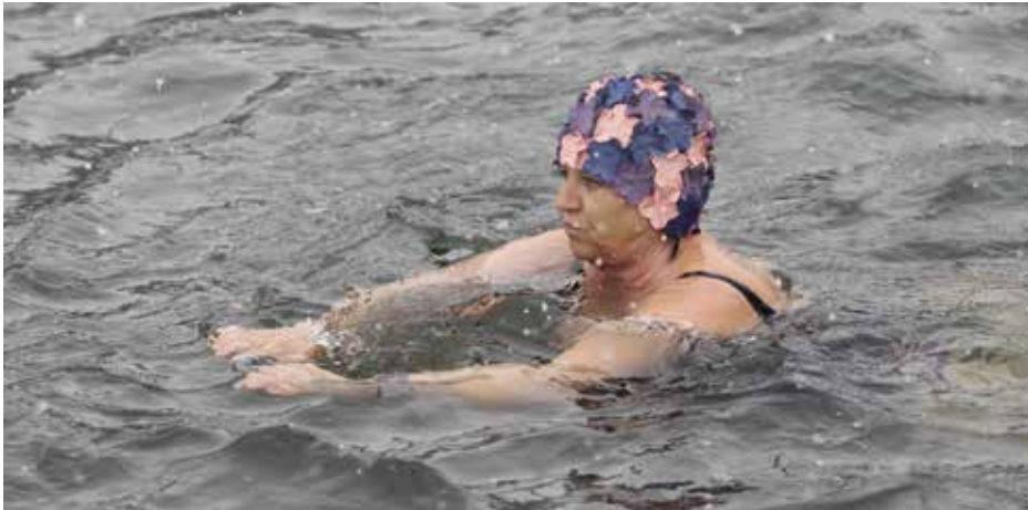
Plavání s otužilci na Nový rok patří již k tradici