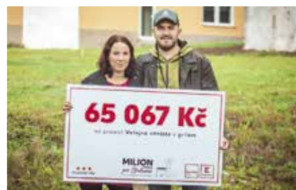
PROJEKT: Veřejné ohniště s grilem ČÁSTKA: 65 067 Kč

Aktivní zaměstnanci Charity se sídlem v Sousedovicích ve spolupráci s občany vytvoří v domově pro seniory prostor pro sousedská posezení a kulturní akce.