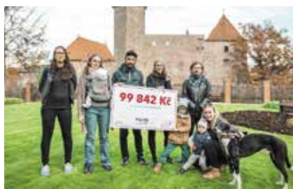
PROJEKT: Živé Strakonice ČÁSTKA: 99 842 Kč

S otevřením nové strakonické prodejny spustil Kaufland spolu s Nadací Via projekt Milion pro Strakonice a okolí . Obchodní řetězec během 3 let přerozdělí částku 1 000 000 Kč na podporu komunitních projektů ve Strakonících a blízkém okolí. Do prvního ročníku grantové výzvy se přihlásilo celkem 7 projektů. Odborná komise se rozhodla podpořit následujících 5 projektů , mezi které přerozdělila celkem 358 000 Kč . Další ročník grantového programu začne v červenci 2023.