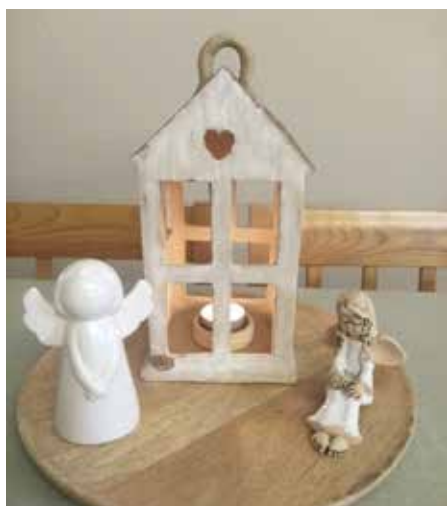
Betlémské světlo rozzáří naše domovy

Ve Strakonických si budete moci betlémské světlo odnést na Štědrý den ze stanoviště od Komerční banky, obchodního centra Maxim a ti, kteří půjdou navštívit místo věčného odpočinku, si mohou připálit svíčku u dolní brány hřbitova. Skauti budou na jmenovaných místech stát od 9 do 11 hodin.