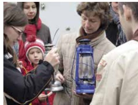
I do našeho města putuje poselství z Betléma

V letošním roce proběhne ceremoniál 10. prosince 2022 ve Vídni, kde bude během slavnostní ekumenické bohoslužby