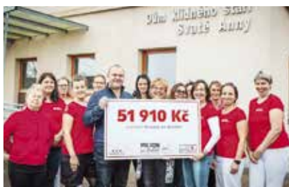
PROJEKT: Sousedě, na slovíčko ČÁSTKA: 51 910 Kč

Český svaz žen Čestice uspořádá seriál kreativních workshopů a relaxačních sousedských setkání. Cílem bude stmelit místní komunitu a předávat si zkušenosti mezi generacemi.