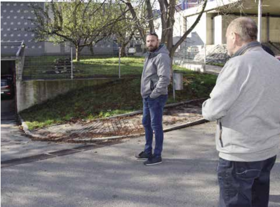
Pracovní den nového místostarosty