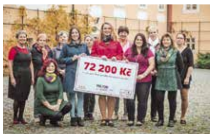
PROJEKT: Teta, pojdte mě prosím naučit...!

Skupina devíti obyvatel v Rovné se rozhodla oživit kulturní život ve své obci. Těšit se můžete na Drakiádu, Adventní setkání, Dětský karneval, Vítání prázdnin a spoustu dalších aktivit.