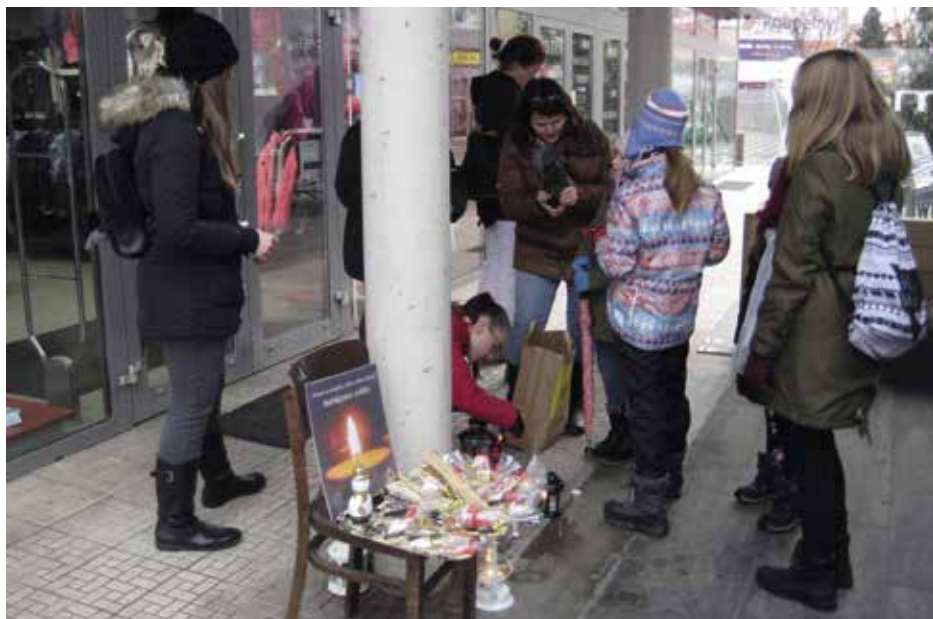
Připalování plamínku symbolizujícího mír

K předvánočnímu času se pojí celá řada zvyků. Některé mají velmi starý původ, jiné vznikly poměrně nedávno. K takovým patří i tradice přinášení betlémského světla do našich domovů.