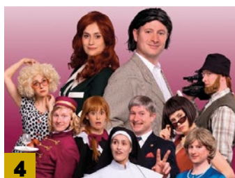
Hvězdy v divadle