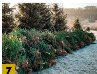
Prodej vánočních stromků