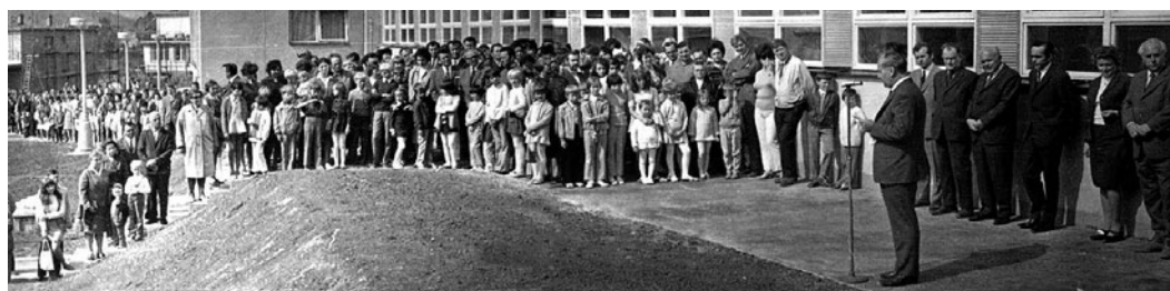
Slavnostní otevření školy 3. září 1972. Tehdy se jmenovala ZŠ Antonína Zápotockého.

Oslavy pak vyvrcholily setkáním zaměstnanců a přátel školy v kájovském Konibaru. Padesátiny tak škola oslavila opravdu velkolepě. Kéž by se škole dařilo i v další padesátce a měla samé inspirující učitele, šikovné žáky, úspěšné absolventy a spolupracující rodiče!