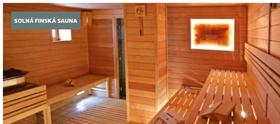
SOLNÁ FINSKÁ SAUNA

Tělo prohráté v potírně je potřeba opláchnout proudem vody, aby se z roztažených kožních pórů vyplavily nečistoty, tuk a škodliviny. Zážitkové sprchy nabízejí několik proudů vody (např. jemná mlhovina,