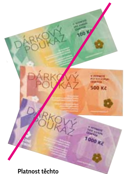
Platnost těchto poukazů končí 30. června 2023

Zároveň chystáme novou edici dárkových poukazů, kterou bude možné objednat v našem e-shopu nebo zakoupit v recepcích obou lázeňských domů v průběhu měsíce října. Pokud pomalu začínáte přemýšlet, co věnovat pod stromeček, tip je jasný. Nové dárkové poukazy budou platné do konce roku 2026. <