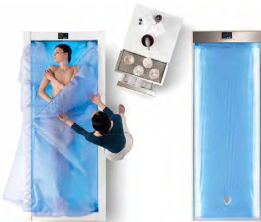
NUVOLA A SOFFIO