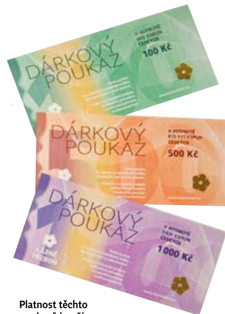
Platnost těchto poukazů končí 30. června 2023

Zároveň chystáme novou edici dárkových poukazů, kterou bude možné objednat v našem e-shopu nebo zakoupit v recepcích obou lázeňských domů již od 1. října 2022 . Pokud pomalu začínáte přemýšlet, co věnovat pod stromeček, tip je jasný. Nové dárkové poukazy budou platné do konce roku 2028. <