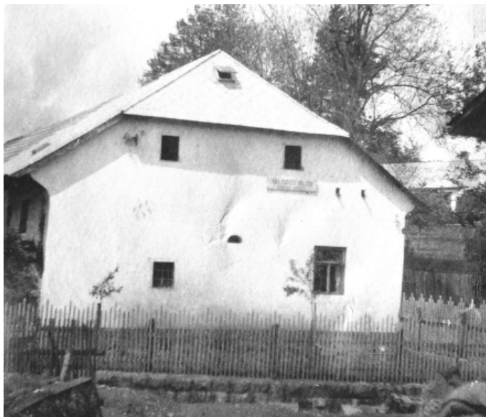
Pohled na budovu mlýna v roce 1952, ještě firemní tabulí „Válcový mlýn Bohumil Vrhel“

Stachovský mlýn měl postupně 3 technologie mletí. Původní česká stolice ( složení) bylo mletí mezi radiálně rýhovanými kameny o průměru cca 1 m, z nichž jeden stál a druhý se otáčel.