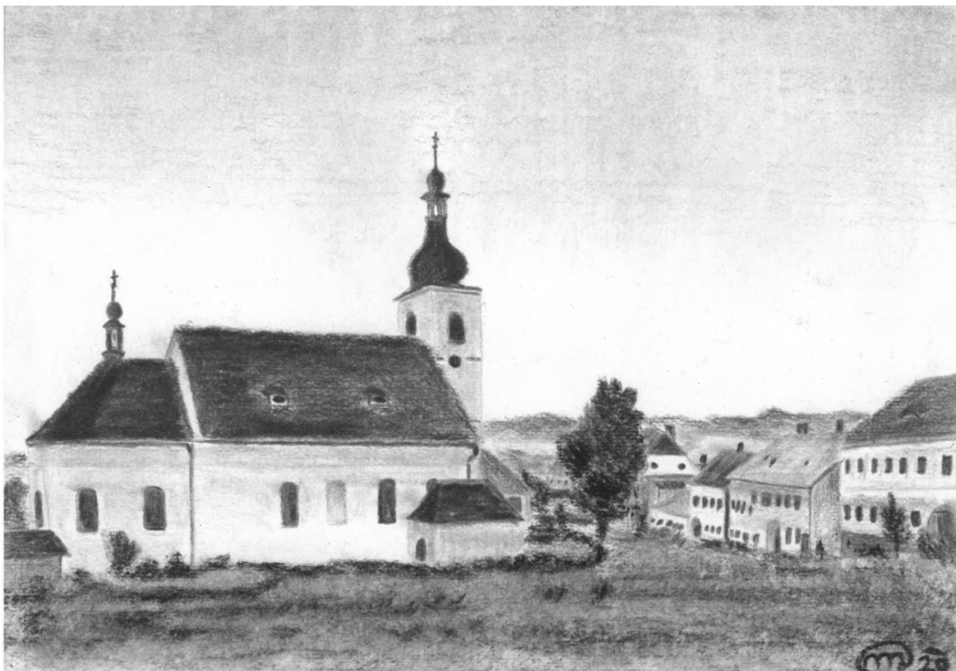
Dolní Vltavice – kostel svatého Linharta