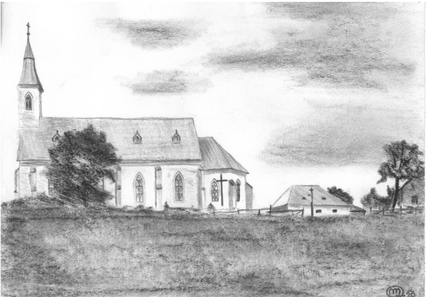
Knížecí Pláně – kostel svatého Jana Křtitele