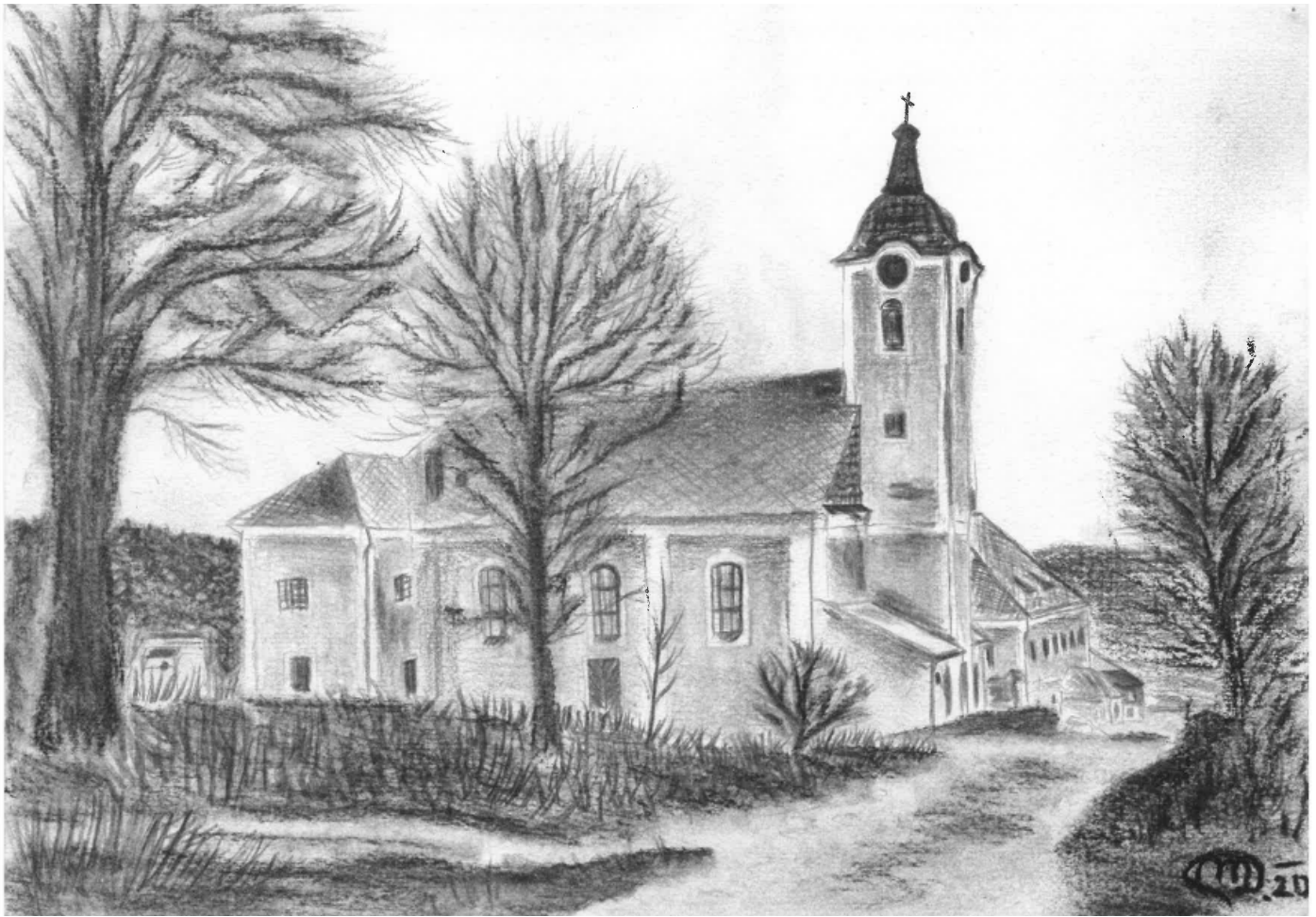
Prášíly – kostel svatého Prokopa