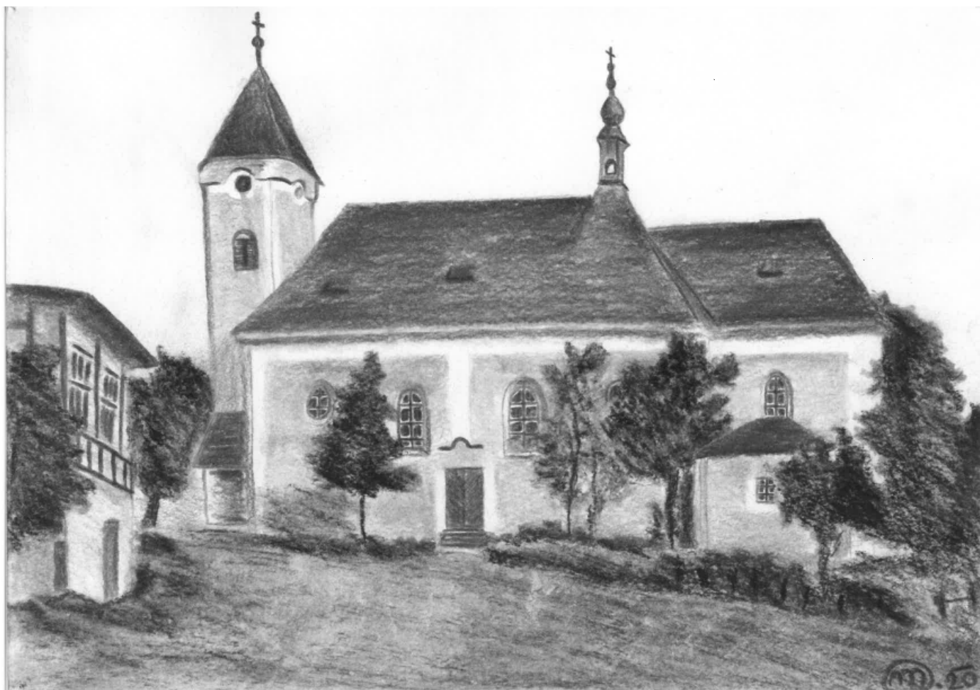
Strážný – kostel Nejsvětější Trojice