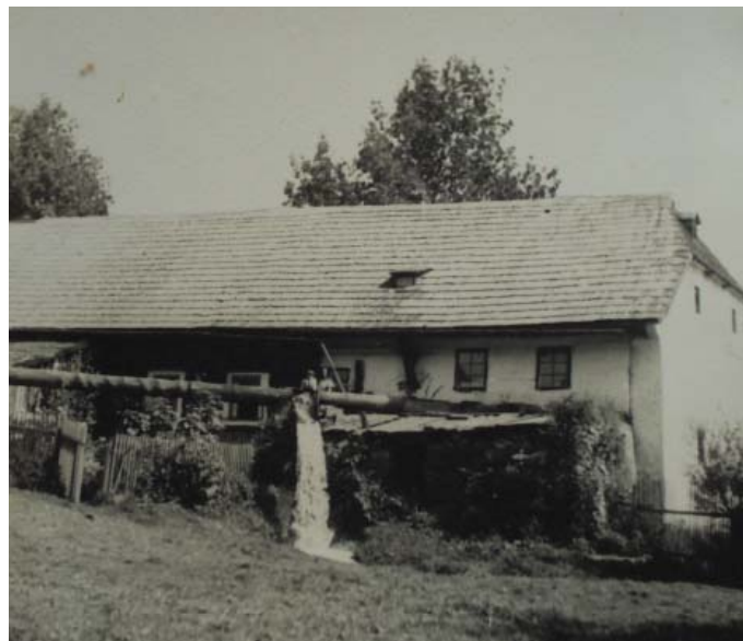
Pohled na vodní soustavu náhonu mlýna ze 20. let minulého století. V popředí dlabané vantroky