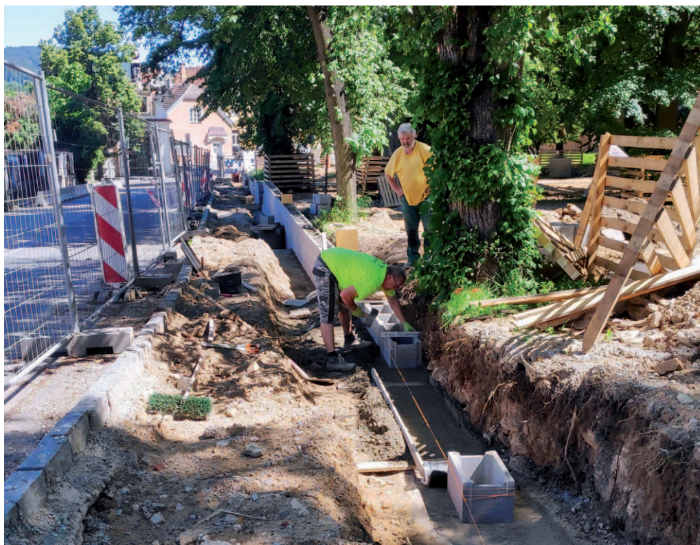
Pro oplocení parku v Hradební ulici je třeba připravit novou podezdívku.