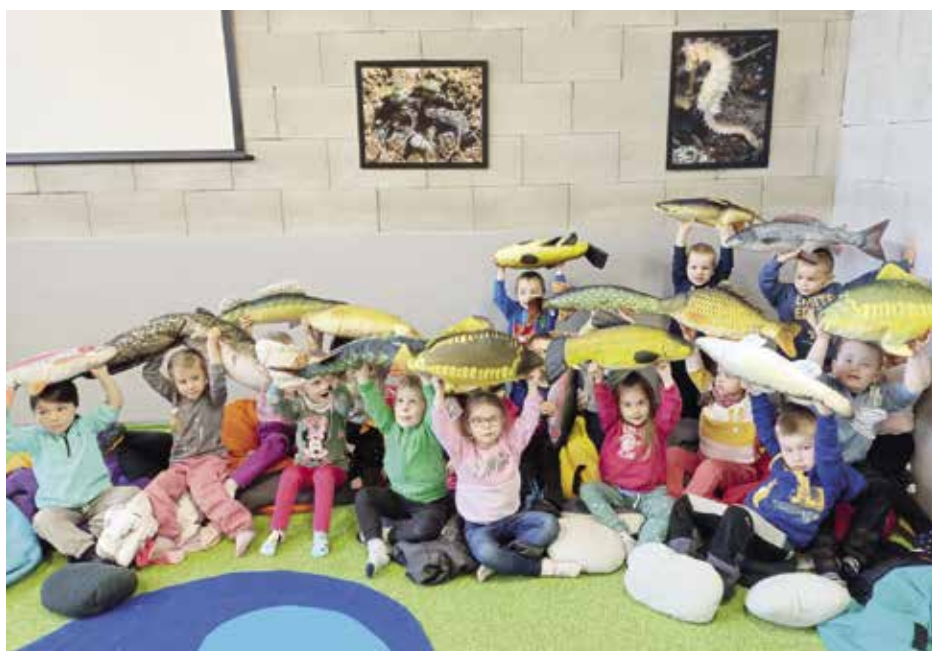
Z naučného programu Ryby, raci

kolektiv Mateřské školy Strakonice, Lidická 625