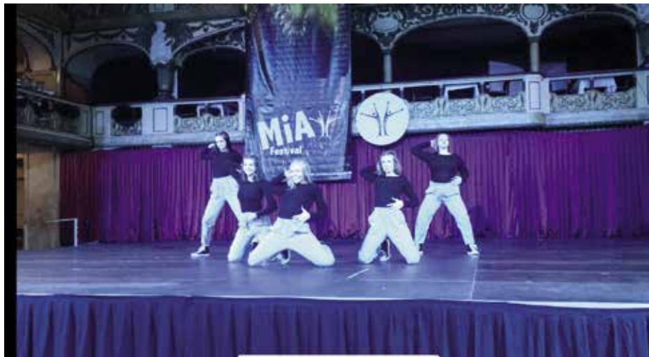
Strakonické tanečnice ze street dance získaly bronz v krajském kole