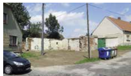
Uvolněný prostor na Střele

Na Střele vznikl po demolicí vesnického stavení prostor vhodný pro vznik veřejného prostranství. Podle návrhu by v daném místě měl vzniknout prístřešek, v němž bude možné usednout ke třem stolům. Po úpravě studny vznikne poblíž posezení ohniště, společenská hra – kuželky a lavička s výhledem na vánoč-