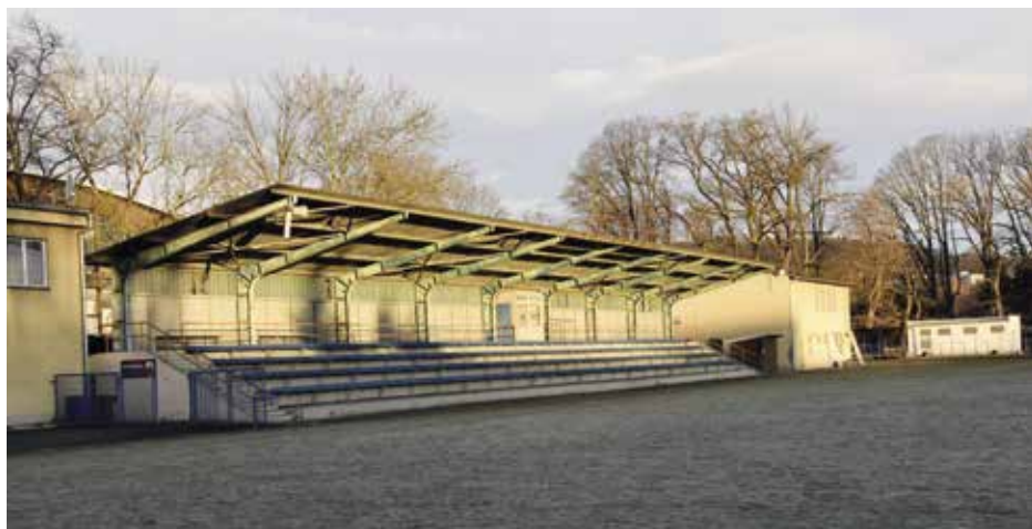
Tribunu Na Křemelce čeká kompletní rekonstrukce