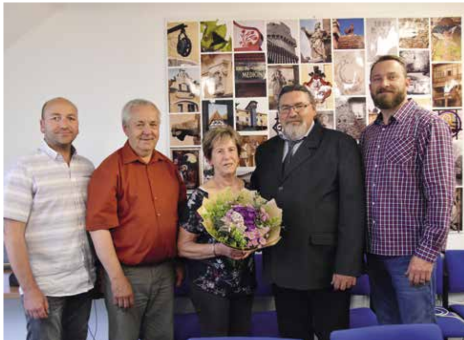
V pořadí letošní druhá Cena starosty byla předána