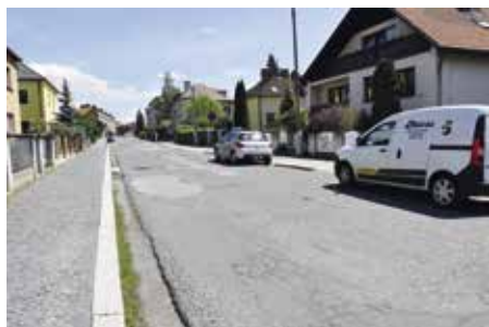
Současný pohled do ulice Máchova