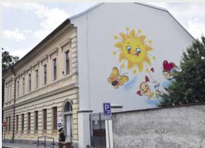
MŠ U Parku a její nová fasáda