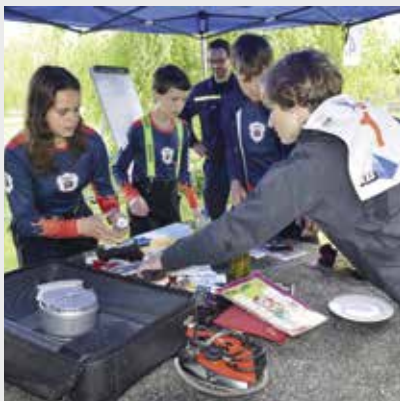
Co rychle sbalit do evakuačního zavazadla?

Dokázat, že umí obvázat krvácející ránu, postarat se o člověka v bezvědomí, ošetřit popáleniny, nebo zabalit nejnepříjemnější věci do evakuačního kufříku. To je jen krátký výčet disciplín, které museli žáci prvního a druhého stupně zvládnout, pokud chtěli uspět v soutěži – Dokaž, že umíš.