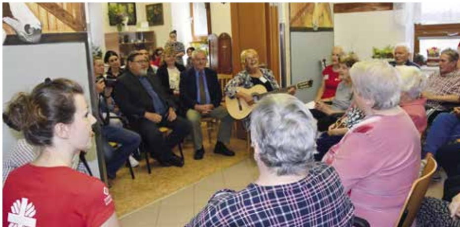
Narozeninový den u sv. Anny