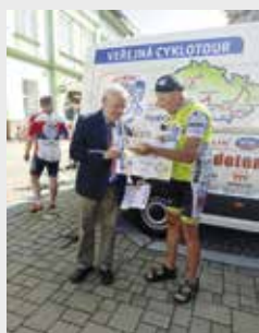
Okamžik z charitativní akce

Na kole dětem, tak zní sportovní projekt podporující onkologicky nemocné děti. V rámci tohoto projektu projel Strakonice začátkem června peloton cyklistů, který