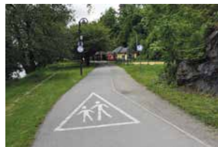
Cyklostezka bude přeložena kvůli bezpečnosti chodců

Součástí nového dopravního řešení bude úprava umístění svislého dopravního značení a doplnění o vodorovné značení, které bude důrazně upozorňovat na funkční oddělení cyklostezky od stezky pro pěší.