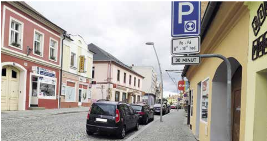
Ignorovat dopravní značení se nevyplácí