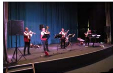
Malá muzika Nauše Pepíka