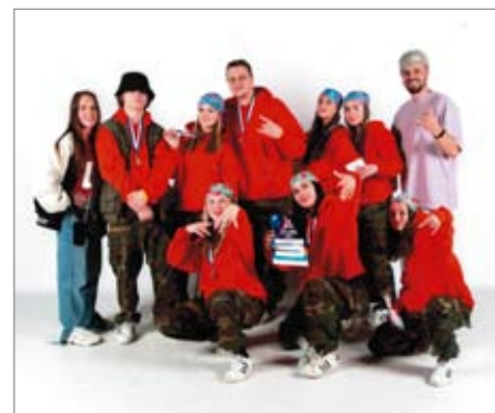
Hlavní kategorie