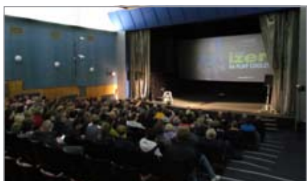
Diváci očekávají Z. Izera

V páteční večer 6. května zavítal do Kašperských Hor známý český bavič Zdeněk Izer. Jeho vystoupení si nenechalo ujít více jak 180 diváků a ti se v kašperskohorském kině dobře bavili. One man show s názvem Na plný coole, byla plná známých i málo známých vtipů v originálním podání Zdeňka Izera. Prostřednictvím plátna např. k divákům promlouval fiktivní Zdeněk Izer starší, který se spolu se svým vnukem předháněl