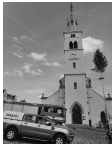
Májka na náměstí

Děkujeme všem členům SDH Kašperské Hory, kteří se do příprav a organizace akce zapojili, MĚKIS Kašperské Hory za pomoc s organizací a materiálním zabezpečením, TS Kašperské Hory za asistenci při umístění májky, Statkům Kašperské Hory za slámu na výrobu čarodějnice a všem, kdo