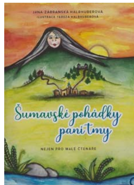
Obálka knihy (foto: ilustrační)