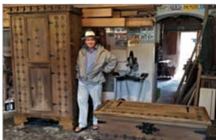
Replika gotické skříně a truhly