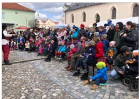
Divadelní představení

Letos se po dvouleté pauze mohla uskutečnit první venkovní kulturní akce, která byla soustředěna do okolí kostela sv. Markéty. 17. dubna za přispění příjemného jarního počasí se u kostela sv. Markéty nejdříve objevili stánkaři nabízející různý sortiment; od ručně upletené pomlázky až po ručně vyráběné páteříky. V 11:00 se těm nejmenším divákům představilo Divadlo potulného čajovníka s vtipnou