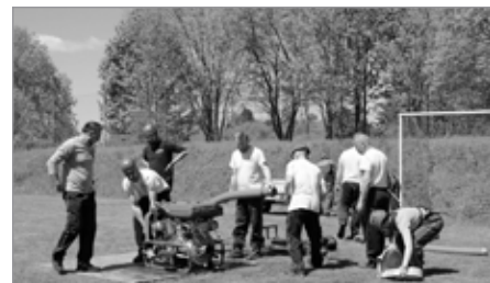
Okrsková soutěž hasičů

mohli účastnit soutěží ve všech třech kategoriích. Po prázdninách bychom rádi obnovili fungování kroužku mladých hasičů, a to pro děti od 5 let. Pro bližší informace sledujte naše facebookové stránky. Těšíme se na viděnou.