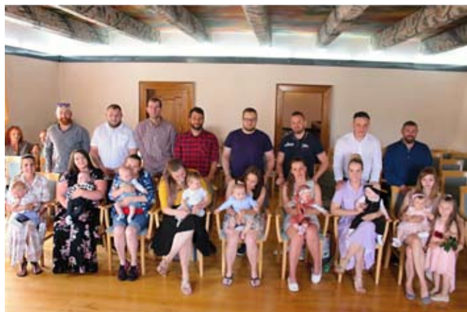
Nejmladší občanci města a jejich rodiče