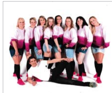
Rodičovská kategorie

Z 1. místa na regionu v Plzni byl jistý postup do souboje 13 týmů na Mistrovství Čech v Praze, kde po postupu do finále byla formace zařazena do TOP 3 a vezli jsme do Kašperka bronzový kov s postupem na Mistrovství ČR.