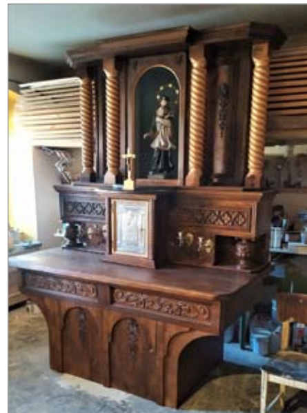
Oltářní retabulum