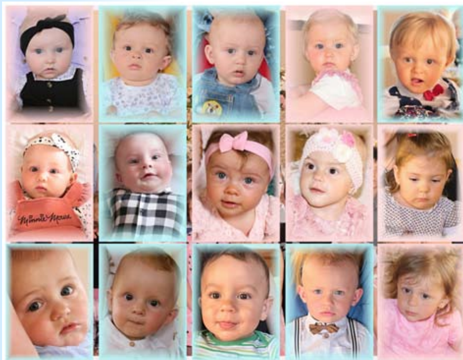
Děti, které byly uvítány mezi občany města Kašperské Hory

Slavnostní program se uskutečnil po dvouleté odmlce