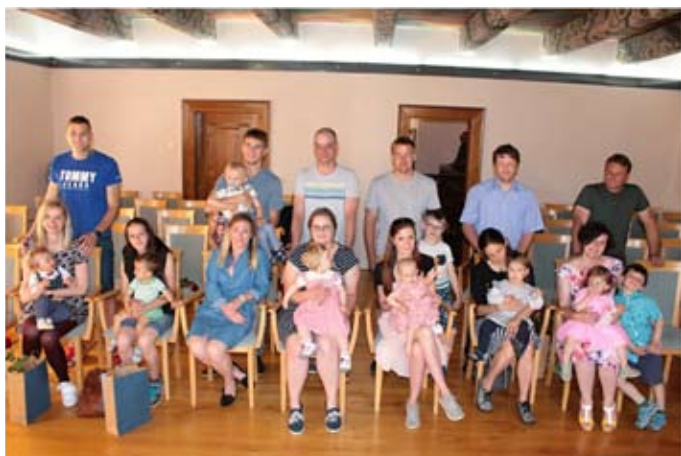
Nejmladší občanci města a jejich rodiče