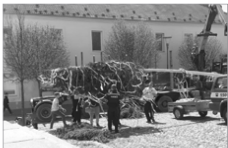
Zdobení májky

Jistě jste si všimli, že letos je na náměstí něco, co tam roky nebylo. Ano, před kostelem stojí májka. Ve spolupráci s MĚKIS Kašperské Hory jsme zrealizovali myšlenku postavit májku v centru města. Celé akci předcházelo mnoho dní příprav. 30. dubna jsme se od ranních hodin věnovali přípravám, aby bylo vše na svém místě. Plocha na náměstí bohužel nedovoluje stavění májky tradičním způsobem, proto byla použita těžká technika. Po ozdobení a postavení májky bylo vše připraveno pro malé i velké návštěvníky. Ti malí si