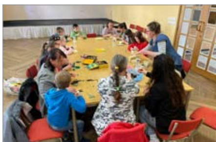
Tvoření v Horském klubu

P.S. Malý dovětek. Od začátku března společně s několika milými sousedy jezdíme