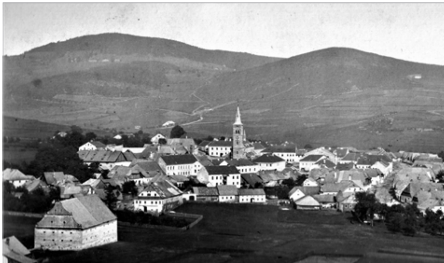
Kašperské Hory s horami Žďánov a Chlum v pozadí, před rokem 1890