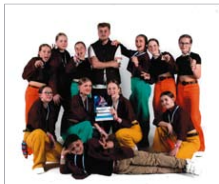
Juniorská kategorie