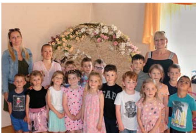
Děti z mateřské školy si připravily pěkný program