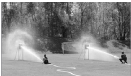
Okrsková soutěž hasičů

V sobotu 14. května se na fotbalovém hřišti konala okrsková soutěž hasičů. Do Kašperských Hor se sjela družstva sborů dobrovolných hasičů obcí Dolejší Těšov, Hartmanice, Kašperské Hory, Rejštejn, Srní a Svojše, aby se spolu utkala v požárním útoku a štafetě s překážkami. Soutěžilo se v kategoriích děti, ženy