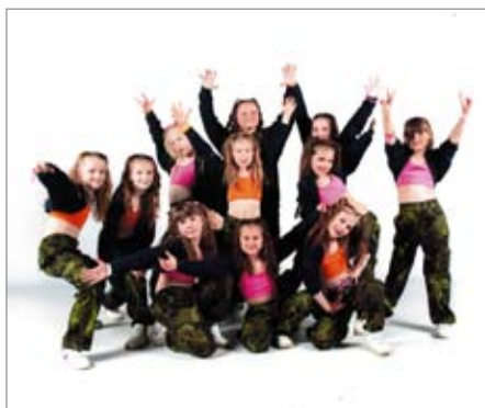
Dětská kategorie