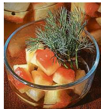
Naložené melounové slupky jsou překvapivá chuťovka.