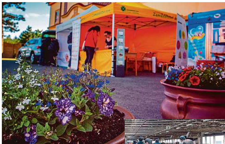
Zemědělci chystají Dny otevřených dveří na 17. a 18. června. Budou plné zábavy.

Další zemědělské provozy otevře například Obchodní družstvo Soběšice v Plzeňském kraji, kde nechají návštěvníky nahlédnout do provozu farmy s mo-