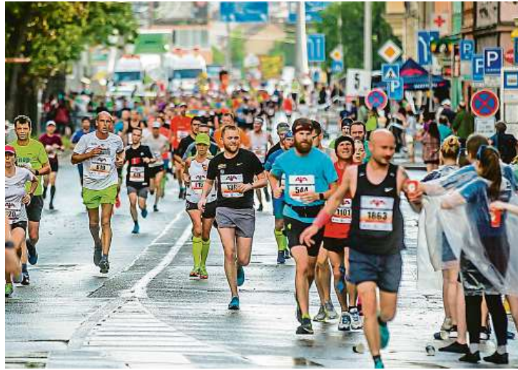
Běžci podesáté obsadili centrum Českých Budějovic. Závod ovlivnil silný déšť, který město zasáhl před hlavním závodem.

Minulý týden se běžel jeho jubilejní ročník. Potvrdilo se, že akce stále patří mezi nejvýznamnější sportovní události ve městě, ale ztrácí světový punc. Už řadu let na jih Čech nemíří nejlepší afričtí běžci, vytratil se i přední Evropané. Zároveň zájem místních atletů už není takový i proto, že mnozí si atmosféru jedinečného závodu již vyzkoušeli.