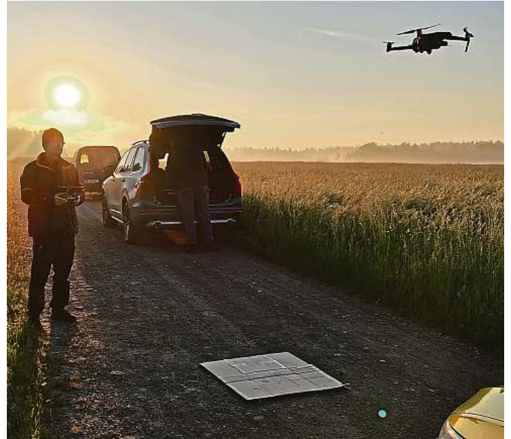
Dobrovolníci začínají pracovat v půl páté ráno a končí s východem slunce, kdy se půda oteplí.

Co udělat se srnčetem po nalezení, rozhodují odborníci podle jeho stáří.