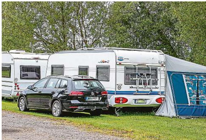
Na břehu Lipenské přehrady v Černé v Pošumaví mají jeden z kempů připravený zejména pro karavany a obytné vozy.

Do prvního ročníku výzvy kraje, který tentokrát rozdělil necelé čtyři miliony korun, se přihlásilo celkem osmnáct zájemců, mezi nimiž bylo pět obcí. Úspěšní žadatelé mohli dostat až půl milionu korun. Podařilo se to čtyřem z nich, například Roudné na Táborsku,