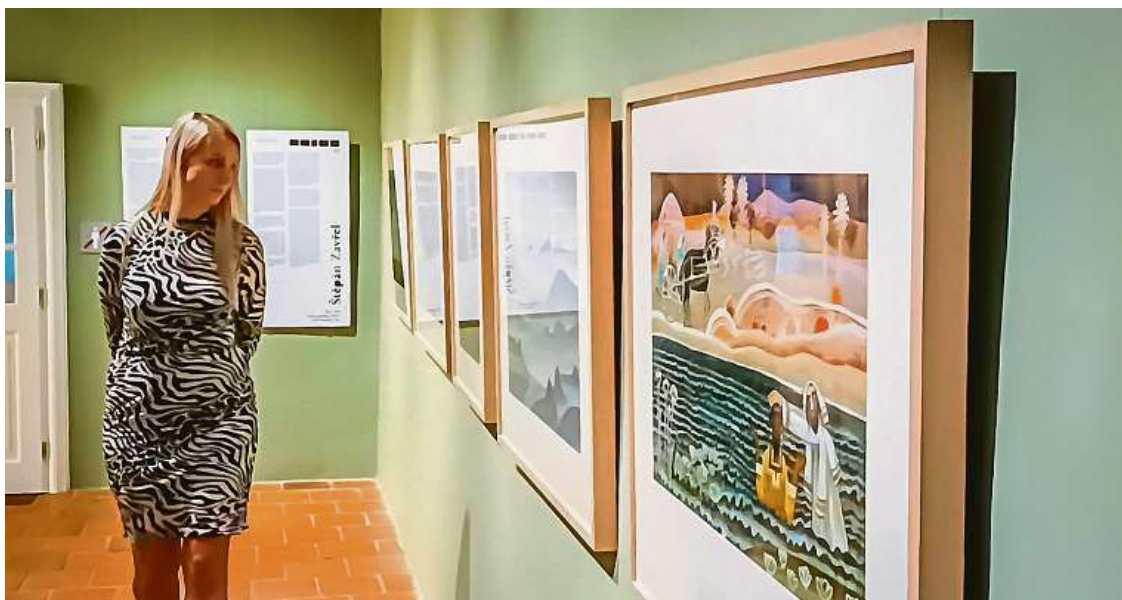
Sbírku dětských ilustrací prodal Krumlovu sběratel a nakladatel Otakar Božejovský.