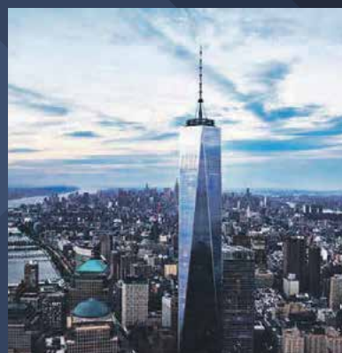
► Vysílač na střeše One World Trade Center v New Yorku

Pro zaměstnance závod nabízí širokou škálu zajímavých benefitů: náborový příspěvek pro nového 30 000 Kč, atraktivní finanční ohodnocení, věrnostní odměny, příspěvky na penzijní připojištění a životní pojištění,