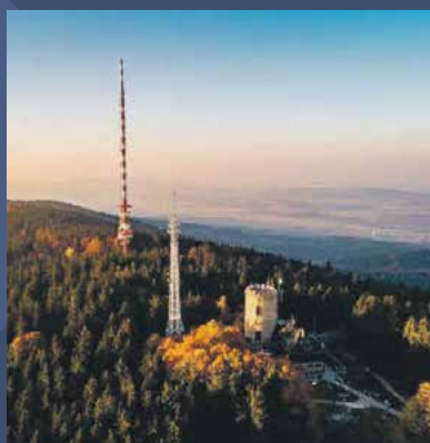
► Vysílač České Budějovice – Kleť

V loňském roce společnost uzavřela strategické partnerství se Západočeskou univerzitou v Plzni (ZČU) a s Českým vysokým učením v Praze (ČVUT). Zároveň spolupracuje