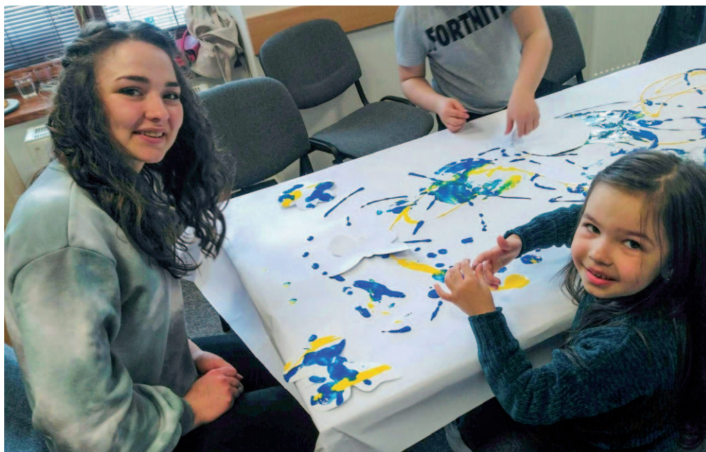
Žlutomodrý optimistický svět vznikl nejen na papíře při setkání rodin z Ukrajiny.