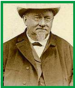
Vojta Náprstek, český vlastenec a mecenáš

Město Gotha provází ale ještě jedna zajímavost. Je spojeno s českým vlasten-