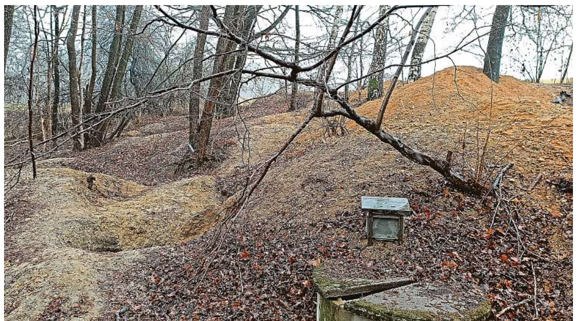
Kopáči vltavínů v Vrábče na Budějovicku při nelegální těžbě poškozuji les. Na místě po sobě nechávají až tři metry hluboké jámy (horní snímek), kolem nichž často zůstává nepořádek.