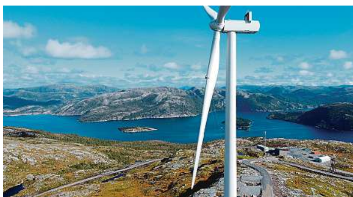
Práce plná adrenalinu v ohromných výškách. „Spiderman“ Vladimír Dospěl na turbíně ve Flatangeru v Norsku.