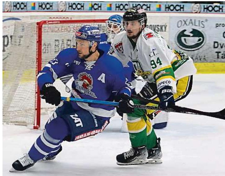
Táborští hokejisté (v modrém) byli nejlepším celkem druhé ligy. V baráži o první ligu ale nestačili na Šumperk.

„Po všech covidových omezeních se nám povedlo tým zachovat. Od klubu jsme měli daný cíl hrát o nejvyšší pří-