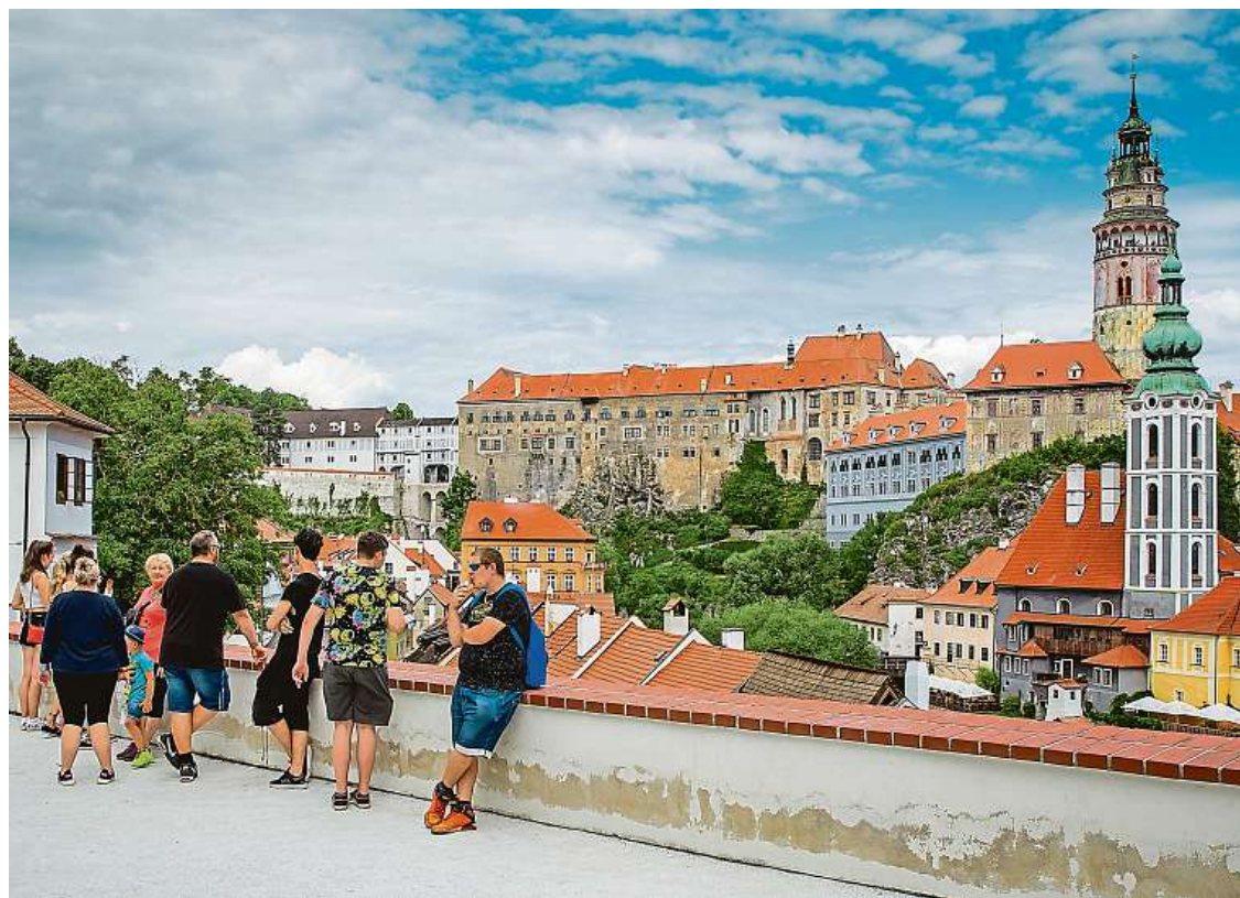
Čeští turisté využívají toho, že centrum Českého Krumlova je výrazně volnější než v předchozích letech, kdy ho zaplavovaly davy turistů z Asie. Těžké časy naopak zažívají místní provozovatelé služeb.

První jarní akce již vyhlížejí i provozovatelé ubytovacích zařízení, pro něž jsou příslibem nových klientů. „Oproti minulým letům je to určitě zlepšení. V současné době máme zcela plno.