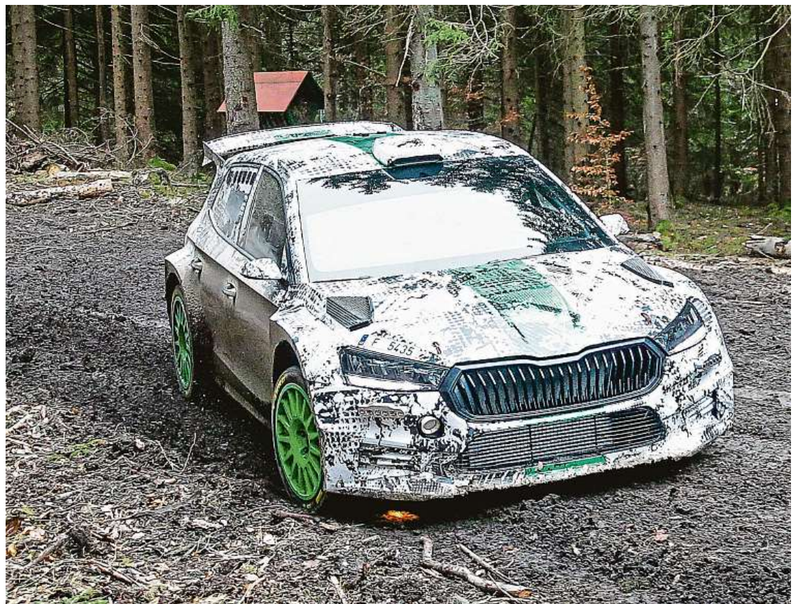
Kris Meeke testoval u Benešova nad Černou nový závodní speciál Škoda Fabia IV Rally2. Proto měl auto ještě částečně zamaskované. Na zdejších tratích se v květnu pojede také tradiční Rallye Český Krumlov.

Kromě Meeke testovali ještě další přední jezdci Jan Kopecký a Emil Lindholm.