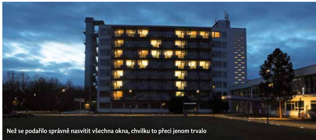
Než se podařilo správně nasvítit všechna okna, chvíli to přeci jenom trvalo

Můj otec byl velmi dobrý fotograf, byť, bohužel, ne profesí. A tak již