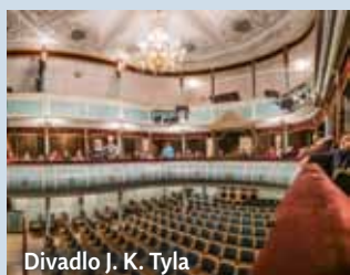
Divadlo J. K. Tyla