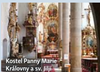
Kostel Panny Marie Královny a sv. Jiljí