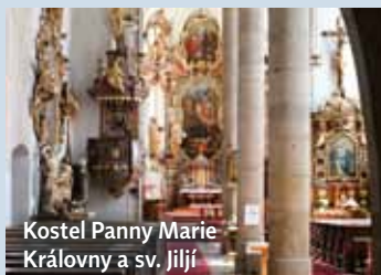
Kostel Panny Marie Královny a sv. Jiljí