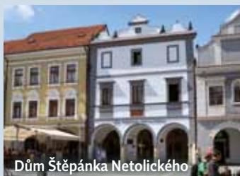
Dům Štěpánka Netolického