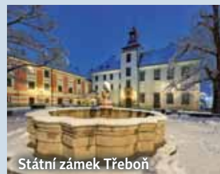
Státní zámek Třeboň